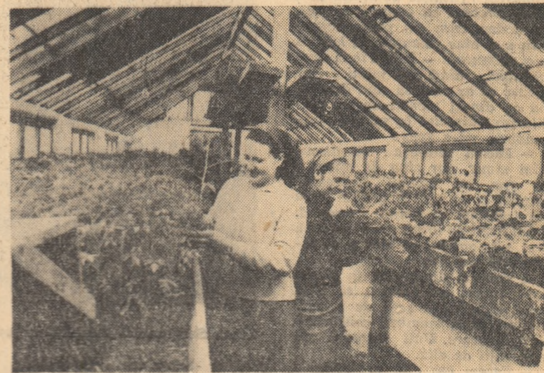
Colectivștii din Giocor, cultivă în acest an culturi forțate pe o suprafață de 550 m.p. de sere și pe 1.080 m.p. de răsadnițe. În fotografie un aspect din seră

Veniturile mari bănești realizate în anul trecut au dat posibilitatea gospodării să repartizeze lunar ansumul băneștilor între 10 și 12 lei la ziua-muncă. La sfârșitul anului s-a completat până la 16 lei la ziua-muncă.