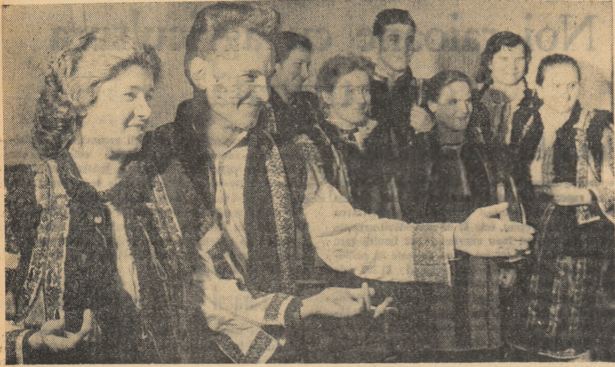
Brigada artistică de agitaj din comuna Botoșana, regiunea Suceava, este mult apreciată de către tărâni muncitori pentru spectacolele frumoase pe care le prezintă pe scena câminului cultural. În fotografie: un aspect din timpul prezentării unui spectacol.