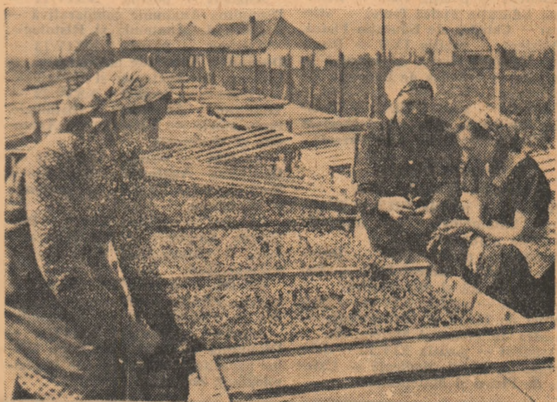
Gospodăria agricolă colectivă din Turdaș, raionul Orăștie, produce în fiecare an cantități însemnate de legume pentru aprovizionarea piețelor din orașele apropiate. Răsadnițele au fost amenajate din timp și în acest an, după cum se vede în fotografie

In planul de producție pe acest an am prevăzut să lăscăm pentru