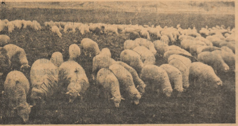
Colectiviștii din Apoldul de Sus au hotărît ca în acest an să realizeze în medie pe cap de vacă furajată o producție de 3.000 litri lapte, iar pe cap de oaie o producție de 48 litri lapte și 2.300 kg lînă semințină. In fotografia de jos: o parte din bovine în timpul furajării în grajd. In fotografia de sus: turma de oi la pășunat.

I. PASC cercetător la stațiunea experimentală horticolă Geoagiu