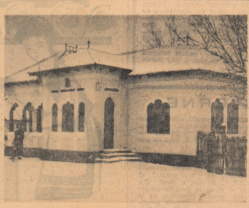
Casa cea nouă a colectivității Gh. Rîca din comuna Rătești, raionul Găești, — cea pe care o vedeți în fotografie — a fost vizitată de mulți oaspeți care au venit în gospodărie pentru a vedea belugul și bunăstarea oamenilor de aici.

Pentru a putea face față cu succes sarcinilor mari ce le revin o dată cu colectivizarea întregii regiuni S.M.T.-urile noastre vor fi dotate în acest an între altele cu încă 598 tractoare, 275 combine de cereale, cu 400 semănători 2-S.P.C.-2. Strădăniile noastre sînt concentrate acum în ultimele pregătiri ale brigăzilor din S.M.T.-uri în vederea desfășurării la timp și în condiții agrotehnice superioare a lucrărilor de primăvară, care vor începe în curînd.