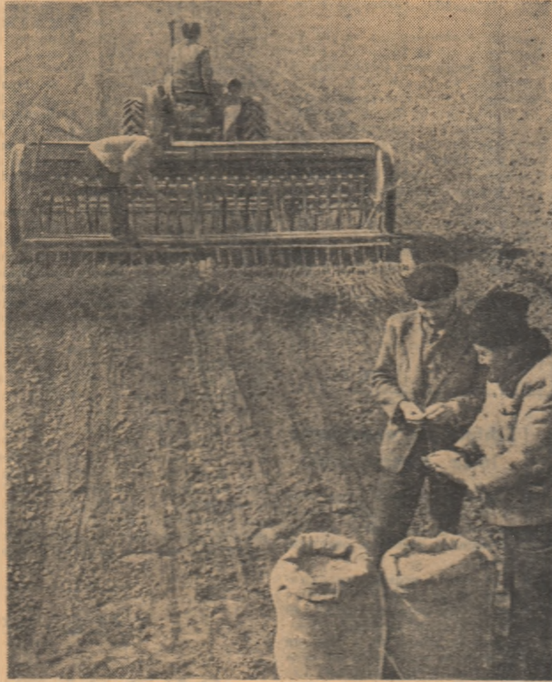
Folosind timpul prielnic, mecanizatorii de la G.A.S. Fetrești, regiunea București, au început însămînțatul culturilor prevăzute pentru epoca I, așa cum se vede în fotografie.