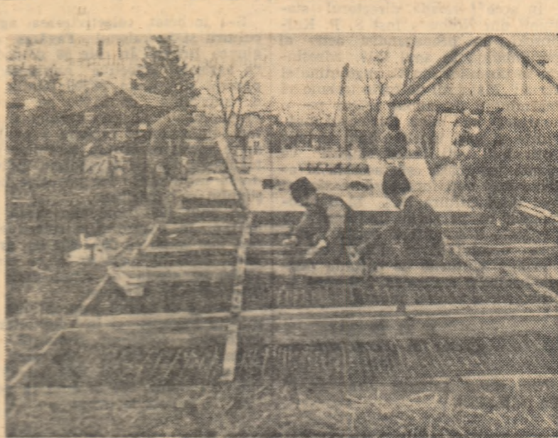
În anul acesta gospodăria colectivă din Culciul Mare, raionul Satu Mare, va cultiva ca legume o suprafață aproape dublă față de anul trecut. Pentru a obține legume cît mai timpurii, colectivști au luat din vreme măsuri pentru a amenaja răsadnițele și a însămînța primele culturi. În fotografie: eișiva din membrii brigăzii legumicole lucrînd la răsadnițe.

Insușindu-ne prevederile Congresului al III-lea al partidului, în cursul anului 1961 am mai mărit suprafața livezilor cu încă 14 ha. De asemenea an de an am îmbunătățit raportul între specii, ajungînd ca în prezent mărul să