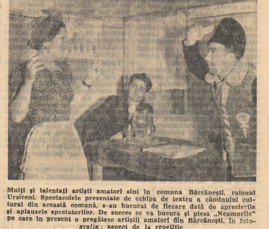
Mulți și talentați artiști amatori sînt în comuna Bărcănești, raionul Urziceni. Spectacolele prezentate de echipa de teatru a cîminului cultural din această comună, s-au bucurat de fiecare dată de aprecierile și aplauzele spectatorilor. De succes se va bucura și piesa „Neamurile” de care în prezent o pregătesc artiștii amatori din Bărcănești. În fotografie: aspect de la repetiție