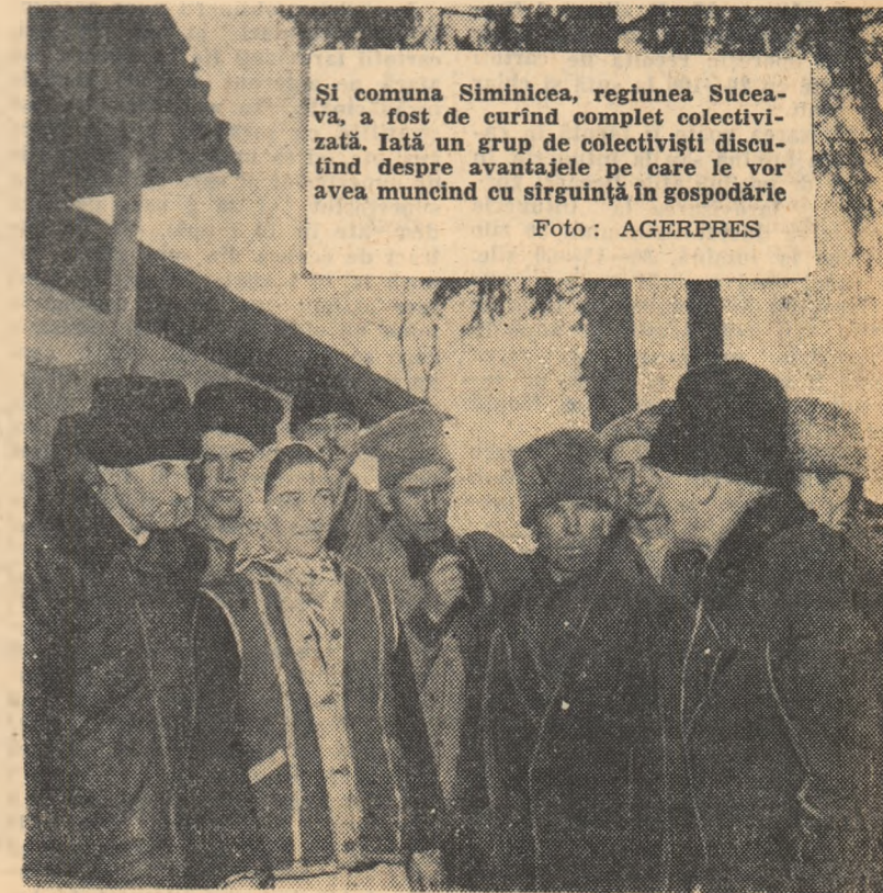
Și comuna Siminicea, regiunea Suceava, a fost de curînd complet colectivizată. Iată un grup de colectivști discutînd despre avantajele pe care le vor avea muncind cu sirguință în gospodărie

Datorită înzestrării brigăzilor speciale din stațiunile de mașini și tractoare cu noi utilaje, 65 la sută din lucrările de terasare a terenurilor erodate pentru plantarea lor cu pomi și viță de vie se fac anul acesta cu mijloace mecanizate.