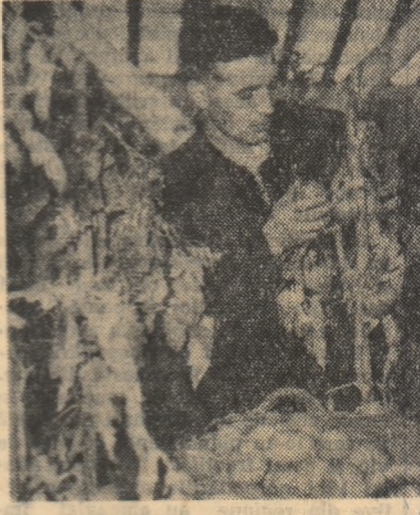
Consolidarea succesului obținut — principala noastră preocupare

La chemarea Comitetului raional de partid, aproape toate gospodăriile colective din raionul Calafat și-au construit sere, ceea ce le dă posibilitatea să realizeze însemnate venituri bănești, în perioada de anulul cînd sursele de venituri sînt mai reduse.