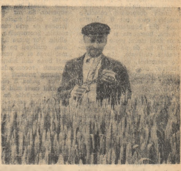
Brigadierul Vasile Ardelean în mijlocul lanului de gru de unde a recoltat în 1961 cite 4.040 kg la hectar.

Belșugul și bunăstarea și-au dat mina în această comună. Acest lucru îl cunoști de îndată ce intri în satul de mult colectivizat și stai de vorbă cu locuitorii de aici. Mulțimea de case noi de locuit, cîmînu cultural, biblioteca, cinematograful, dispensarul uman și cel veterinar, cele peste 200 de biciclete și 4 motoare, sutele de antene de radio, îmbrăcămînta colectivștilor dar mai ales modul de gîndire, gradul de cultură la care au ajuns precum și aspirațiile lor sînt mărturie vii ale vieții noi pe care o duc membrii gospodăriei colective din Batăr.