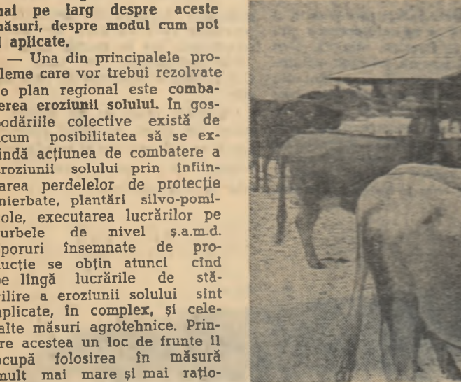
Ca și alte gospodării colective din regiunea Iași, și cea din Pribesti își dezvoltă neîncetat sectorul zootehnic. În prezent gospodăria are 432 taurine din care 181 vaci de lapte, 25 juninci și 218 tineret bovine. Numai ferma de vaci le-a adus colectivistaților în anul trecut un venit de 267.300 lei. În fotografie: o parte din vacile gospodăriei.

turile tehnice, la plantele furajere etc. Pe pînă zona gospodăriei colective din Letcani în suprafața de 22 ha unde s-au folosit amestecuri potrivite de ferturi și s-a aplicat un întreg complex de măsuri agrotehnice, producția de masă verde a ajuns la 15.000 kg la ha, față de numai 3.000 kg la ha pe terenul nemolat. — În încheiere dorim să ne spuneti cîteva cuvinte despre sprijinul pe care-l vor da specialiștii stațiunii la direcția mării producției agricole. — Ne vom intensifica eforturile pentru creșterea și producerea de semînțe din solurile și hîrtișii cu productivitate ridicată, recomandată pentru regiunea noastră. În ceea ce privește agrotehnică vom continua și mai activ cercetările pentru a pune la îndemîna colectivista metode cît mai perfecționate de lucrare a pămîntului. În anul acesta cercetătorii stațiunii noastre îndrumă direct un număr de 25 gospodării colective, față de numai zece în 1961. Nu vom neglija nici celelalte mijloace de popularizare a metodelor înalte în rândul colectivistaților. Printre aceste mijloace pot fi amintite conferințele ținute pe plan regional, organizarea de vizite la stațiune, instruirea cadrelor de colectivisti, publicații etc.