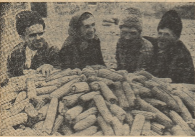
Aplicînd întocmai metodele agrotehnice înalte, membrii gospodăriei agricole colective din comuna Moța, raionul Pașcani, au reușit să obțină anul trecut o producție de 4.300 kg porumb boabe la ha.