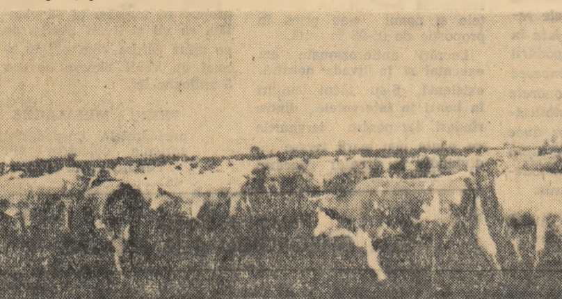
O parte din vacile de lapte ale gospodăriei.