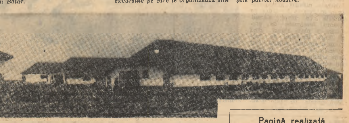
Obiectivul aparatului fotografic n-a putut cuprinde decît 3 din cele 16 construcții cite numără complexul zootehnic.