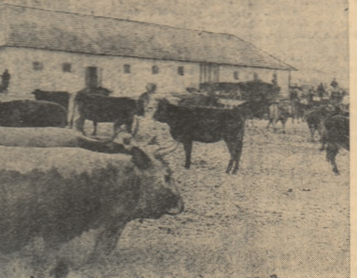
Ca și alte gospodării colective din regiunea Iași, și cea din Pribesti își dezvoltă neîncetat sectorul zootehnic. În prezent gospodăria are 432 taurine din care 181 vaci de lapte, 25 juninci și 218 tineret bovine. Numai ferma de vaci le-a adus colectivistaților în anul trecut un venit de 267.300 lei. În fotografie: o parte din vacile gospodăriei.