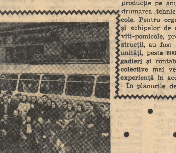
Inainte de plecarea în excursie cei 74 de colectivști au ținut neapărat să se fotografieze.

Sprijinite în mod concret și permanent, gospodăriile colective din regiunea noastră se vor întări și dezvolta astfel încît să obțină rezultate tot mai bune în sporirea producției agricole.