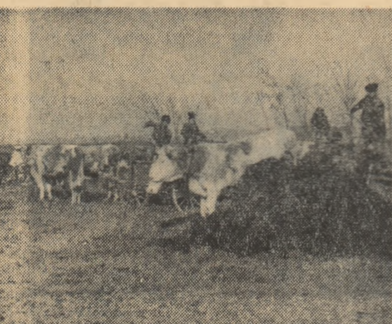
Transportul gunolului la cîmp este o preocupare de seamă a colectivștilor din Simbăta.

cu pește, constituind o nouă sursă de venituri. Nu ne îndolm că — întreprinzători cum sînt — colectivștii din Simbăta vor include în viitorii ani toate acestea în planurile lor de producție.