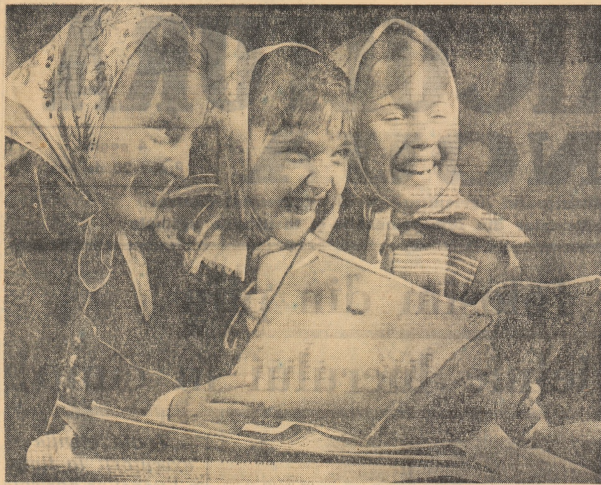
Tinere cliitoare ale bibliotecii din comuna Bodo, regiunea Banat.

ținerea unei producții mari, la consolidarea economică-organizatorică a gospodăriei colective. La Berivoii Mari, colectivității m-au primit cu bucurie și m-au asigurat de tot sprijinul lor. Am fost cazat în bune condiții. Atât membrii consiliului de conducere al gospodăriei cât și brigadierii m-au explicat cu răbdare măsurile luate pentru executarea lucrărilor de primăvară la un înalt nivel calitativ. Încă din prima zi am pornit hotărât să pun în practică toate cunoștințele și toată puterea mea de muncă. Pe colectivități din brigada legumicolă îi ajut să pună bazele unei grădini de legume și zarzavaturi. Am stabilit cu consiliul de conducere ca împreună cu colectivității să organizăm loturi semincere pentru ca să putem ajuta și alte gospodării colective cu semințe de mare productivitate. Ing. SILVIU BORZA