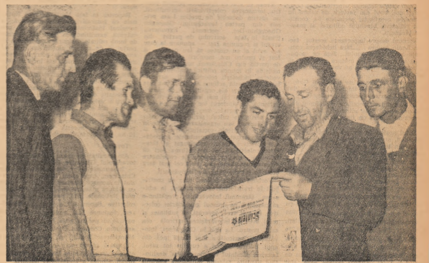
De cum au intrat în posesia ziarelor, colectivizii din comuna Tărtășești, regiunea București, citeșo cu interes documentele sesiunii extraordinare a Marii Adunări Naționale