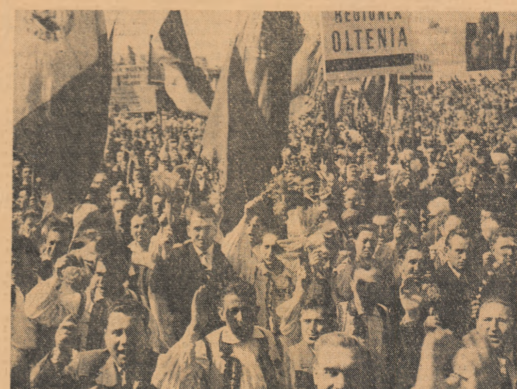
Trece coloana celor 11.000 de participanți la sesiunea extraordinară a Marii Adunări Naționale.