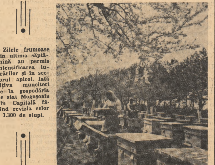
Zilele frumoase din ultima săptămînă au permis intensificarea lucrărilor și în sectorul apicol. Iată cîteva muncitori de la gospodăria de stat Mogosoaia din Capitală făcînd revizia celor 1.300 de stupi.