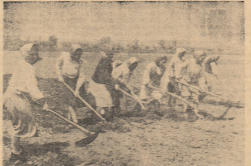
Prășitul sfeclii de zahăr este în toi și la gospodăria colectivă „Tîndra Gerdă” din comuna Dais. În fotografie: un grup de colectivistați din brigada a V-a care e frunzată la lucrările de întreținere.

Colectivii din Frătești, comuna care aparține de orașul Giurgiu, îndrumați de organizația de partid, au folosit din plin zilele bune de lucru la efectuarea însămînțării de primăvară. Lucrînd cu mijloacele mecanizate ale S.M.T.-ului Băneasa, cit și cu forțele proprii, ei au reușit să însămînțeze toate culturile de primăvară pe o suprafață de peste 1.300 ha. la timp și în bune condiții. Astfel semănatul, culturile au răsărit și s-au dezvoltat bine. O dată cu plantele au răsărit și au crescut însă și buruienile, amenințînd pe alocuri cu înăbușarea tinerelor plante.