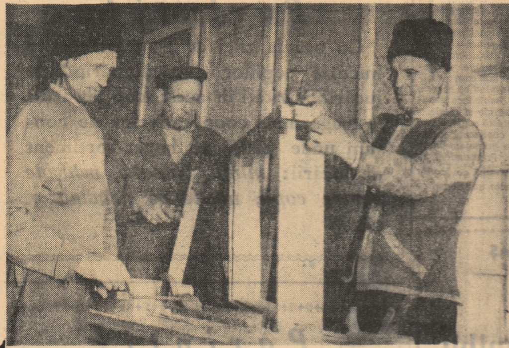
Colectivității din echipa de constructori de la G.A.C.-Suseni, raionul Costești, regiunea Argeș, lucrând la ramele de geamuri necesare vitoarelor construcțiilor.

Cele 53 de gospodării colective din raionul Adjud, și-au propus să ridice în acest an 68 de grajduri pentru vaci, 86 maternități de scroafe, 53 îngrășători de porci, 41 satvane, 56 de cotețe de păsări, 38 de magazii, 67 de pătule. După cum ușor se înțelege, executarea unui asemenea număr de construcții necesită un mare volum de muncă. De aceea, în majoritatea unităților din raion, ne scrie corespondentul GHEORGHIU ION, colectivității au deschis încă de la începutul lunii mai șantierul de construcții. Asemenea șantiere pot fi văzute în satele Buda, Frumușelu, Găiceana, Homocca, Păncuți, Ploscuțeni, Tătărași, Urechești, Corbița, Răchitoasa și în multe alte locuri. Subliniind aceste aspecte pozitive corespondentul critică și unele lipsuri organizatorice, din cauza cărora în unele gospodării, ridicarea construcțiilor este îngreunată. De exemplu, sfaturile populare din comunele Florești, Valea Seacă și Urșu întârzie eliberarea către gospodării a documentelor necesare, motiv pentru care acestea din urmă nu și pot ridica la timp materialul lemnos ce le-a fost repartizat.