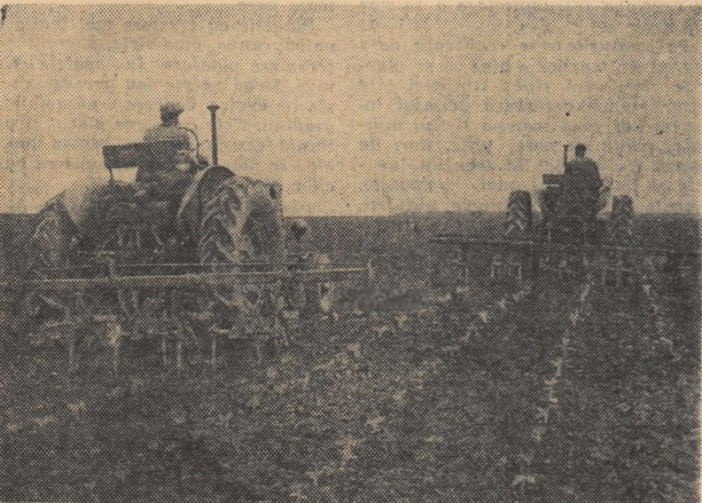
Mecanizatorii de la gospodăria agricolă de stat din Pătule, regiunea Oltenia, execută prașia la floarea-soarelui.