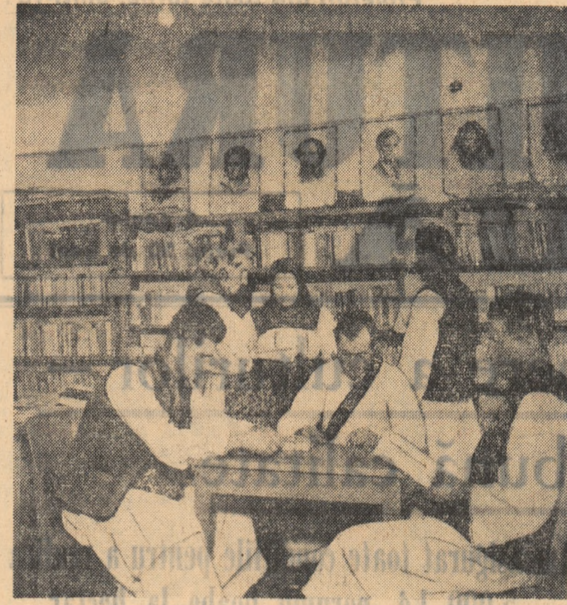
16.000 de volume numără biblioteca din comuna Negrești-Oaș. Cititorii au, pe drept cuvînt, de unde să aleagă: în fotografie: colectivități în sala de lectură.

La rîndul lor, ceilalți brigadierii își spun și ei părerea despre inginerul lor. Toți au de rostuit numele cuvinte de laudă. Constantin Păun, brigadierul legumicol, relevă, de