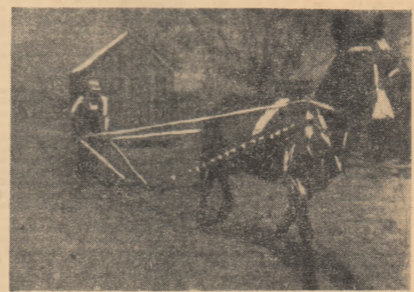
Priviţi acest clişeu: un plug de lemn tras de un catir. S-ar putea crede că fotografia a fost făcută undeva într-o colonie din Africa.