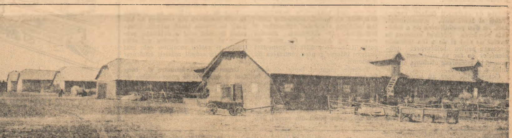
Centrul de producție și gospodăriei colective din Cobadin, regiunea Dobrogea. Aspect parțial.

șef de laborator la stațiunea experimentală hortiviticolă Blaj-Crăciunel