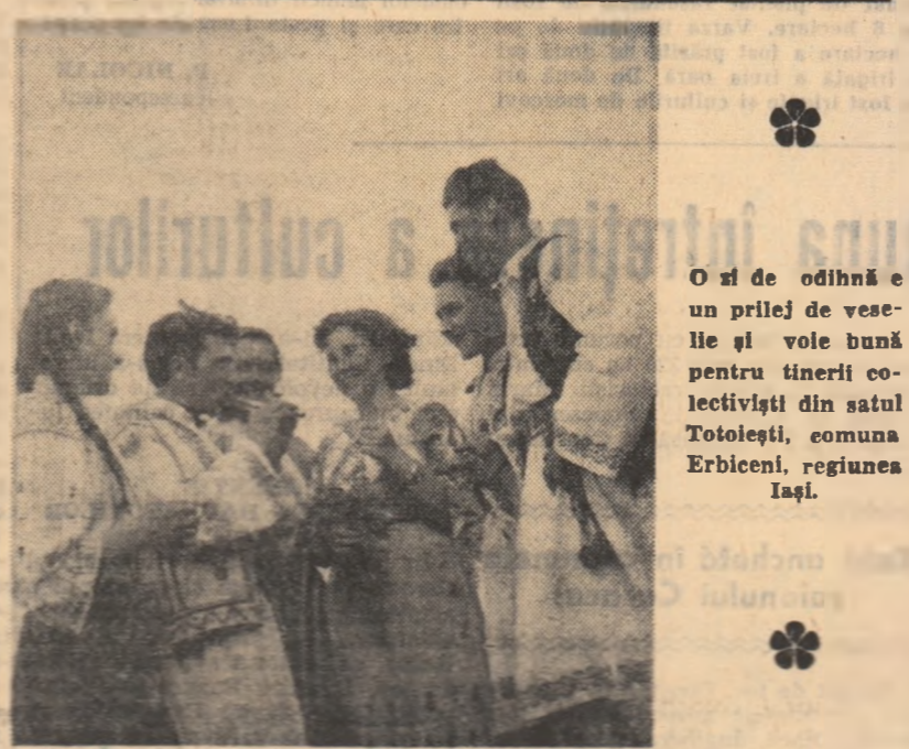
O zi de odihnă e o prilej de veselie și voie bună pentru tinerii colectivisții din satul Totolești, comuna Erbiceni, regiunea Iași.