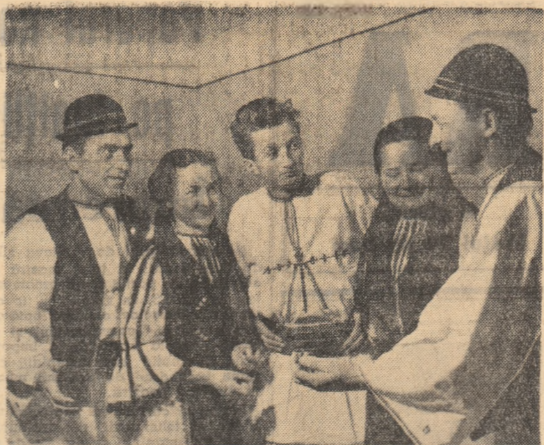
Brigada artistică de agitație a căminului cultural din comuna Valdeeni, regiunea Argeș, este mult apreciată de cetățenii din comună, cit și de cei din comuna din împrejurimi pentru spectacolele pe care le prezintă. Iată-o, în fotografie, pregătind un nou spectacol.