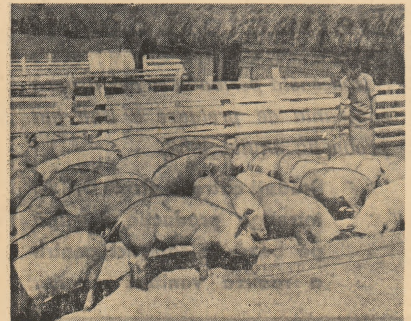
Sectorul porcine și-a arătat din plin avantajele. În 1961 gospodăria a înscasat pe porcii valorificați 929.809 lei. În acest an au fost contractați 1.200 de porci

Pentru a folosi întreaga capacitate de producție a animalelor le furajăm diferențiat pe grupe de producție, virsă și sex, iar pentru a mări pofta de mîncare a animalelor și a mări digestibilitatea furajelor hrana se împarte în tainuri formate din furaje diferite și preparate după cerințele speciei (imnulate, fermentate, tocate, amestecate etc.).