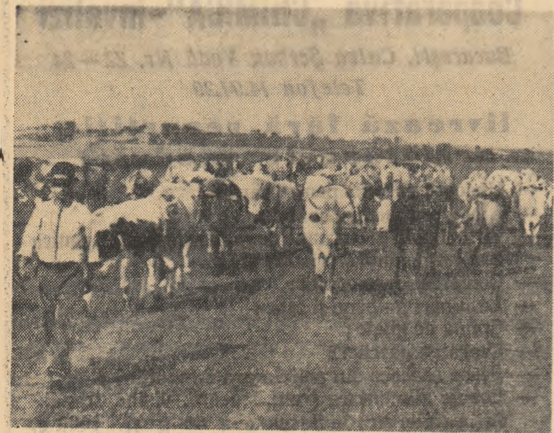
Ferma de vaci a adus în 1961 un venit de 514.679 lei, iar în acest an s-a planificat un venit de peste 800.000 lei. În fotografie: o parte din cireadă se întoarce de la pășune

CONSTANTIN NEOFIT Inginer agronom al gospodăriei