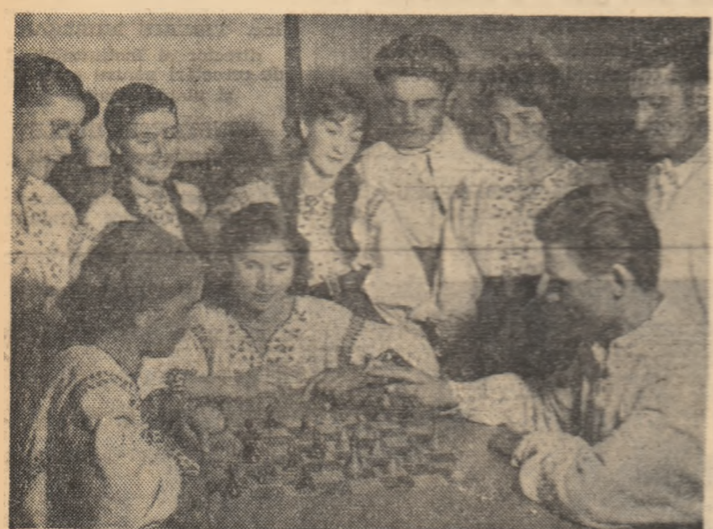
Seara, la sfîrșitul lucrului, sau în zilele de sărbătoare, la căminul cultural din comuna Comana, regiunea Dobrogea, se adună numeroși tineri pentru a face repetiții în cadrul brigăzii artistice de agitație sau a juca șah, așa cum se vede în fotografie.