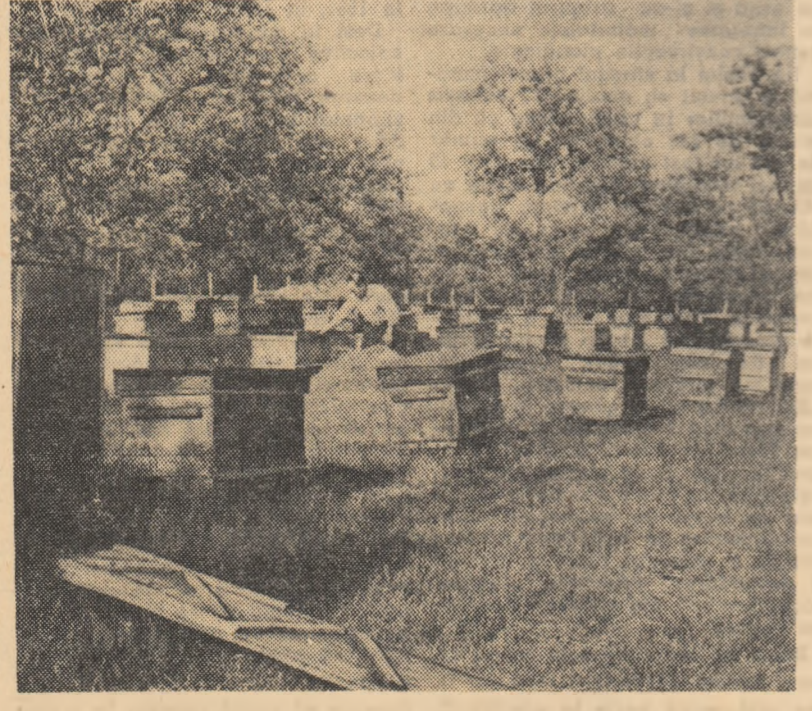
Printre pomii fructiferi din livezile gospodăriei de stat Sercaia, regiunea Brașov, au fost instalați numeroși stupi. În aceste zile, apicultorii îi cercetează cu grijă — așa cum se vede în fotografie — pentru a stabili rodnicia activității roiturilor.

Anul acesta sînt condiții pentru a se obține rezultate cu mult mai bune. La secția Otești, unde am pososit în livezi zilele trecute, la cele 4 brigăzi de aici se executau stropirile împotriva părișii roșii a trupzelor la pruni — și împotriva răpănușii și făinării la meri și peri.