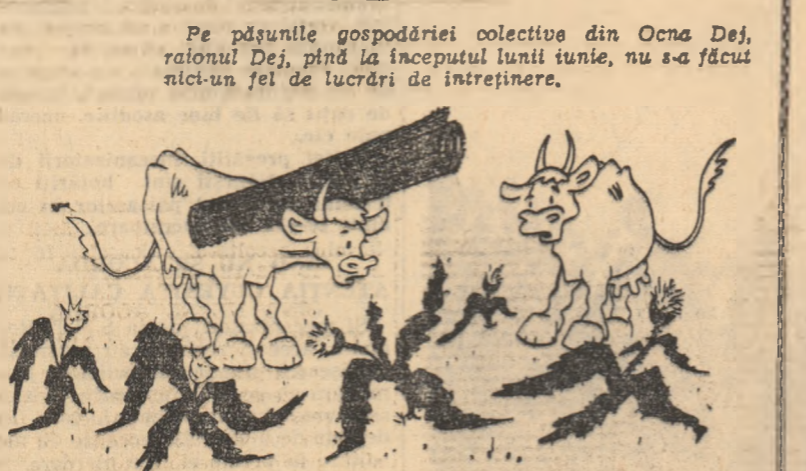
Pe pășunile gospodăriei colective din Ocna Dej, raionul Dej, pînă la începutul lunii iunie, nu s-a făcut nici-un fel de lucrări de întreținere.