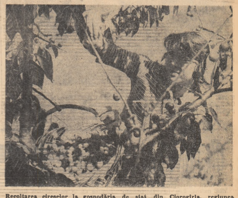
Recoltarea cireșilor la gospodăria de stat din Ciorogirila, regiunea București