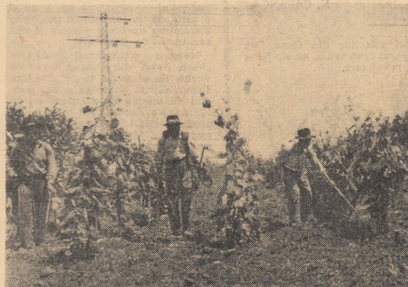
La indicația stației de avertizare a manei, viicultorii din gospodăria agricolă colectivă din Adunații Copăceni, raionul Giurgiu, execută în aceste zile stropitul contra manei.