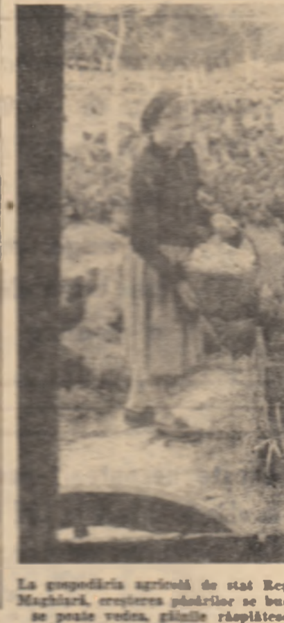
La gospodăria agricolă de stat Reghin din regiunea Mureș Autonomă-Maghărai, creșterea păsărilor se bucură de o mare atenție. După cum se poate vedea, găștile răspîndesc din plin hărnicia îngrijitoarelor.