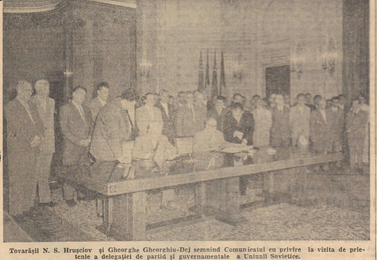
Tovarășii N. S. Hrușciov și Gheorghe Gheorghiu-Dej semînd Comunicatul cu privire la vizita de prietenie a delegației de partid și guvernamentale a Uniunii Sovietice.