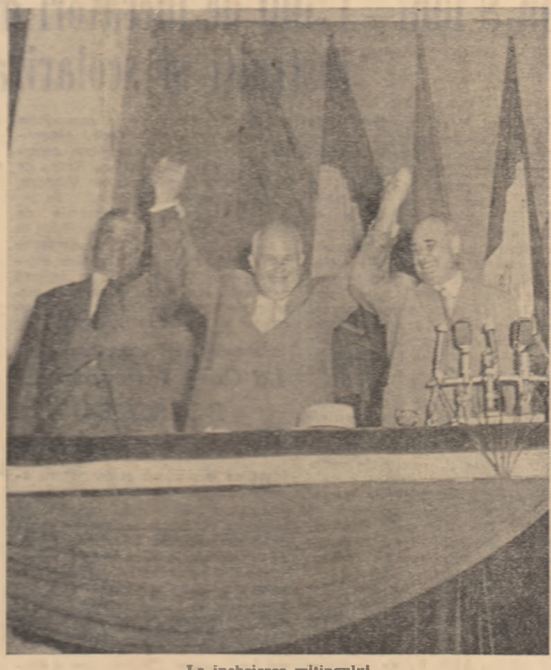
La încheierea mitingului