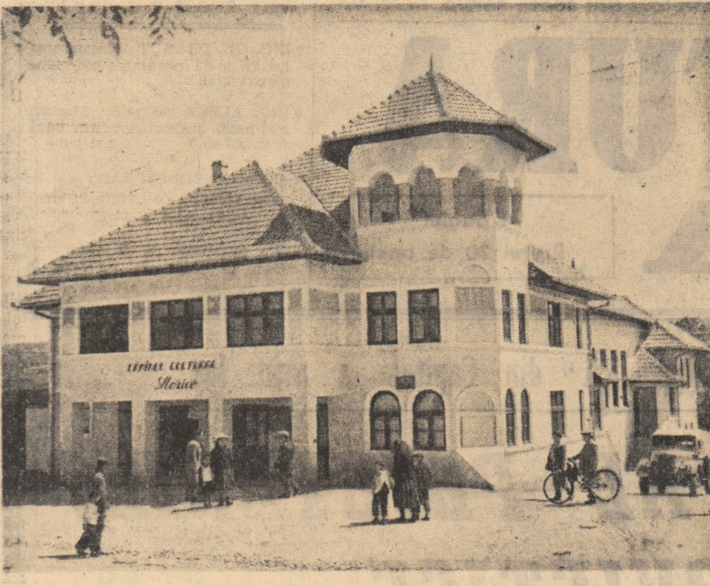
În comuna Roșan, raionul Sebeș, regiunea Hunedoara, a fost dat în folosință un frumos cămin cultural prevăzut cu o sală de cinematograful, bibliotecă, sală de lectură etc.