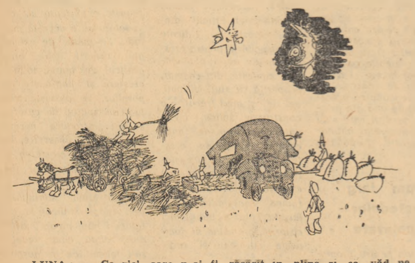
LUNA: — Ce zici, oare n-oi fi răsărit în plina zi, ca vād pe oamenii ăștia tot muncind de zor?! Desen de C. CRĂCIUN

DE VINZARE LA MAGAZINELE COOPERATIVELOR DE CONSUM