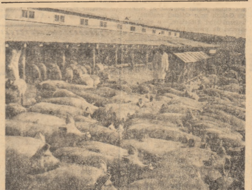
În cadrul sectorului zootehnic, fermele de creștere a porcilor ocupă un loc tot mai important.

Cu multă grijă este crescut tineretul și în celelalte ferme ale gospodăriei noastre. Din proprie experiență noi am văzut că rețineră și îngrijirea corespunzătoare a tineretului de prăsilă constituie principala cale de dezvoltare a creșterii animalelor și călătăm să o folosim cît mai bine.