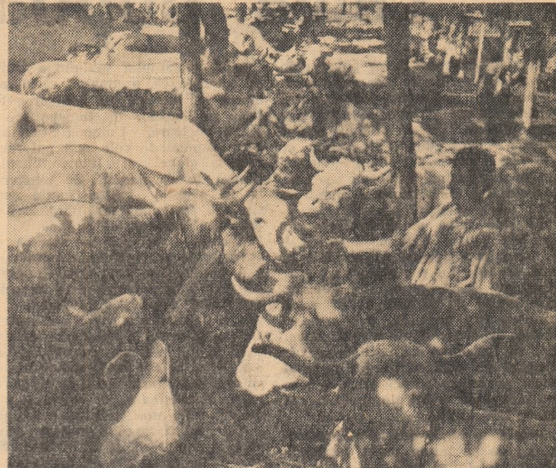
O parte din cîrcada de vaci a gospodăriei colective.

Cu multă grijă este crescut tineretul și în celelalte ferme ale gospodăriei noastre. Din proprie experiență noi am văzut că rețineră și îngrijirea corespunzătoare a tineretului de prăsilă constituie principala cale de dezvoltare a creșterii animalelor și călătăm să o folosim cît mai bine.