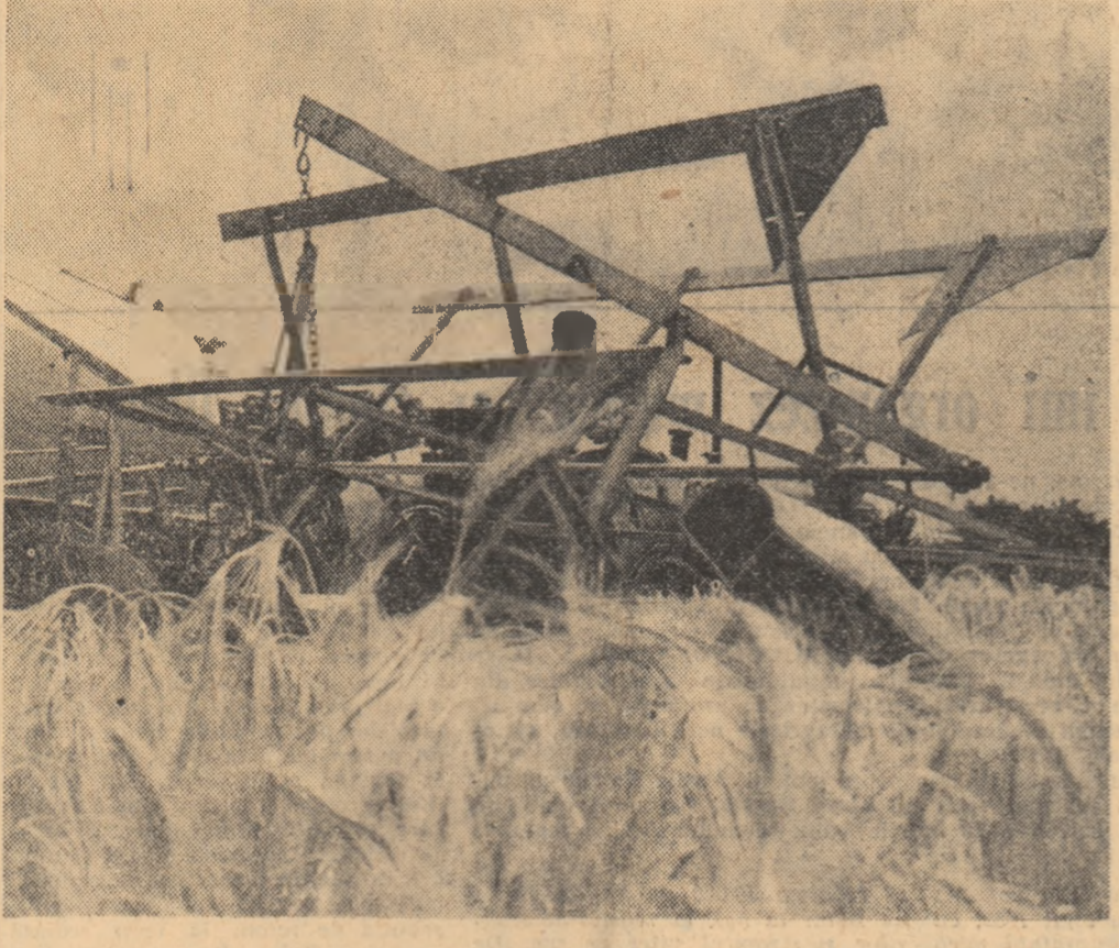
La gospodăria agricolă de stat Oltenița, regiunea București, se recoltează grîul de pe ultimele suprafețe.

cul de plante la ha să fie mai mare decît în condițiile de neirigare, iar solurile folosite să fie din cele mai recunoscutoare la irigații. Gospodăriile care nu au reușit să înșămînțeze un soi corespunzător, să realizeze o densitate optimă și să aplice îngrășăminte suficiente, au obținut — pe terenurile irigate — rezultate mai slabe. Organele de partid și de stat din regiunea noastră au analizat felul în care s-a desfășurat campania de irigații în anul 1961 și au stabilit măsuri concrete pentru a înlătura pe viitor deficiențele care au existat. Astfel, sistemele mari de irigații au fost pregătite mai din timp pentru intrarea în funcțiune, fapt ce a permis ca din 28.900 ha înșămînțate în amenajări, să fie irigate în luna iunie 17.100 ha cu culturi de cîmp. După recoltatul grîului de pe cele 6.300 ha în amenajări și după prima udare pe 5.000 ha de porumb, irigațiile se vor efectua intens pe cele 19.300 ha cultivate cu porumb în incintele îndiguite. Pentru luna iulie, cînd cerințele plantelor pentru apă sînt cele mai mari, s-au mobilizat toate mijloacele pentru continuarea udărilor următoare la porumb și restul culturilor, astfel ca cele 22.700 ha să fie irigate la datele fenologice. Agregatele care au fost folosite la irigații păioase vor fi revizuite, pentru a permite udatul culturilor duble în vederea asigurării furajelor.