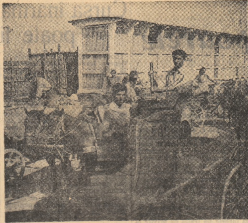
Zilnice la baza de recepție din Budești, regiunea București, se primesc sute de tone de grîu din noua recoltă. În fotografie: colectivitățile, din satul Nana, predînd la basă grîu în contul contractului.