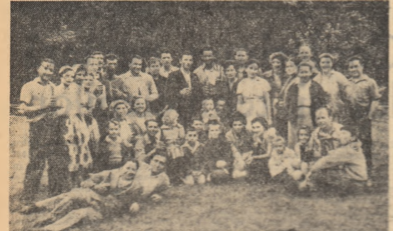
Mecanizatori și familiile lor în excursie la Poiana Neamțului