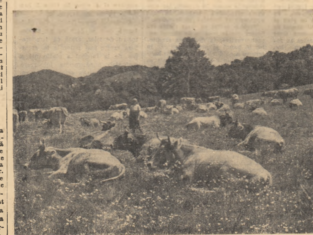
Situată într-o zonă deosebit de favorabilă creșterii vacilor, gospodăria de stat Rîșnov, regiunea Brașov, și-a mărit an de an ferma de taurine. În fotografie: o parte din vacile gospodăriei.