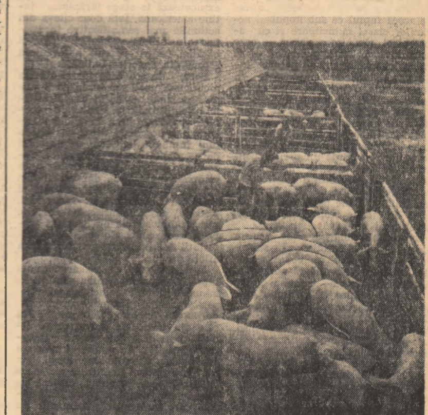
Gospodăria colectivă din comuna Comana, regiunea Dobrogea, a dezvoltat an de an ferma de porci, obținînd din acest sector însemnate venituri bănești. Anul acesta gospodăria vinde statului pe bază de contract 2.300 de porci grași. În fotografie: aspect de la Îngrășătoria de porci.