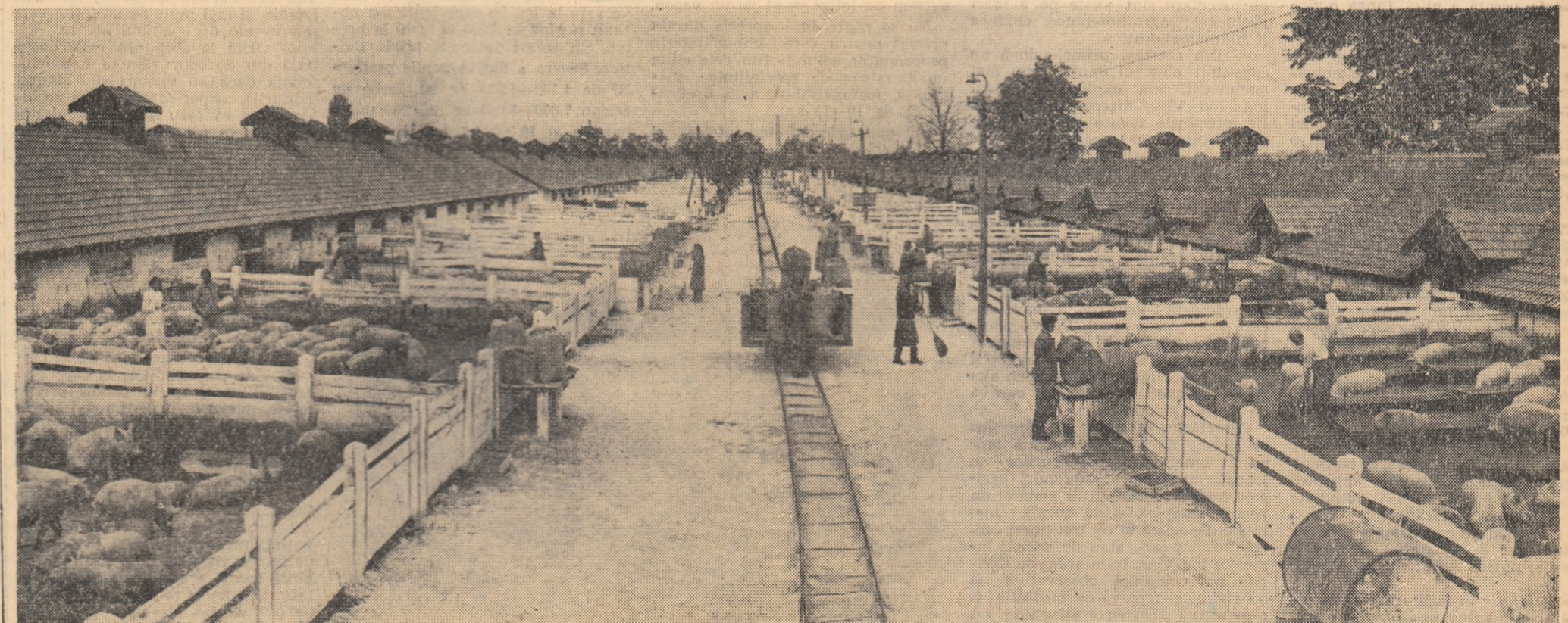
Aspect de la îngrășătorie de porci a gospodăriei de stat Turnu Severin, regiunea Oltenia