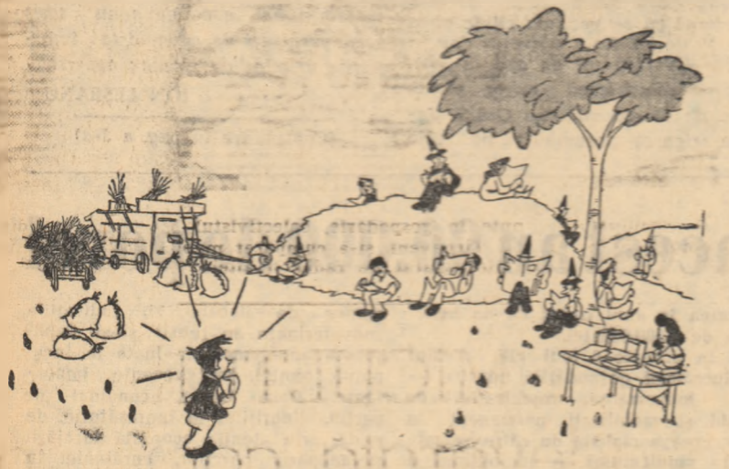
COPILUL: — Unde o fi tătucul meu, mi s-a spus că citește o carte! Desen de C. CRĂCIUN