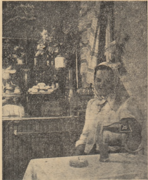
Țărăncă la cofetăria din comuna Nagyréda

Satul și-a schimbat înălțimea. Astfel, s-a construit un cămin cultural modern cu 500 de locuri, unde au loc spectacole de teatru, conferințe