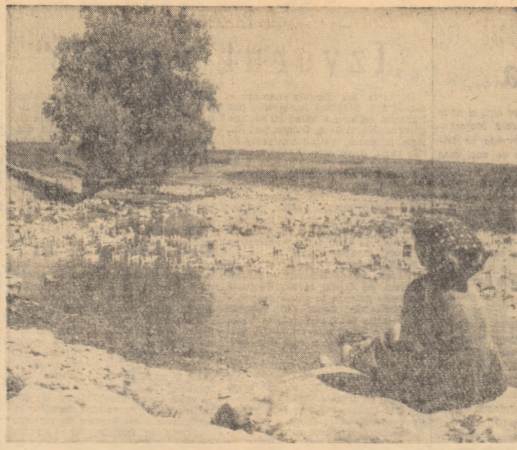
Gospodăria colectivă din comuna 23 August, regiunea Dobrogea, crește în acest an peste 7.500 de păsări din care 3.000 de găște. În fotografie: o parte din cîrdul de găște pe lac