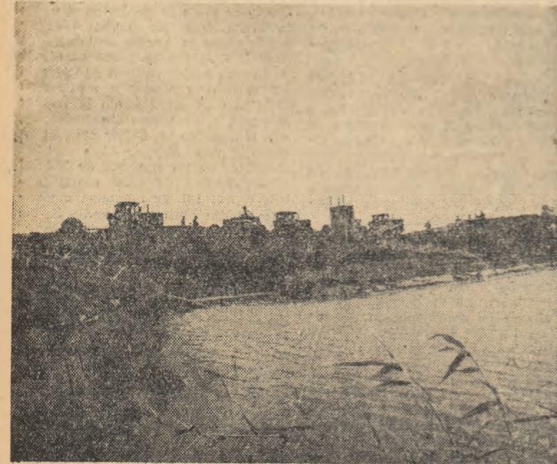
Membrii cooperativei au amenajat un lac artificial de 290.000 m.c. pentru a asigura irigația culturilor.

Bătrânețea — ca și în celelalte cooperative din țară — nu mai este echivalentă cu singurătatea sau cu