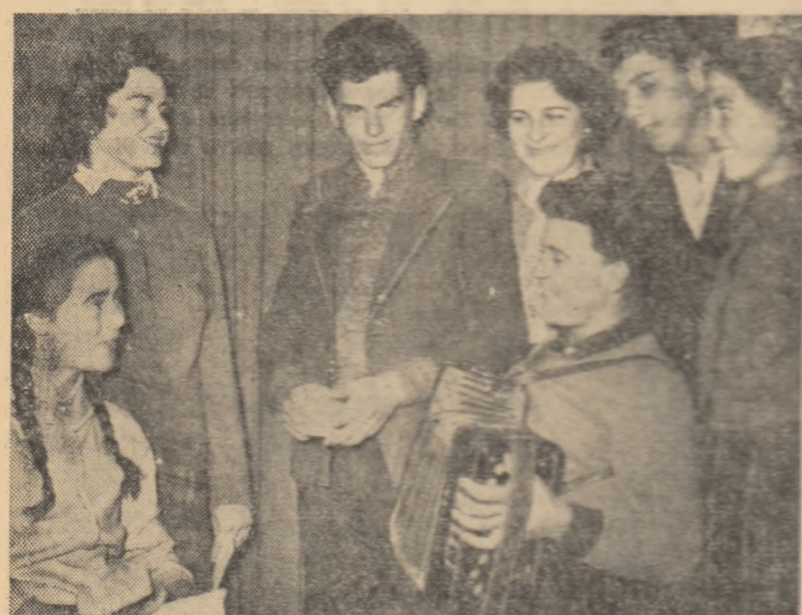
Brigada artistică de agitație a căminului cultural din Pitara, raionul Tîrbuș, este mult apreciată în împrejurimi pentru spectacolele care le prezintă. Iată-o în fotografie prăgînd un nou spectacol

pe țară a țăranilor colectivști, gospodăria colectivă din Hărman a fost decorată cu Ordinul Muncii clasa I. Despre succesele reputeate pînă acum de această gospodărie colectivă, aflăm lucruri multe și interesante în broșura „Fiecare gospodărie colectivă — o unitate puternică, înfloritoare”, recent apărută în Editura Politică. Scrisă de Petre Ghelmeș, broșura prezintă într-un stil viu, atrăgător, experiența colectivștilor din Hărman pentru transformarea gospodăriei colective într-o unitate puternică, înfloritoare. Sînt prezentate astfel rezultatele obținute de-a lungul anilor în sectorul vegetal și în cel al creșterii animalelor. În lucrare se arată cîștigurile realizate de gospodărie, despre viața îmbelsugată a colectivștilor, precum și despre schimbările petrecute în comuna Hărman în ultimii ani. Și cum oamenii făuresc toate acestea, autorul ne prezintă fapte interesante din munca colectivștilor.