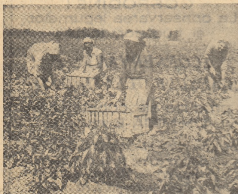
Zilnic de la gospodăria colectivă din Bărcănești pleacă spre piețele orașului Ploiești mil de kg de legume. În fotografie: la recoltatul ardelor