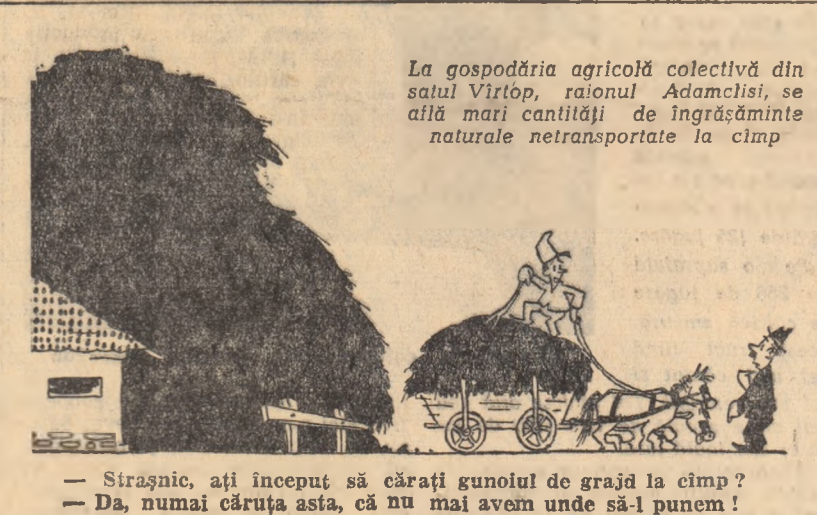
La gospodăria agricolă colectivă din satul Vîrtop, raionul Adamclisi, se află mari cantități de îngrășămîntele naturale netransportate la cîmp

— Strășnic, așit început să cărați gunoii de grajd la cîmp? — Da, numai căruța asta, că nu mai avem unde să-l punem!