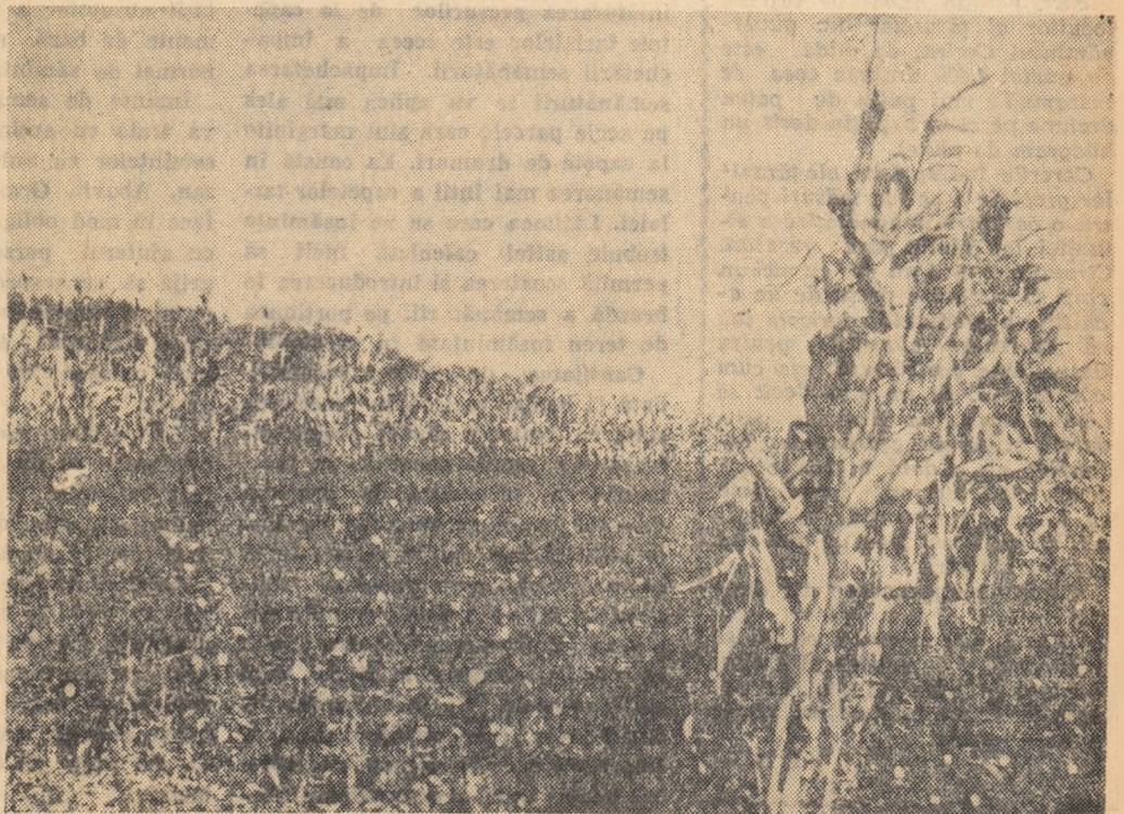
În fotografie: porumb în cultura de roșii