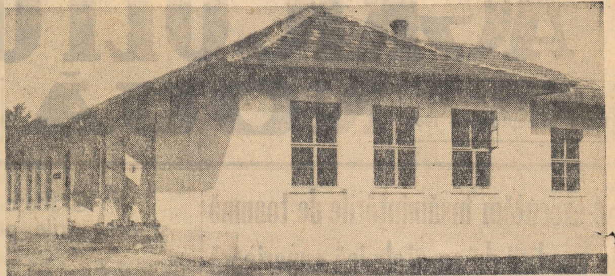
Școala nouă din satul Fundu