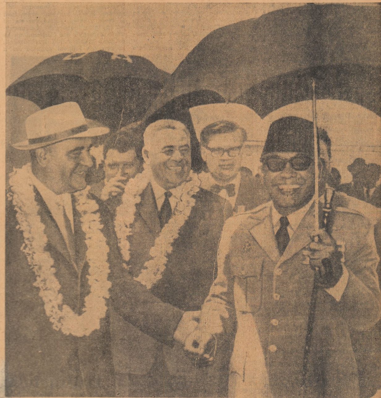
Pe aeroportul Kemajoran din Djakarta, la sosirea solilor poporului român

În dimineața zilei de 2 octombrie tovarășul Gheorghe Gheorghiu-Dej, președintele Consiliului de Stat al Republicii Populare Romîne, împreună cu tovarășul Ion Gheorghe Maurer, președintele Consiliului de Miniștri și Corneliu Mănescu, ministrul afacerilor externe, au adus un omagiu luptei îndelungate a poporului indonezilor pentru libertate și o viață mai bună, depunînd o coroană de flori la cimitirul Eroilor din cartierul Kalibata.