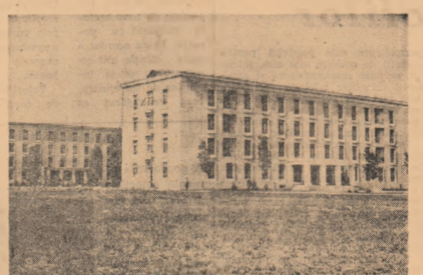
O parte din complexul de cămine pentru studenții Institutului agronomic „N. Bălcescu”.

Luni, 1 octombrie, și-au deschis porțile și cele 5 Institute agronomice din București, Cluj, Iași, Timișoara și Craiova. Mîile de studenți, viitori ingineri agronomi, horticultori, medici veterinari etc., au fost întîmpinați în amfiteatre, laboratoare, cămine cu urarea: „Bine ați venit!”. O adevărată zi de sărbătoare, prilejuită de evenimentul începerii noului an de învățămînt, a fost și la Institutul agronomic „N. Bălcescu” din Capitală. Amfiteatrul Facultății de horticultură și viticultură era nelcăpător pentru cei aproape 2.000 de studenți și cadre didactice, care participau la festivitate.