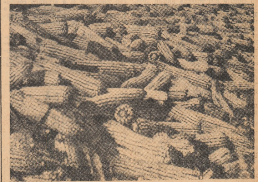
Cu toate condițiile neprielnice din acest an, gospodăria obține în medie la hectar de pe întreaga suprafață cultivată cu porumb, peste 3.300 kg. boabe. Arătura adică, fertilizarea solului, cele 4 prașile mecanice și 4 manuale, sămința de soi și-au spus cuvântul.

De bună seamă că paralel cu creșterea efectivelor s-a dus o muncă susținută și pentru sporirea producției animale. Îndrumați în permanență de organizația de partid, de consiliul de conducere și cadrele tehnice, colectivitățile care lucrează în sectorul zootehnic al gospodăriei — la ora actuală muncesc în acest