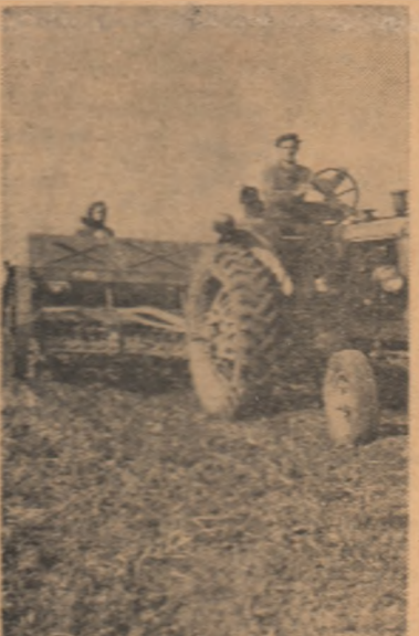
Însămînțatul grîului pe ogoarele gospodăriei colective din Dragodana, raionul Găești, regiunea Argeș