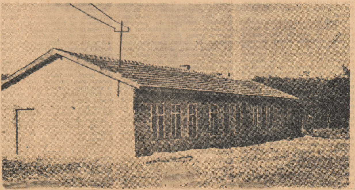
Asemenea construcții, nouă la număr, destinate creșterii păsărilor a ridicat gospodăria în acești ani.

Făcându-și calculele la început de an, colectivitățile din Pecineaga și-au plănuit să obțină din creșterea păsărilor 142.000 de lei. Se vede treaba însă că ei au fost foarte modesti în aprecierea posibilităților de care dispune acest sector, de vreme ce prevederile lor s-au dovedit depășite. Căci, așa după cum arată scrierile contabile, până la sfârșitul lunii septembrie gospodăria a realizat din sectorul avicol venituri bănești în sumă de 149.823 de lei. Acești bani au fost obținuți din vânzarea către unitățile comerciale achizițoare și pe piață a 8.330 de păsări și peste 100.000 de ouă. Până la sfârșitul anului, gospodăria va mai valorifica alte circa 5.000 de păsări și un însemnat număr de ouă. Venitul bănesc pe care-l va aduce sectorul creșterii păsărilor pe întregul an va trece cu mult peste 200.000 de lei. Așa stînd lucrurile, acestea fiind rezultatele, nu e de mirare că membrii gospodăriei au hotărât, încă de acum, ce în anul viitor, pe lângă cele 10.000 de păsări-matăc pe care le vor reține anul acesta, să mai crească alte 25.000 de capete. Se poate spune deci cu toată tăria că la colectiva din Pecineaga creșterea păsărilor este un sector în plină afirmare.