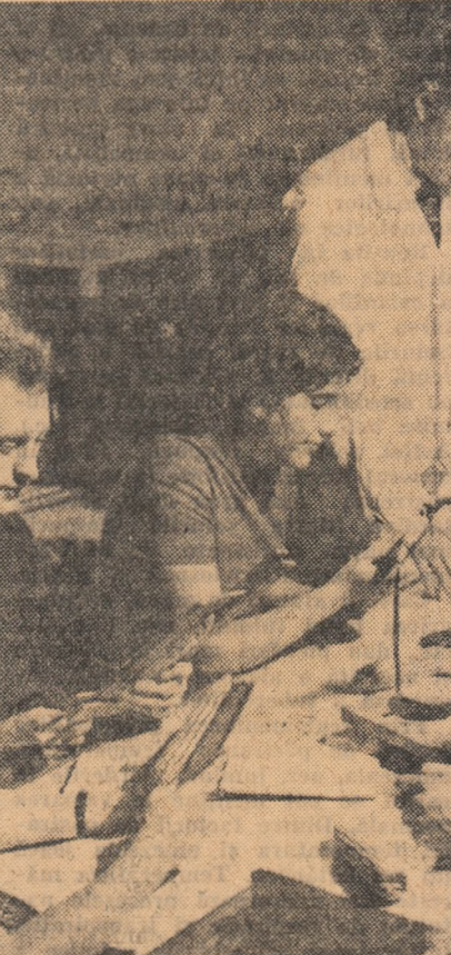
Studenți din anul IV al Facultății de agricultură la o oră de laborator.