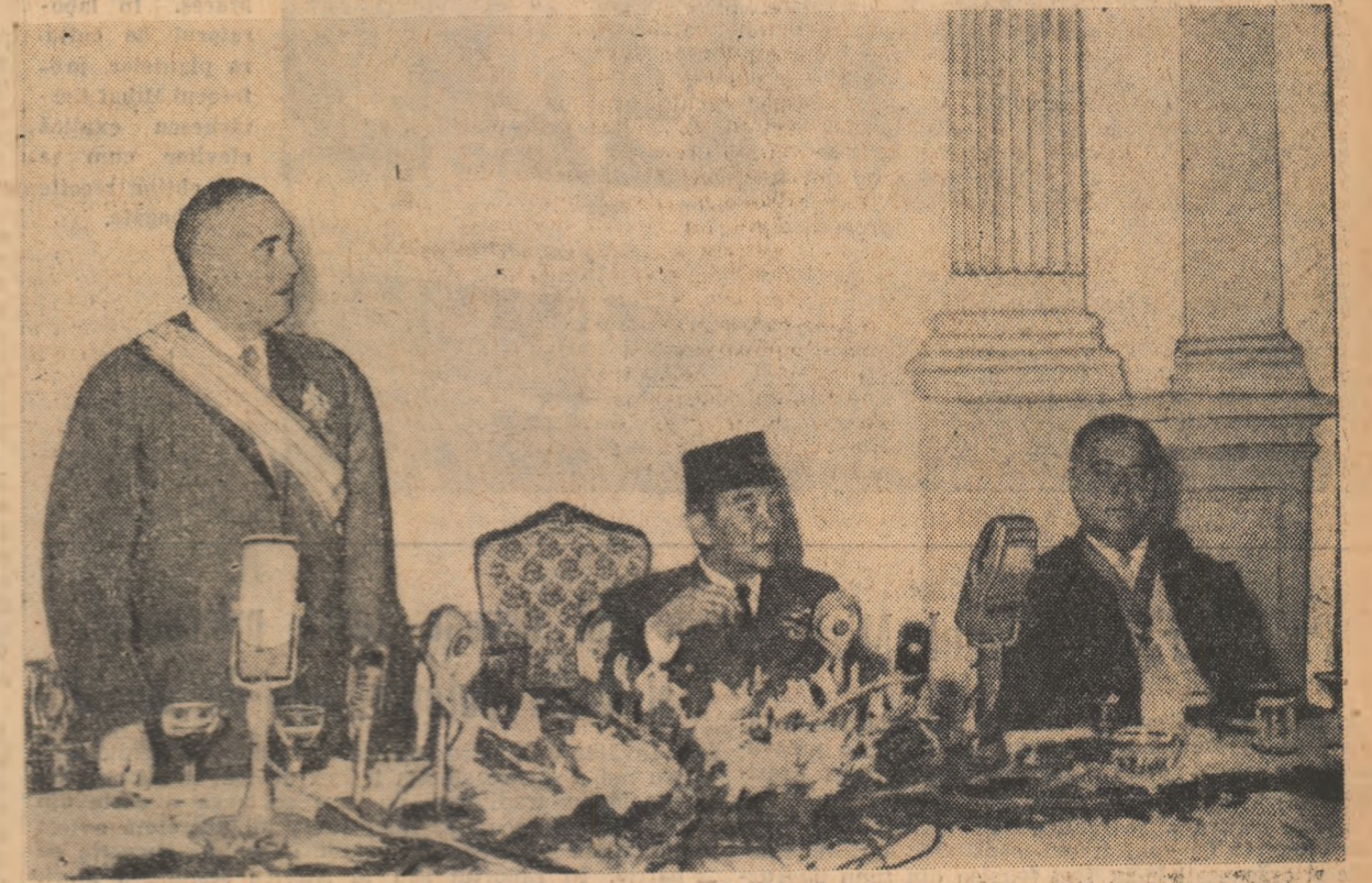
După cum se știe, cu prilejul vizitei în Indonezia, președintele Sukarno a conferit tovarășului Gheorghe Gheorghiu-Dej cel mai înalt ordin indonezian: „Steaua Republicii Indonezia, clasa I”, tovarășului Ion Gheorghe Maurer, „Steaua Republicii Indonezia, clasa a II-a” iar tovarășului Corneliu Mănescu același ordin clasa a III-a. Președintele Sukarno a oferit apoi în cinstea tovarășului Gheorghe Gheorghiu-Dej și banchet la palatul Merdeka. La banchet au rostit toasturi președintele Sukarno și tovarășii Gheorghe Gheorghiu-Dej. În clișeu: tovarășii Gheorghe Gheorghiu-Dej, Rostindu-și toastul.

Continuîndu-și vizita în Republica Indonezia solii poporului nostru au participat la festivitățile consacrate aniversării armatei indoneziane, care au avut loc pe un platon din apropierea marelui complex sportiv din Djakarta. Cu 17 ani în urmă, la 5 octombrie 1945, au fost constituite primele unități ale armatei naționale indoneziane.