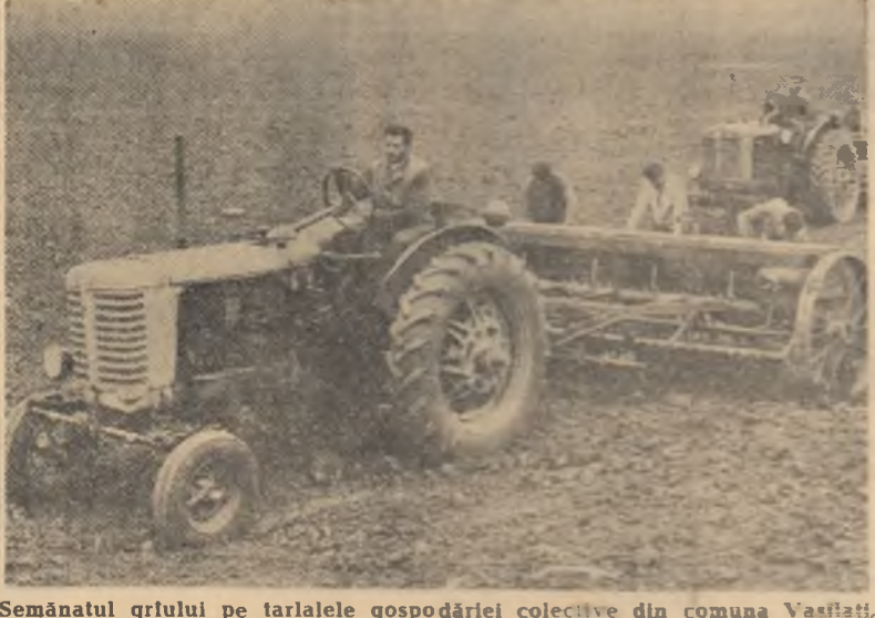
Semănatul grîului pe tarile gospodăriei colective din comuna Vaslați, raionul Oltenița, regiunea București, se apropie de sfîrșit.

Brigăzile noastre, care își are țara la trupul numit Văleni-Ilișii, l-a revenit sarcina să cultive în acest an cu porumb pentru boabe o suprafață de 100 ha. La îndemnul organizației de partid, noi am analizat posibilitățile ce le avem pentru sporirea producției la hectar și am ajuns la convingerea că avem mari rezerve, în acest scop. Astfel, ne-am angajat atunci să depășim producția medie planificată de 2.400 de kg boabe la ha cu 1.000 de kg. la hectar. Pentru aceasta, încă din toamnă trecută am dat o mai mare atenție executării unor lucrări de calitate, de care depinde obținerea unor producții bogate. Pe întreaga suprafață destinată porumbului am executat astfel ogoare de toamnă la adîncime de 30 cm. Concomitent, am încorporat sub brazdă cîte 300 kg. superfosfat la hectar ca îngrășămint de bază. De asemenea, imediat ce au apărut primele semne de desprîmăvărare, am mai administrat și cîte 100 kg azotat de amoniu la hectar, după care întreaga suprafață de teren a fost grăpăită. Această lucrare a avut menirea să încorporeze azotul de amoniu în sol și să împiedice evaporarea apei din sol. Pînă la semănat, terenul a mai fost întreținut prin încă două cultivații, executate la intervale de 8-10 zile. Învățînd din experiența anilor trecuți membrii brigăzilor noastre au acordat o deosebită atenție calității semințelor. Această lucrare s-a executat în ultimele zile ale lunii aprilie, cînd temperatura în sol era,