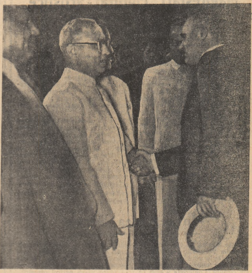
La sosit, pe aeroportul din Bombay