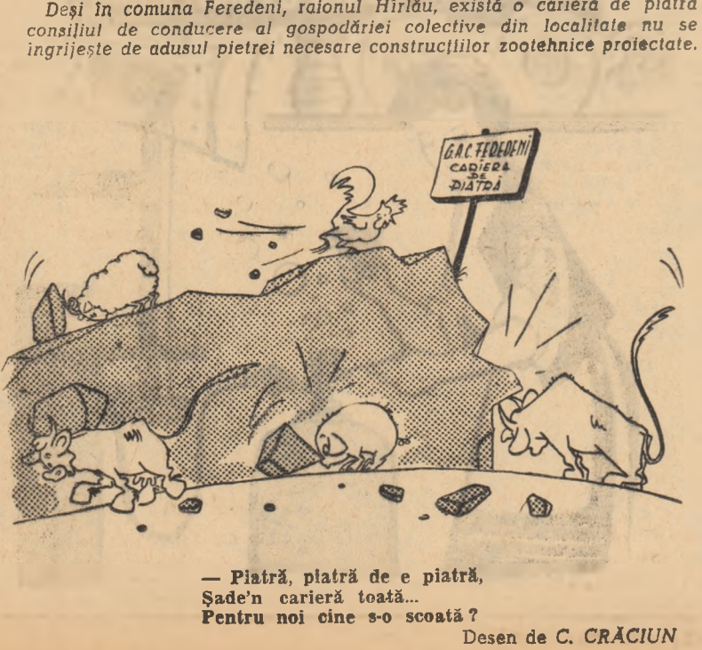
— Piatră, piatră de e piatră, Sade'n carieră totă... Pentru noi cine s-o scoată? Desen de C. CRĂCIUN

hectare din brigada condusă de Matei Stelian, s-a obținut în medie 7.500 kg ștuleți la hectar iar pe restul între 4.000-5.000 kg ștuleți la hectar. Producția obținută la secția Gherghița a confirmat încă o dată faptul că acolo unde se aplică riguroso agrotehnica, rezultatele nu înlăzesc să se arate. VERONEL PORUMBOIU corespondent