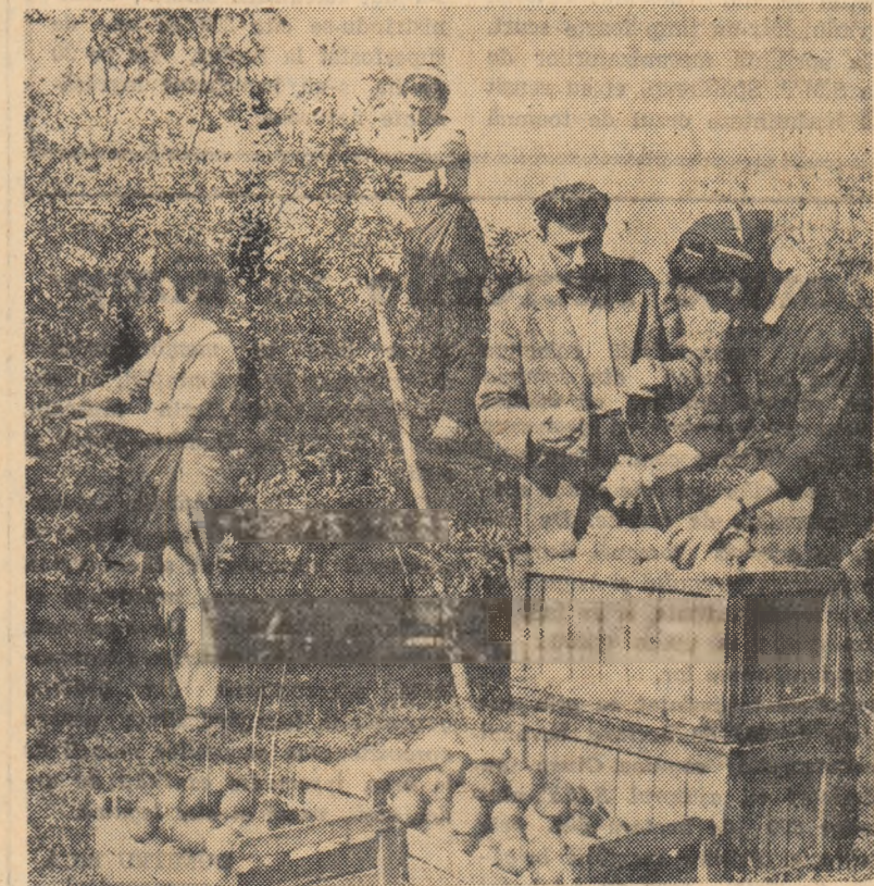
În construcții moderne și condiții optime, peste 240 elevi, filii de colectiviști din regiunea Ploiești, sînt pregătiți de cadre didactice de specialitate pentru a deveni buni tehnicieni. Viitorii tehnicieni horticultori au la dispoziție săli de clasă, laboratoare moderne, club, teren de sport etc. În fotografie: în orele de practică elevii anulului III recoltînd mere, în livada centrului școlar agricol din Tirgșoru Nou.