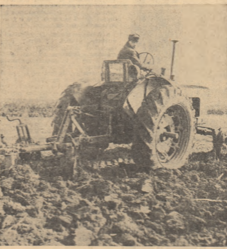
Arături adânc pe ogoarele gospodăriei colective din Rominești, regiunea Ploiești.