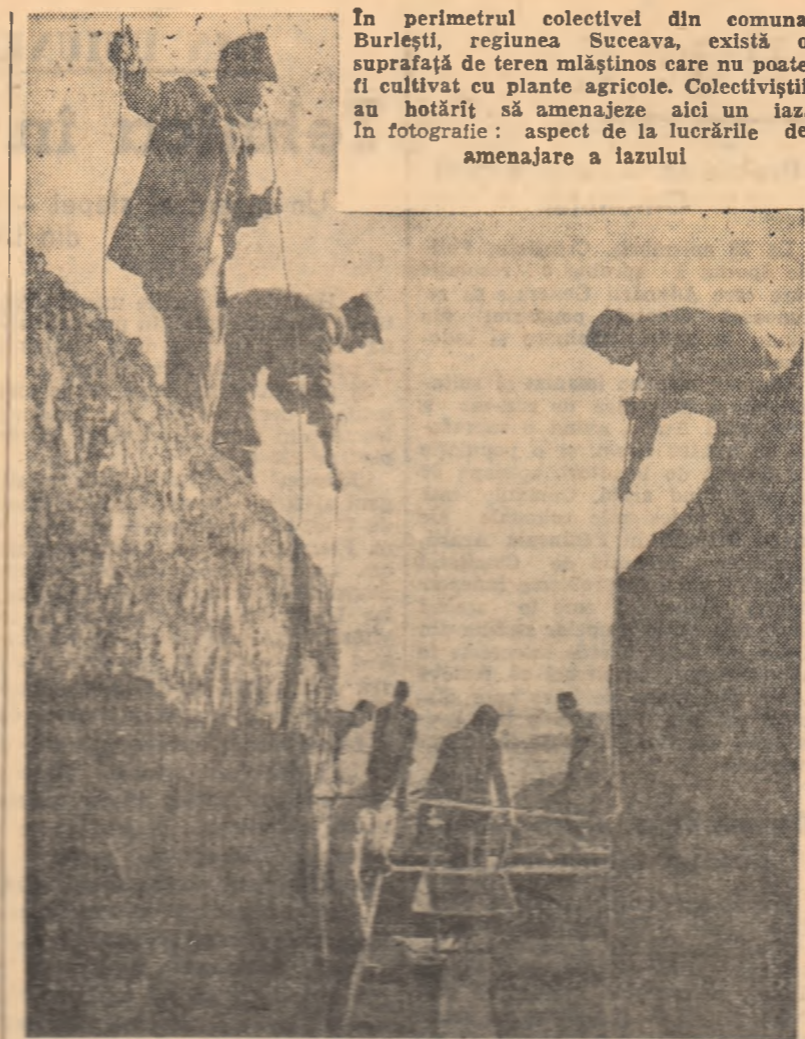
In perimetrul colectivității din comuna Burlești, regiunea Stuceava, există o suprafață de teren măștinșos care nu poate fi cultivată cu plante agricole. Colectivității au hotărât să amenajeze aici un laz. În fotografie: aspect de la lucrările de amenajare a lazului

De asemenea, fiecare inginer din gospodăriea colectivă a mai organizat o dată un lot de 10 ha, cu sârca de a produce cel puțin 1.000 kg grâu boabe la hectar. Pentru aceste suprafețe, au fost alese cele mai bune promergeri, a fost fertilizat solul, s-au aplicat lucrări de cea mai bună calitate și s-a însămînțat, în majoritate, soiul de mare productivitate Benzostala. Aceste loturi au fost create cu scopul de a demonstra maselor de colectivități în condițiile fiecărei gospodării agricole colective se pot obține producții