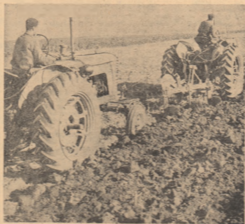
Arături adînc pe ultimele suprafețe la gospodăria colectivă din Vinărești, regiunea Iași.