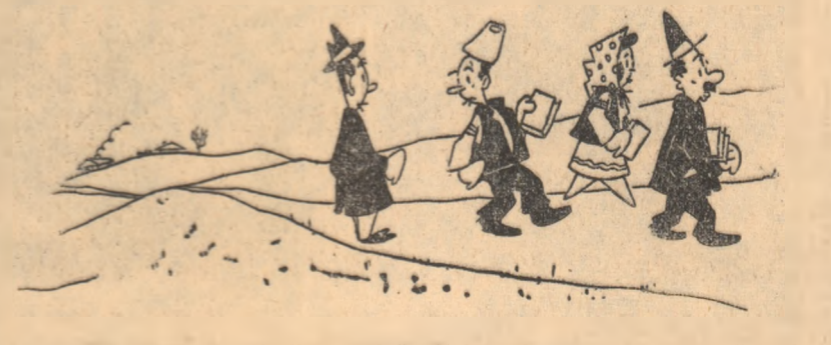
— Ne ducem la colectiva vecină, că lectorii noștri au uitat să mai deschidă cursurile!

La gospodăria agricolă colectivă din comuna Grumezoia, raionul Huși, la data de 25 noiembrie a.c., nu începuseră cursurile agrozootehnice.