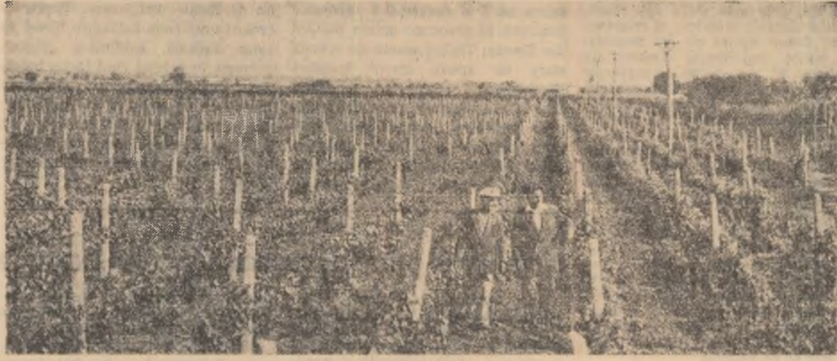
Vedere din via gospodăriei