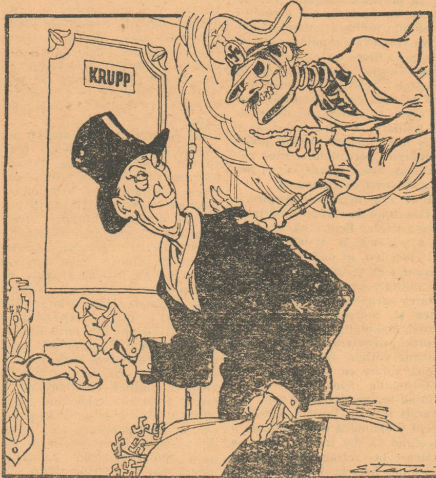
HITLER: Du-te Konrad! Asta te va ajuta să ajungi departe... ca mine.

Adenauer, urmînd exemplul predecesorului său, a făcut o vizită magnatului industriei de război vest-germane, Krupp.