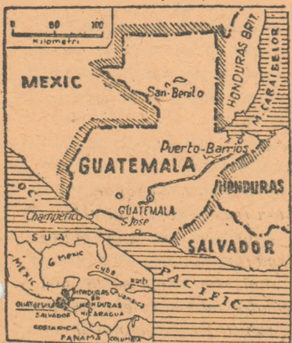
Suprafața țării este de 110.000 km. pătrați, fiind populată de

Poporul guatemalez se ridică hotărît împotriva uneltirilor dușmănoase puse la cale de unele cercuri conducătoare din S.U.A. Lupta poporului guatemalez este sprijinită de opinia publică din țările Americii latine. Astfel, chiar și camera deputaților din Chile a cerut președintelui republicii să dea instrucțiuni delegației chiliene la conferința inter-americană care își ține lucrările la Caracas (Venezuela) să se împotrivescă cu hotărîre oricărui agresiuni îndreptată împotriva Guatemalei. Împotriva comploturilor imperialiștilor străini, poporul guatemalez sprijinit de cercuri largi ale opiniei publice este hotărît să lupte cu îndrăjire pentru apărarea independenței sale naționale.