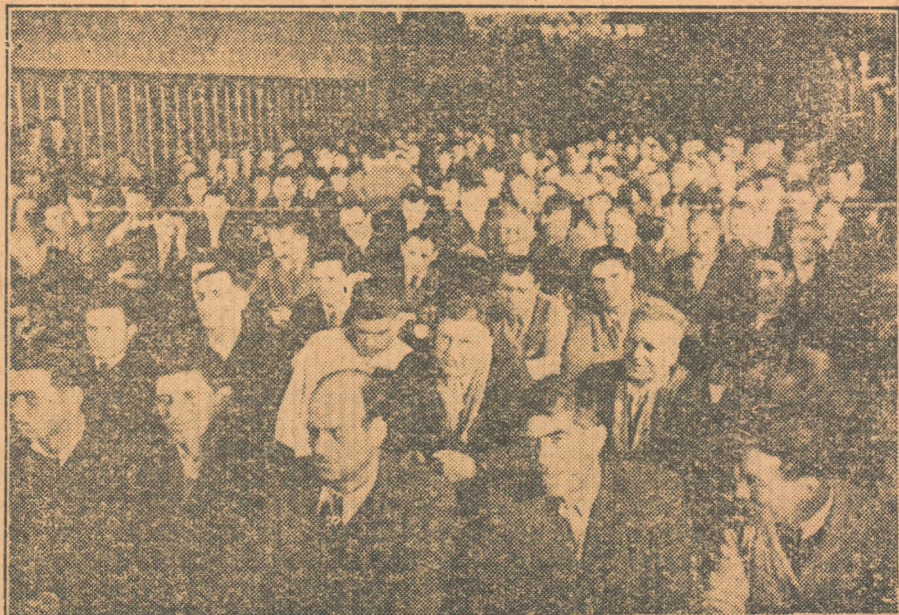
Aspect din timpul consfătuirii pe țară cu fruntași în cultura porumbului, cartofului și sfeclei de zahăr.