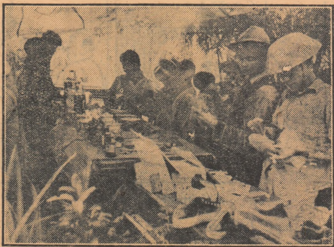
Fotografia înfățișează un grup de țărani vietnamezi cumpărînd mărfuri de la un magazin ambulant.