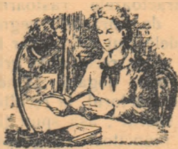
Ion Vitner :

Citind cartea lui Boris Polevoi, nu vei putea uita niciodată pe „Taica”, președintele de colhoz, pe făuritorii Mării Tîmleanskaia și nici pe constructorii Canalului Volga-Don. Cu ei pleci în gînd, cu ei te sfătuești, ei îți sînt adevărații prieteni