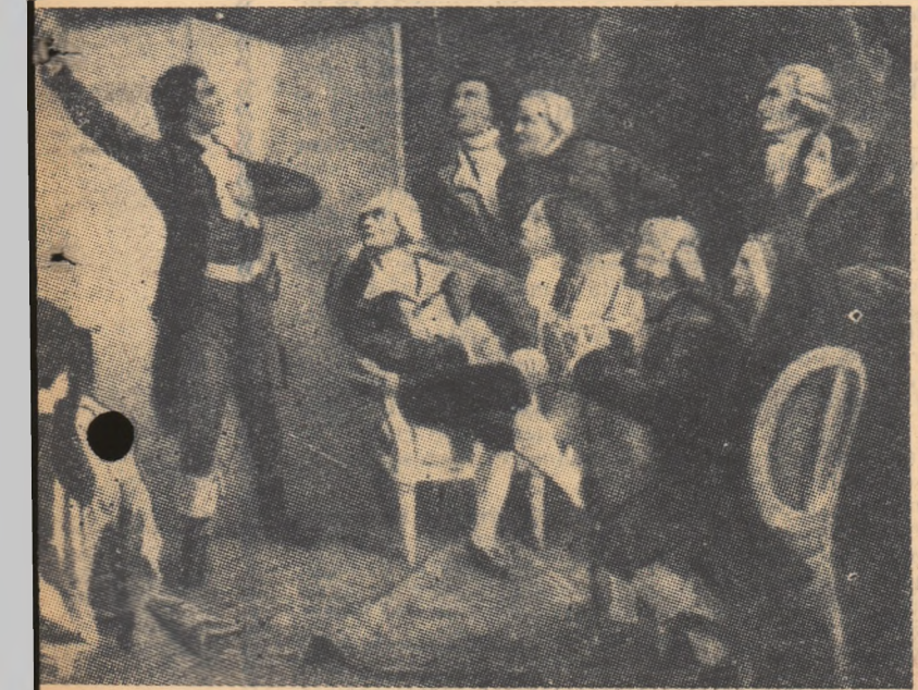
Rouget de l'Isle compunînd Marsilieza