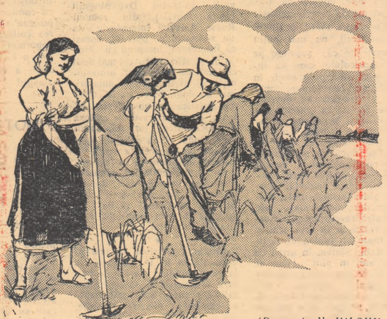
(Desen de N. HILOHI)

se face în același timp. Aici muncesc cu toții împreună, organizați în cete. Culturile prașitoare le împart în loturi separate pentru fiecare familie. În lunca Visei aveau cel mai bun pămînt din hotarul satului, o tarla mică, de vreo șapte hectare. Oamenii au cerut ca această tarla să fie împărțită separat pentru grădini individuale. Așa au și făcut. Curînd după aceea, în vremea prașilei, președintele și-a dat seama că n-au făcut bine cînd au împărțit lunca în 60 de bucățele. Luați cu treburile, mulți lăsau în părăsire aceste bucățele, ori le lucrau