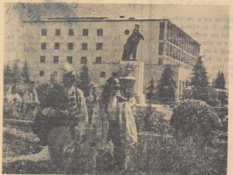
Într-unul din parcurile Tiranei, tineri de prin satele din împrejurimi vin să-și petreacă zilele de sărbătoare.