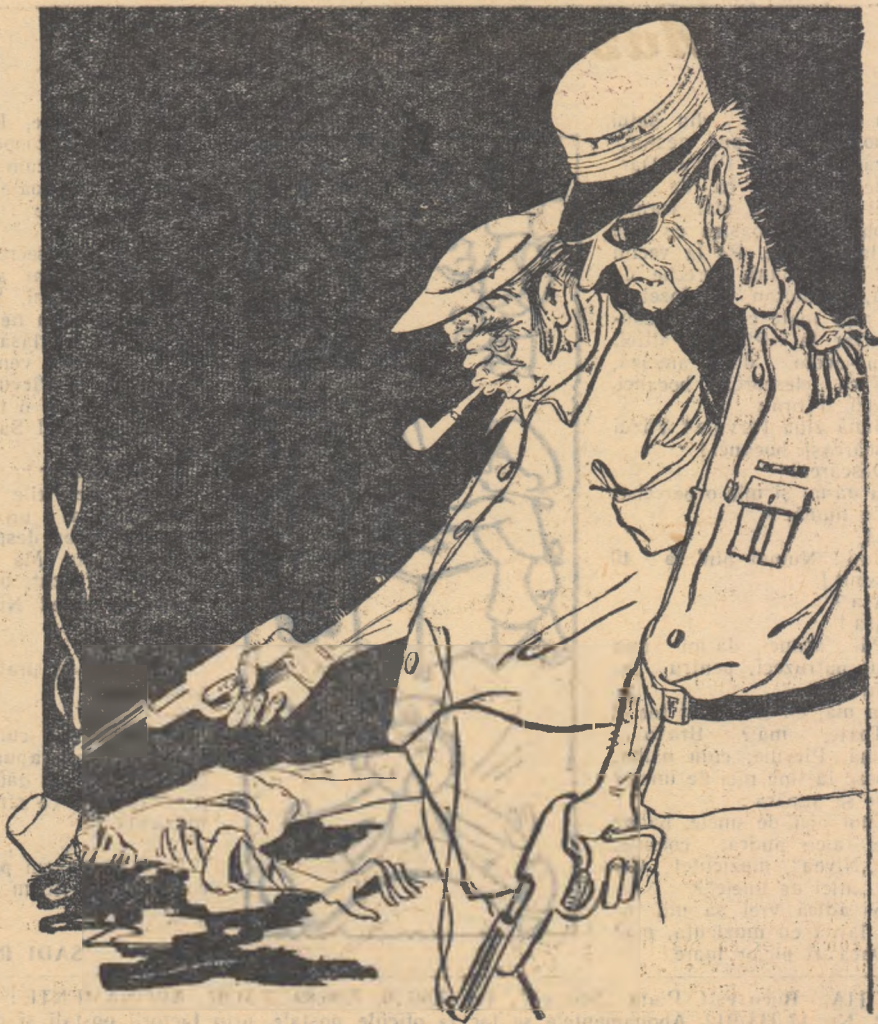
— Trebuie să fim precauți. Să nu ne scape nici unul! (Desen de N. CLAUDIU)

Deși trupele anglo-franceze pretind că ocuparea Port-Saidului s-a făcut cu „precauție”, ele nu pot ascunde ororile săvîrșite. (Ziarele).