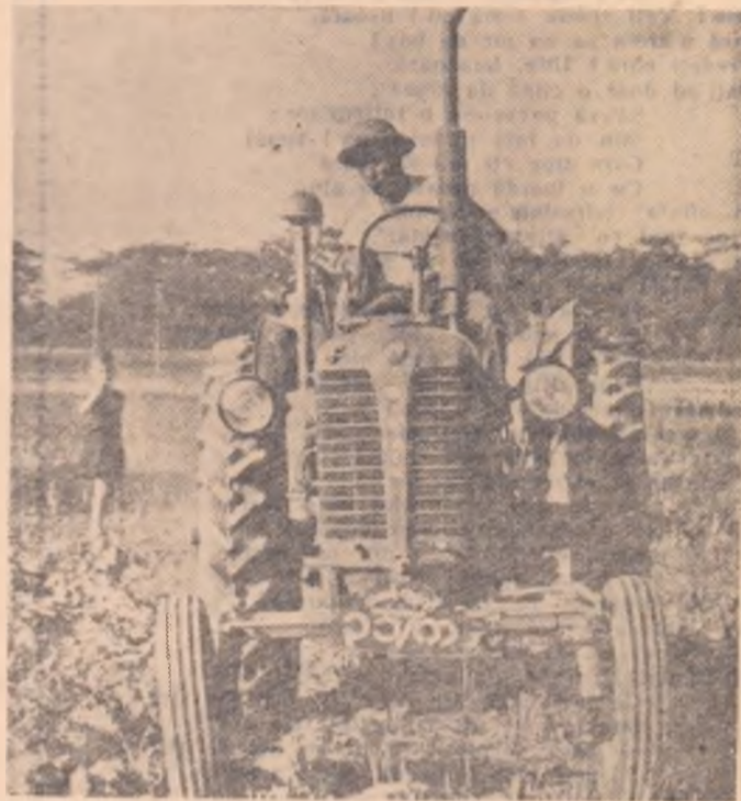
Tractor de fabricație cehoslovacă arînd pe ogoarele țărănilor birmani

fiecare succes obținut de poporul birman. Între țările noastre s-au statornicit relații de prietenie, s-a făcut schimb de reprezentanțe diplomatice. De curind țara noastră a fost vizitată de o delegație parlamentară birmană, în frunte cu U Kyaw Nyein vicepreședinte al Consiliului de Miniștri al Birmaniei. Vizita înalților oaspeți birmani a contribuit la o mai bună cunoaștere și apropiere între popoarele noastre.