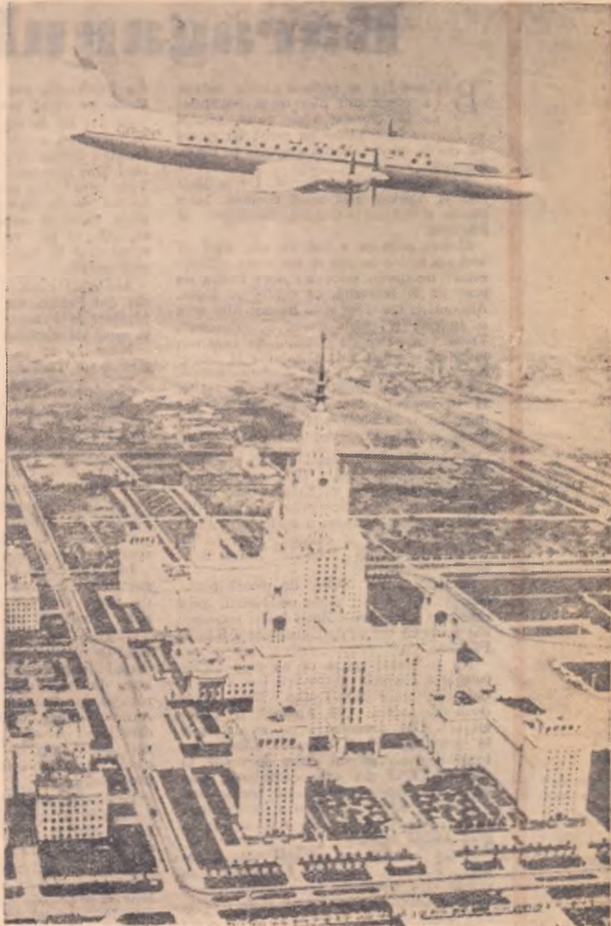
MOSCOVA — capitala Uniunii Sovietice. Orașul păcii și al culturii înaltate spre care se îndreaptă privirile pline de admirație ale milioaneilor de oameni ai muncii de pe întregul globpămîntesc.

În fotografie: clădirea centrală a Universității de Stat „Lomonosov”, situată pe colinele lui Lenin.