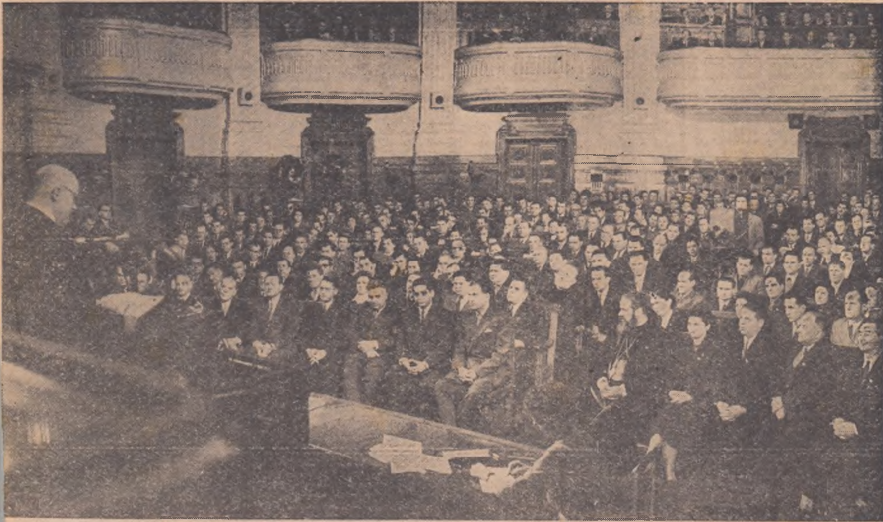
Tovarășul Chivu Stoica, președintele Consiliului de Miniștri, membru al Biroului Politic al C.C. al P.M.R., rostindu-și expunerea în ședința festivă a Marii Adunări Naționale, cu prilejul celei de-a 10-a aniversări a Republicii.