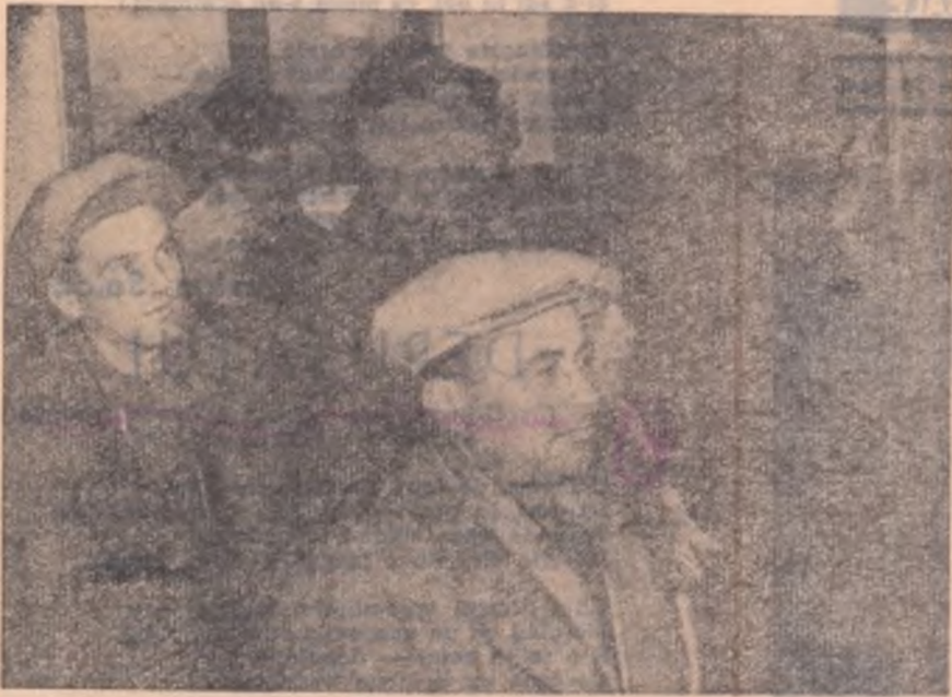
Cetățenii din comuna Răcari, regiunea București, consultând listele de alegători