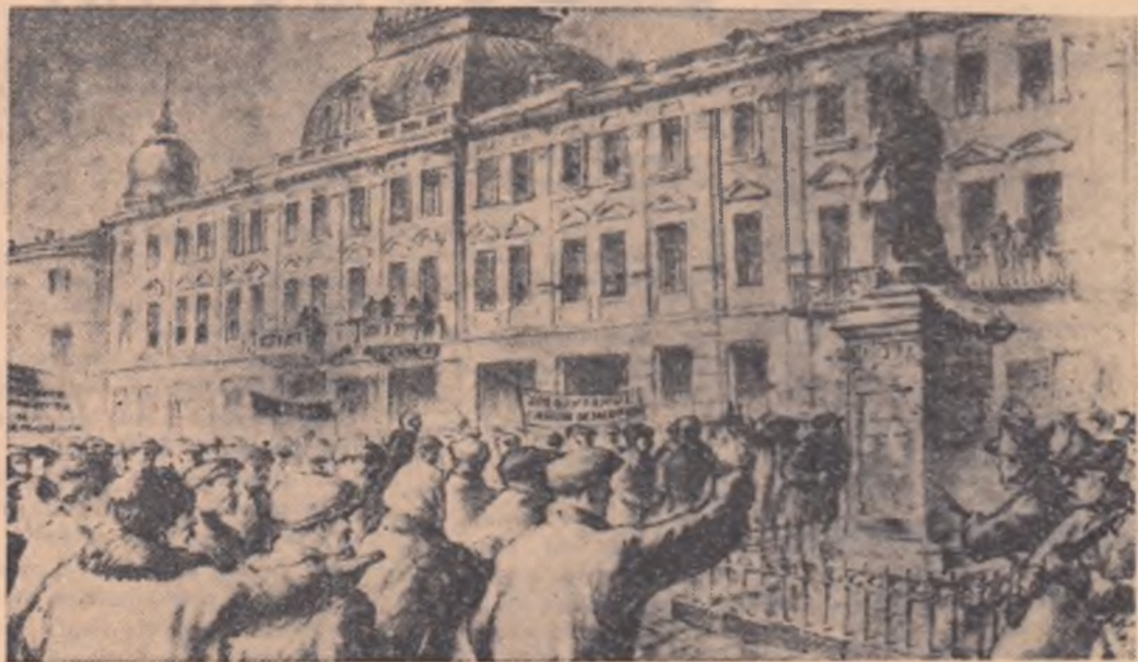
Aspect din zilele lui februarie 1933. Demonstrația de protest a muncitorilor petroliști din Ploești pentru eliberarea delegaților areștați. (Desen apărut în presa vremii)

De chiot mașina e plină, De risul atîtor copii. — „Or ți-e de mirare, vecină?” — „Vecine, copil să tot fii!”