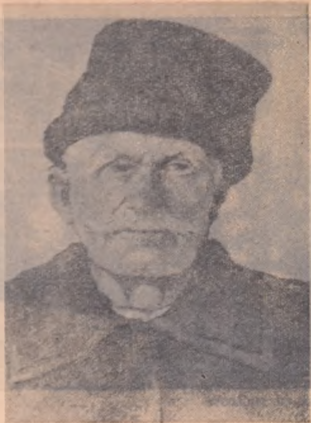
AUREL BUTNARU „Portret de colectivist“ (pictură)