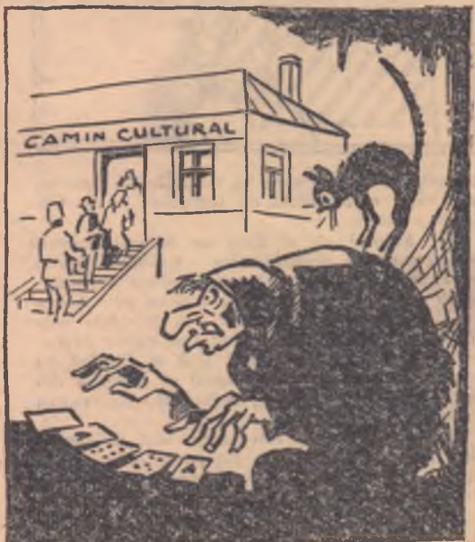
VRAJITOAREA: — De la o vreme, cade mereu cu bucurie... în casa altora!