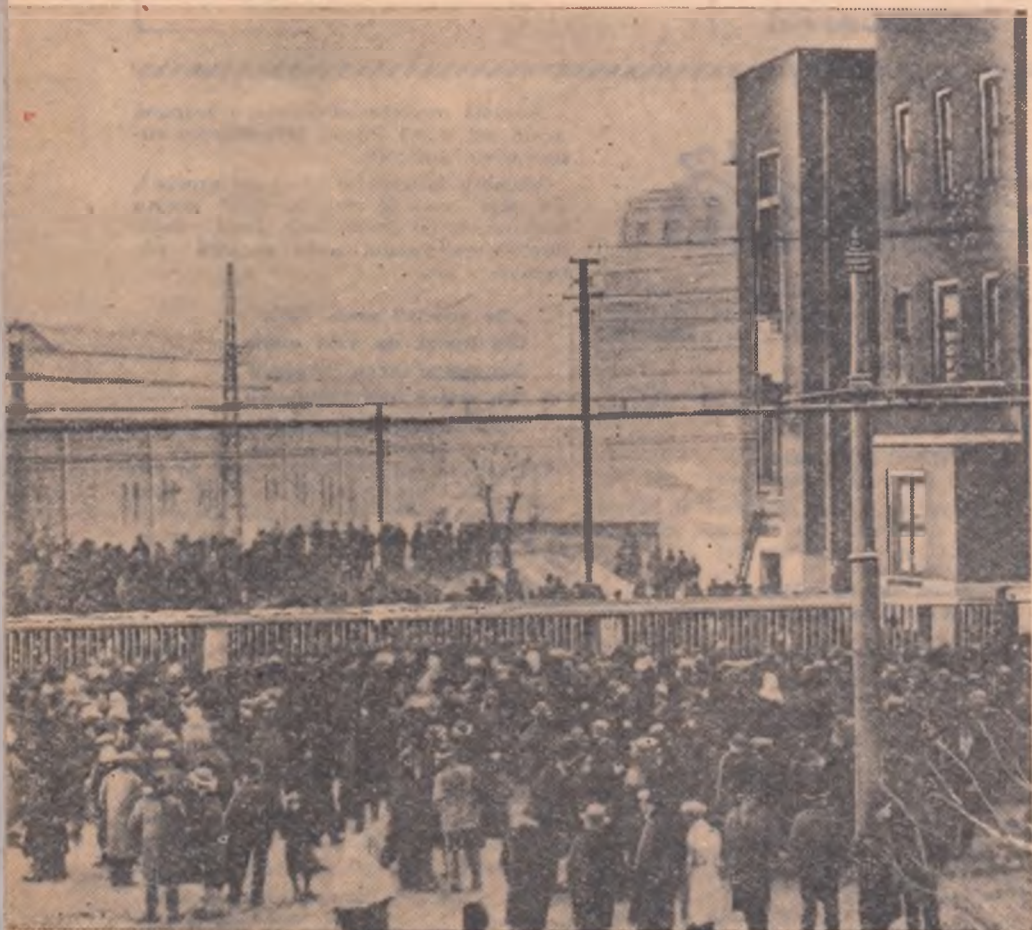
februarie 1933. — Răspunzînd chemării partidului, mii de muncitori din Capitală au venit în atelierelor „Grivița” spre a-și manifesta solidaritatea cu lupta ceferiștilor.