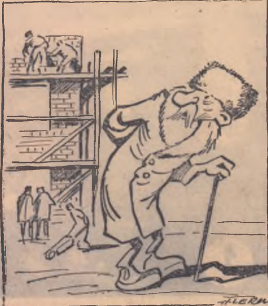
FOSTUL DEPUTAT BURGHEZ: — Ce fel de deputați mai sînt și ăștia, dacă-și țîn promisiunile?