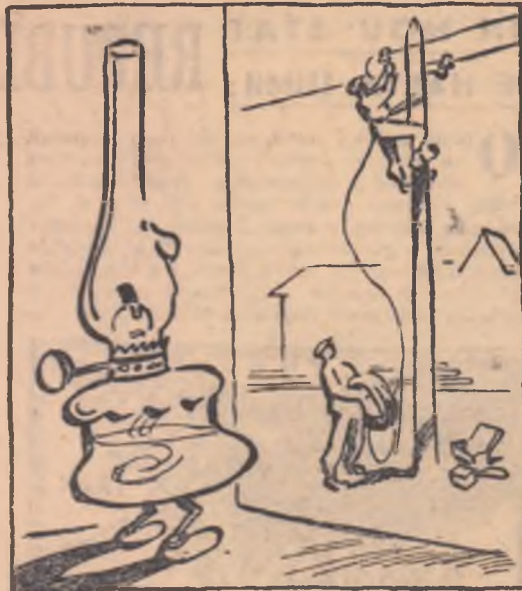
LAMPA: — Și din satul ăsta trebuie să-mi iau tăl-pășița!