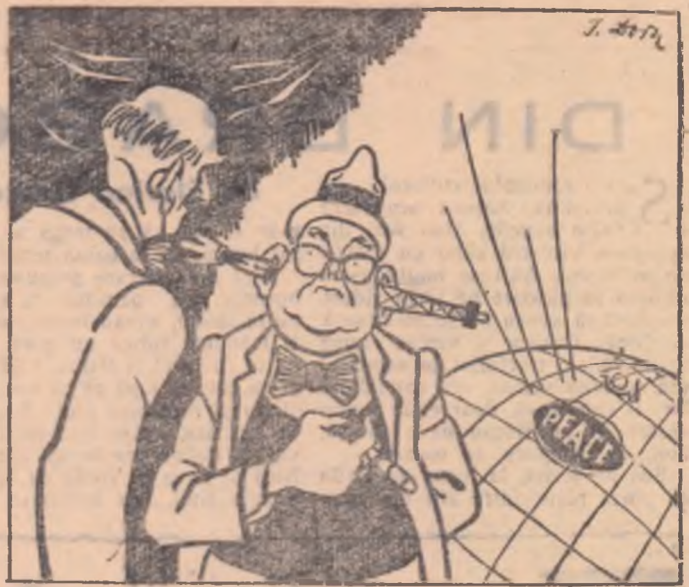
— Auziți, mister Dulles? Lumea toată strigă pace! — Serios? Eu n-aud nimic...