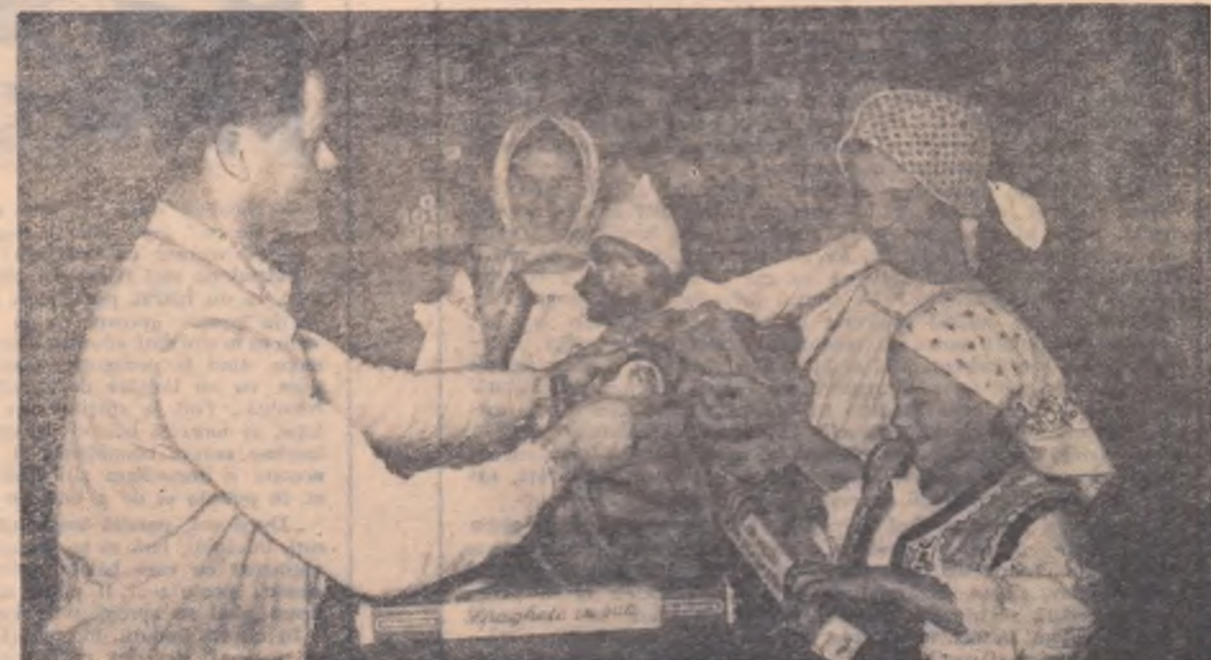
La magazinele cooperative de consum din comuna Borșa, raionul Gherla, sătenii găsesc, pe lângă diverse articole de îmbrăcăminte și încălțăminte, și un bogat sortiment de produse alimentare.