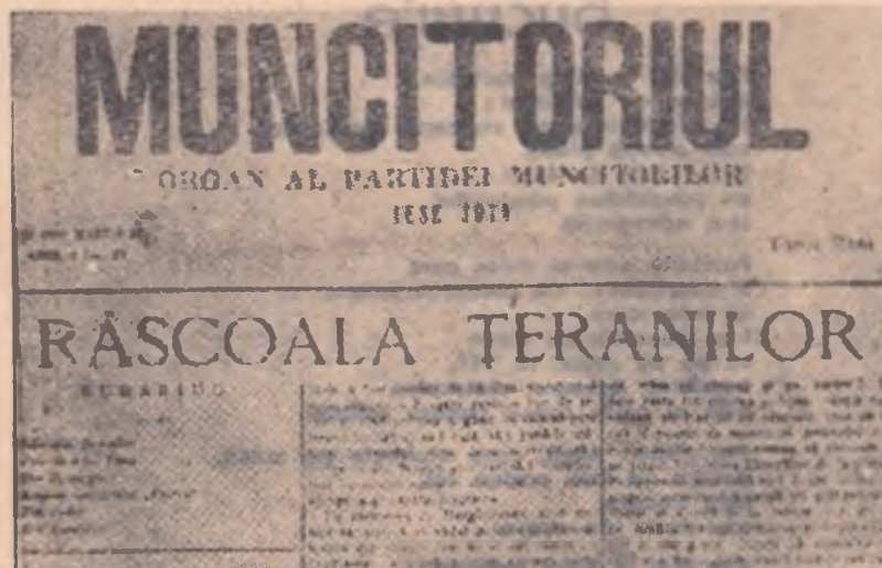
Gazeta „MUNCITORUL” în timpul răscoalei din 1888