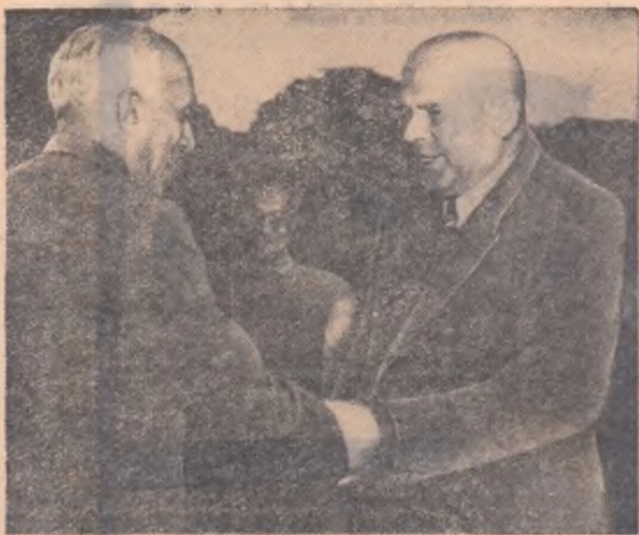
Jawaharlal Nehru și Chivu Stoica la reședința președintelui Indiei