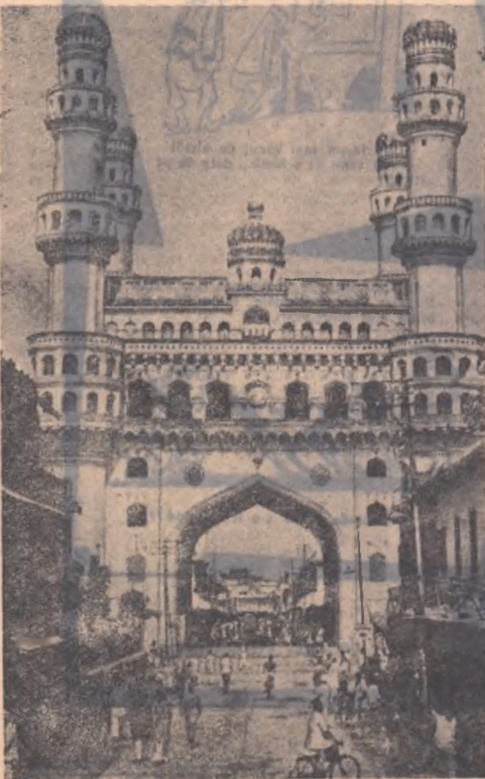
Poarta „Har Minar”, din orașul Heiderabad, construită în secolul al 16-lea