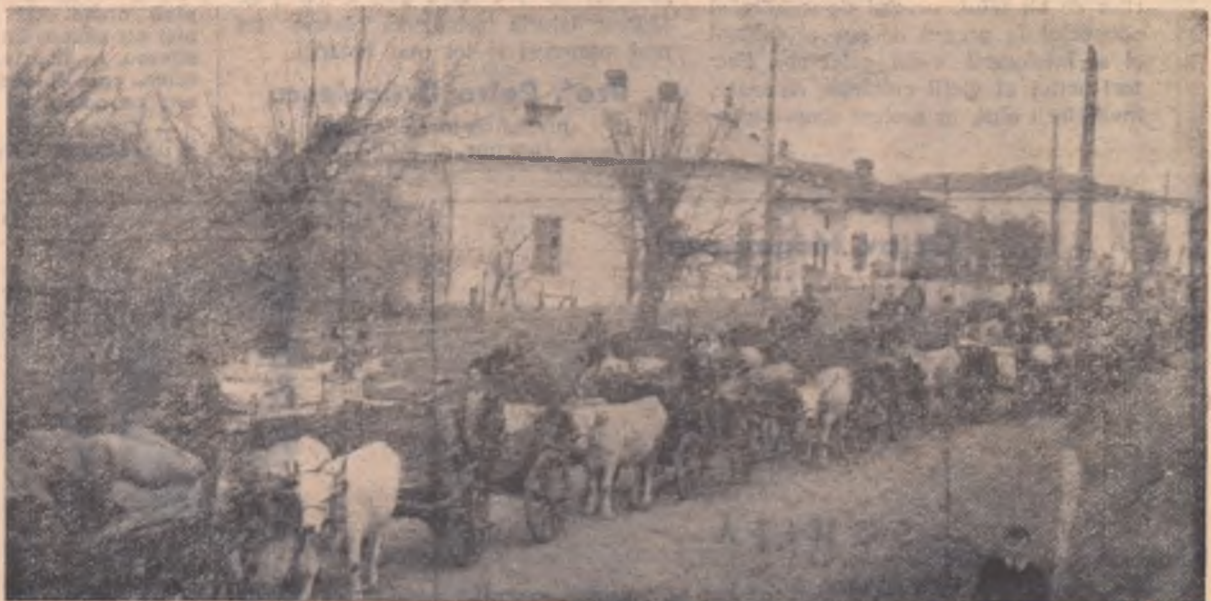
Spre baza de recepție din orașul Alexandria, regiunea București, se îndreaptă unul din convoaiele de care cu produse agricole achiziționate de cooperativele de consum din satele raionului.