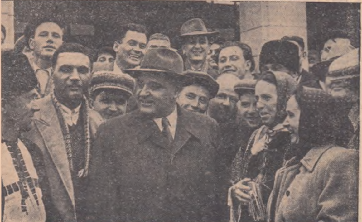
Tovarășul Gh. Gheorghiu-Dej în mijlocul delegațiilor, după încheierea lucrărilor consfătuirii.