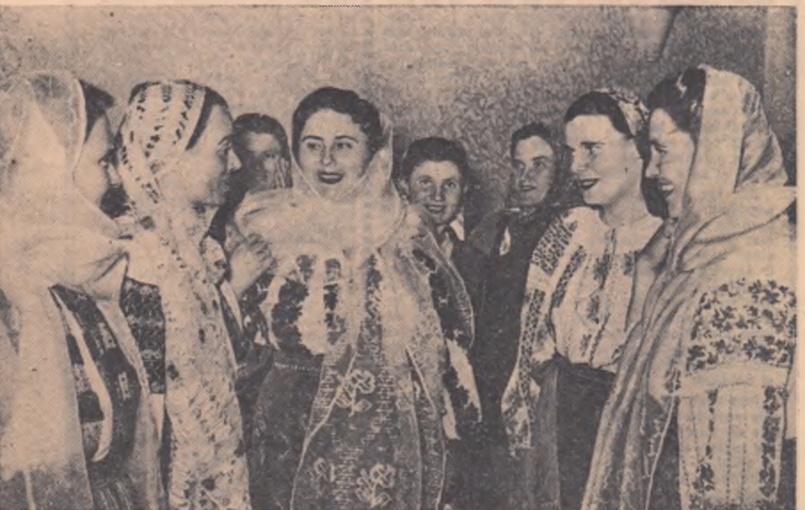
Un grup de delegație discutînd într-una din pauzele consfătuirii.