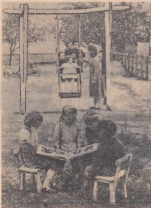
Recreație la... grădinița sezonieră!