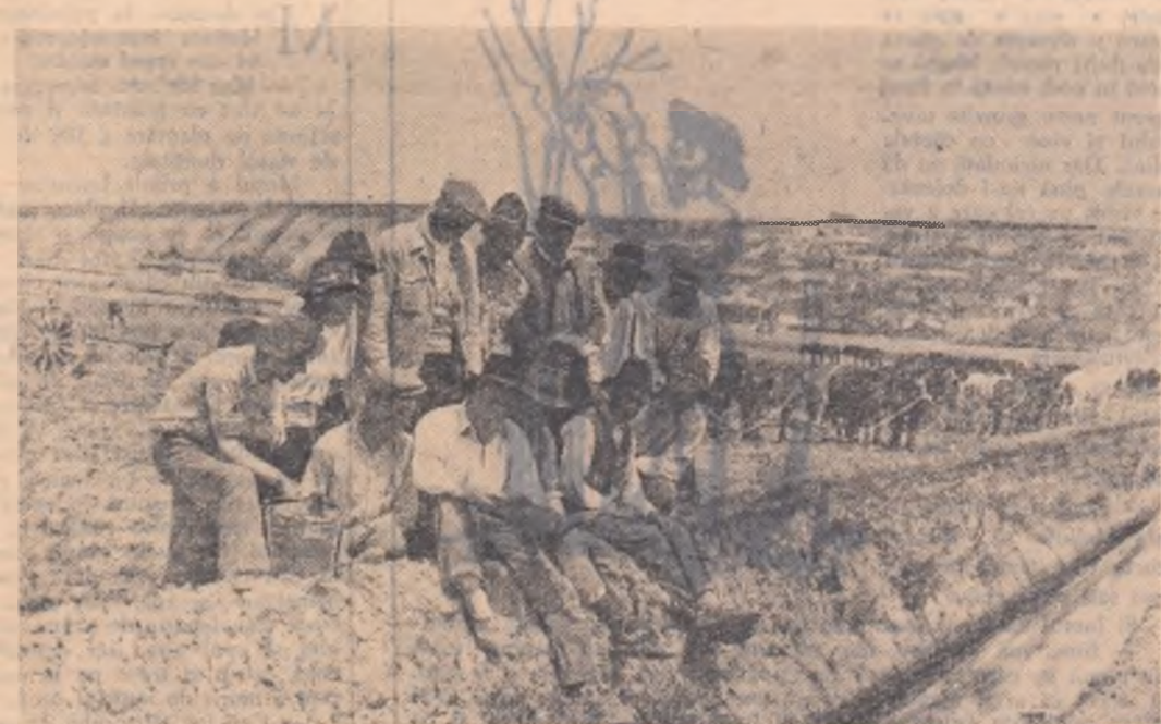
Pe ogor, în ceasul de odihnă de la amiază, colectivisții obișnuiesc să-și arunce privirea și pe ziarele proaspete aduse de la Fetesti.