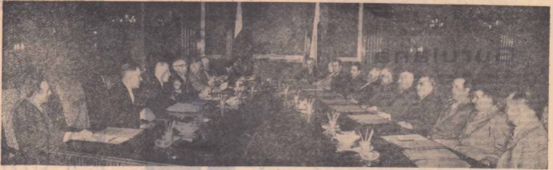
Aspect din timpul convorbirilor dintre delegația P.M.R. și a guvernului R.P. Romine și delegația P.M.U.P. și a guvernului R.P. Polone.