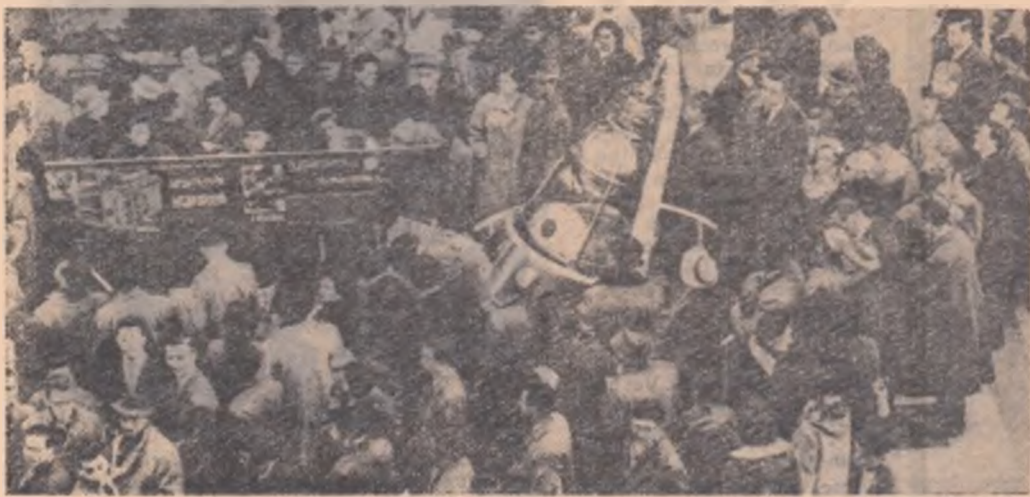
Macheta celui de al doilea satelit artificial al Pământului atrage numeroși vizitatori în pavilionul sovietic.