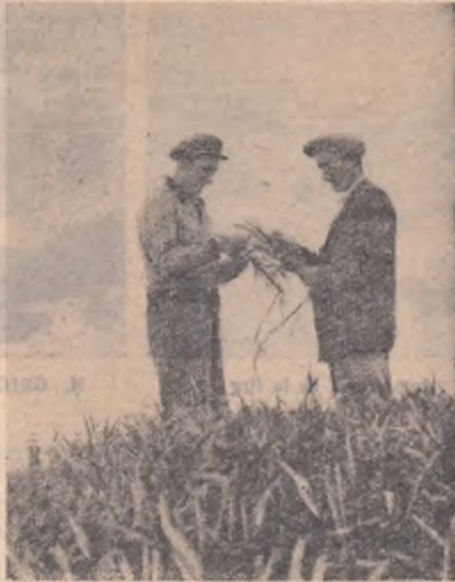
Președintele Iacob Stan împreună cu inginerul agronom Petre Valeriu controlează lanul de grîu.

Bătălia avea însă multe linii de desfășurare: în luncă zeci de atelaje în- sămînțau porumbul, iar alte zeci pregăteau locul pentru sfecla de zahăr. O parte din echipe se aflau la răsădnițe sau la dezgropatul vitei