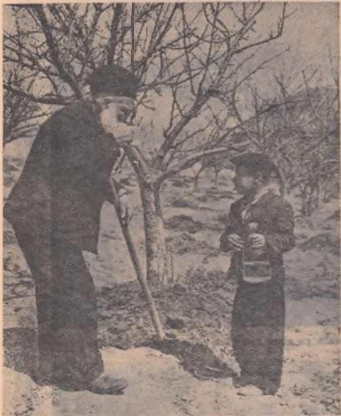
I n munții Azerbaidjanului, la o înălțime de peste 2000 metri deasupra nivelului mării, se află satul Pirasur. Acest sat este denumit și „satul celor cu vîrsta lungă”. Aici locuiește și cel mai bătrîn om din U.R.S.S.: Mahmud Eivazov, în vîrstă de 150 de ani. În ciuda vîrstei sale, Eivazov este viguros și nu suferă de nici o boală. El poate fi întîlnit la cîmp, la administrația colhozului sau în grădina sa. Mahmud Eivazov este decorat cu ordinul „Steagul Roșu al Muncii”. IN FOTOGRAFIE: Eivazov cu strănepotul său, Zakir.