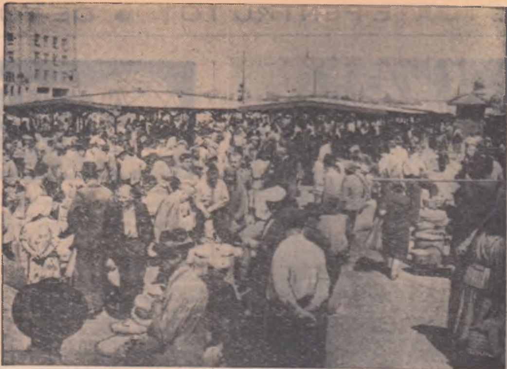
Țărani întovărășiți vînzîndu-și produsele pe unul din platourile Tîrgului Moșilor