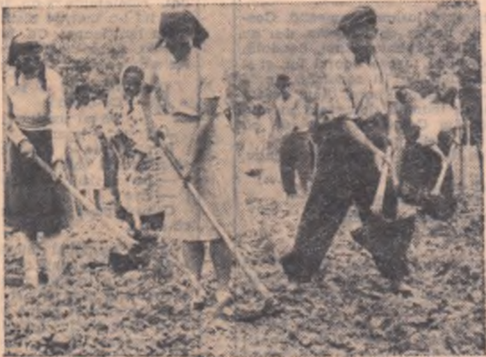
Pe tarlaua întovărășirii agricole din satul Roșița, comuna Ploștina, regiunea Craiova, munca se face laolaltă. Iată-l pe întovărășit grăbind terminarea prașilei a I-a la porumb.