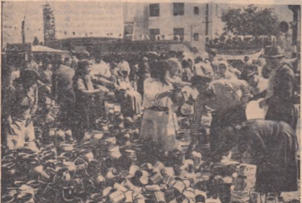
Produsele de olărie au multă căușă