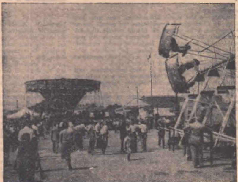
Tradiționalele „lanțuri” și „bărți” sînt în plină activitate...