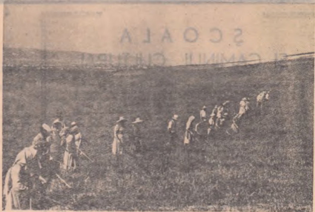
Sporirea producției la hectar este una din grijile de seamă ale colectivștilor din comuna Acățari, raionul Tg. Mureș. În urma harnacilor colectivștii griul răsulă nșurat, fiind curățat de buruieni.