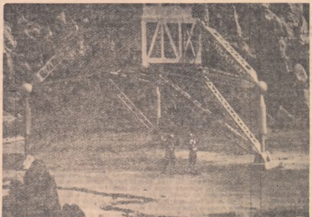
Primii oameni coboară din astronavă punând piciorul pe solul lunar...

Pe ecranele cinematografulor din patria noastră rulează un interesant film științifico-fantastic: Drumul spre stele . Subiectul filmului este inspirat din cercetările și realizările savanților și tehnicienilor sovietici pe tărîmul astronauticii.