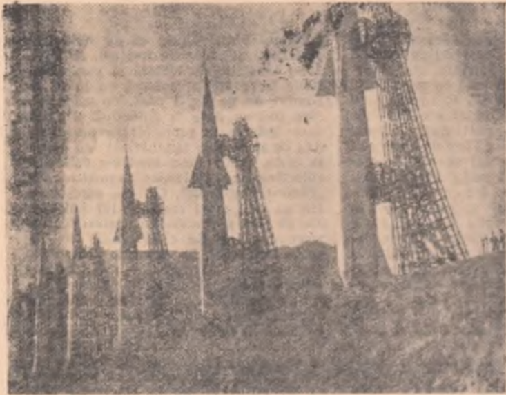
Pe cosmodrom, rachetele așteaptă semnalul decolării spre alte planete...

Imagini din filmul științifico-fantastic realizat de studioul de filme documentare din Moscova.