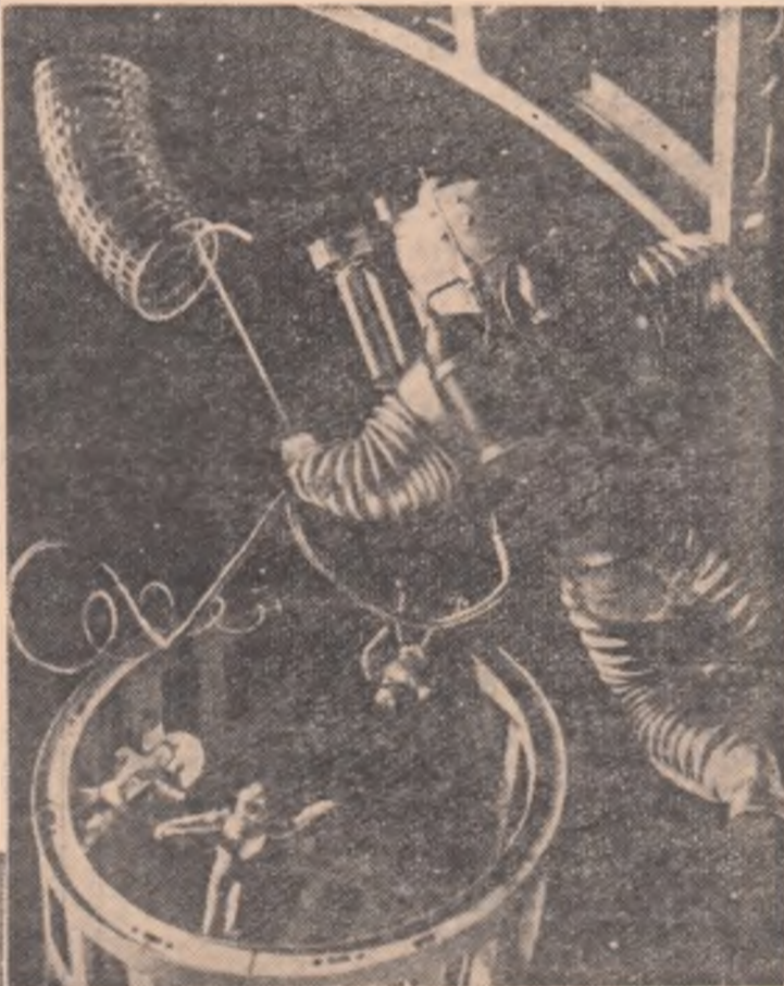
Un mic popas la o „bază” de aprovizionare cu combustibil și alimente.