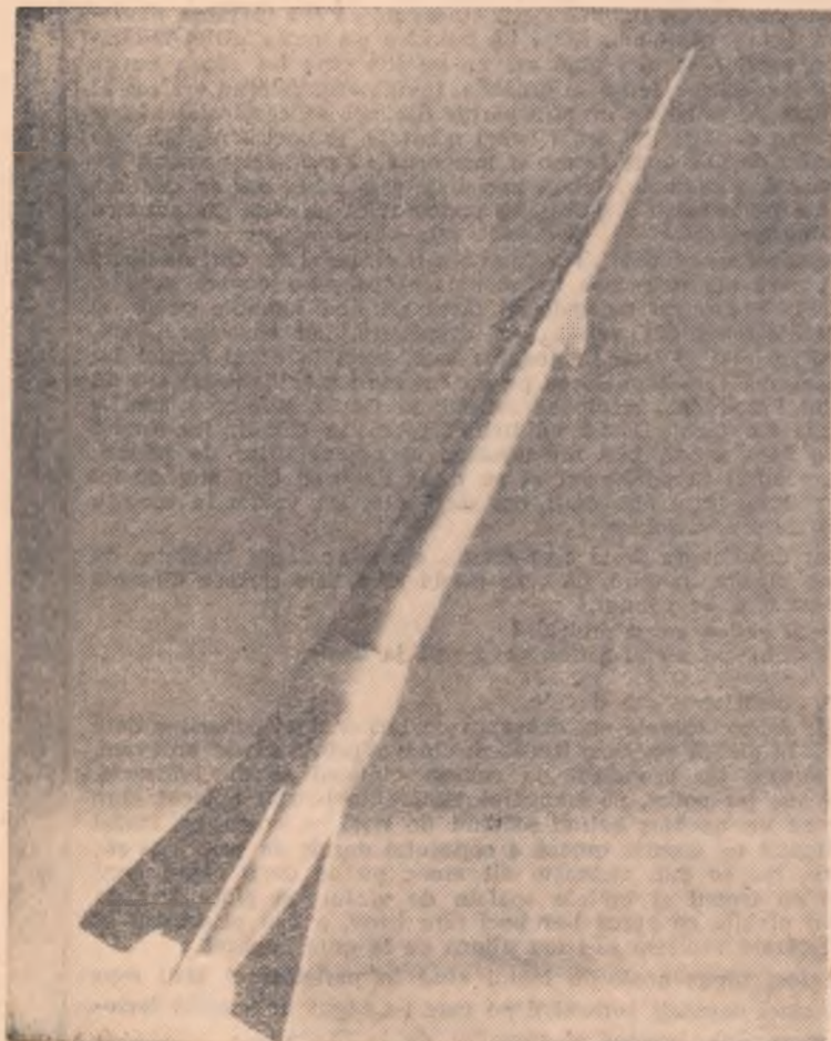
Racheta a pornit...