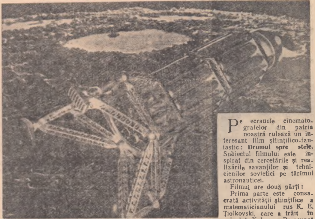
Astronava „aterizind” în Lună...