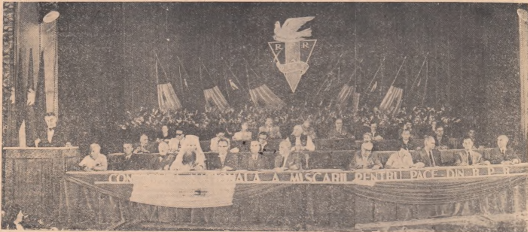
Prezidiul Conferinței naționale a mișcării pentru pace din R.P.R.

Clădirea Ateneului R.P.R. a găzduit timp de două zile lucrările Conferinței naționale a mișcării pentru pace din Republica noastră Popu-