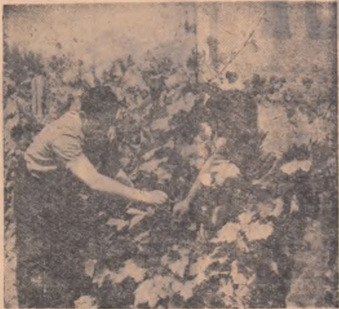
Via gospodăriei agricole de stat din comuna Ștefănești, regiunea Pitești, promite un rod bogat, așa cum se vede de altfel și din fotografia de mai sus.