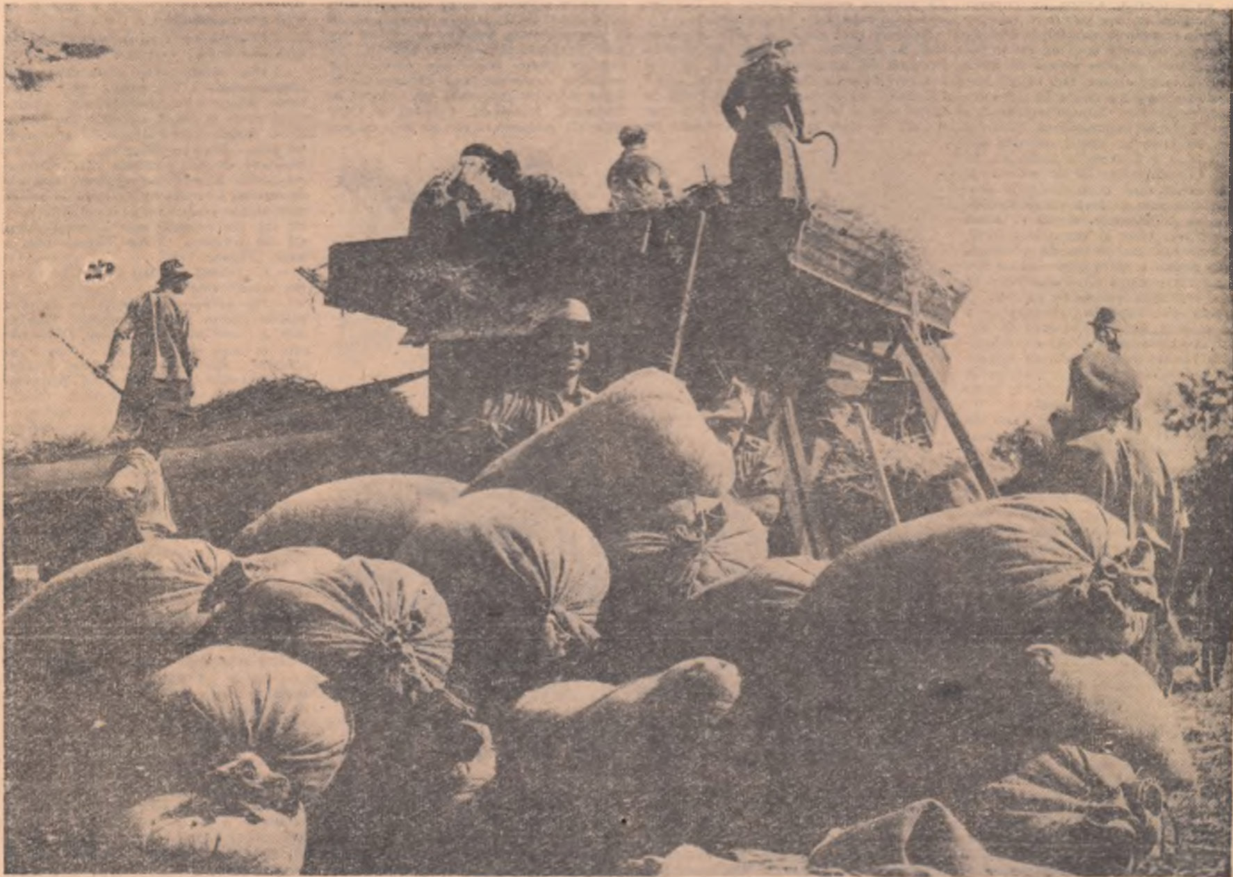
Știința și practica au demonstrat că grăbirea recoltatului, căratul snopilor la arie și treierul sunt lucrări care nu suferă nici o întârziere. Cei care țin seama de acest adevăr, câștigă. Și ca să câștige, colectivii din comuna Baba Ana, regiunea Ploiești, dau zor. Sacii plini pe care îi vedem în fotografie sînt dovada priceperii și răsplată hărniciei lor.