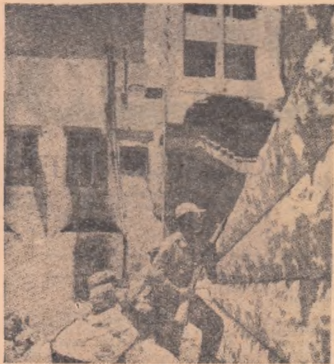
Iată cum arată locuința din Beirut a lui Sami Solh, premierul prooccidental al Libanului, după ce a fost dinamitată de răsculați.

— Și criza economică, moș Vișane, dar și presiunea mare a celorlalte țări din occident care s-au săturat să tot fie stăpînite de „unchiul Sam”. Imperialiștii nu se pot pune multă vreme împotriva cerințelor vieții. Încă în primii ani ai puterii sovietice, V. I. Lenin, vorbind despre reluarea relațiilor economice ale Uniunii Sovietice cu statele capitaliste, a spus că „există o forță mai mare decît dorința, voința sau hotărîrile oricărui dintre statele sau clasele dușmănoase și aceasta este forța relațiilor economice mondiale, care le silește să păsească pe calea legăturilor cu noi”. Această forță, moș Vișane, crește neconștient.