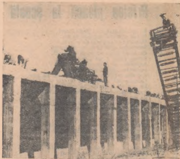
Refacerea utilajului la o mină carboniferă din R.P.D. Coreeană.

Dacă Chinei, al cărei popor este ferm hotărît să-și apere cauza dreaptă, îi va fi impus un război, nu ne îndoim cîtuiși de puțin — se spune în mesaj — că poporul chinez va da agresorului riposta cuvenită. Marele popor chinez care numără 600 de milioane de oa-