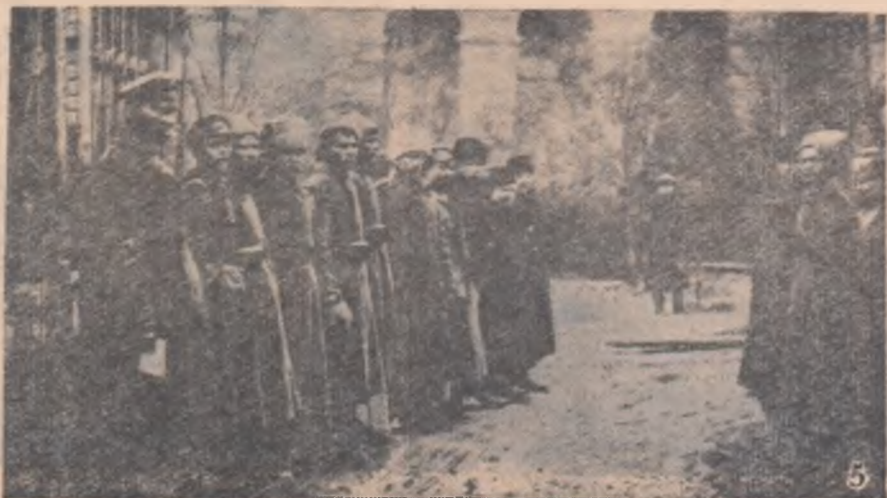
Întrearea Institutului Smolnii este străjuită de un alt pichet al Gărzii Roșii... (fotografia nr. 5).