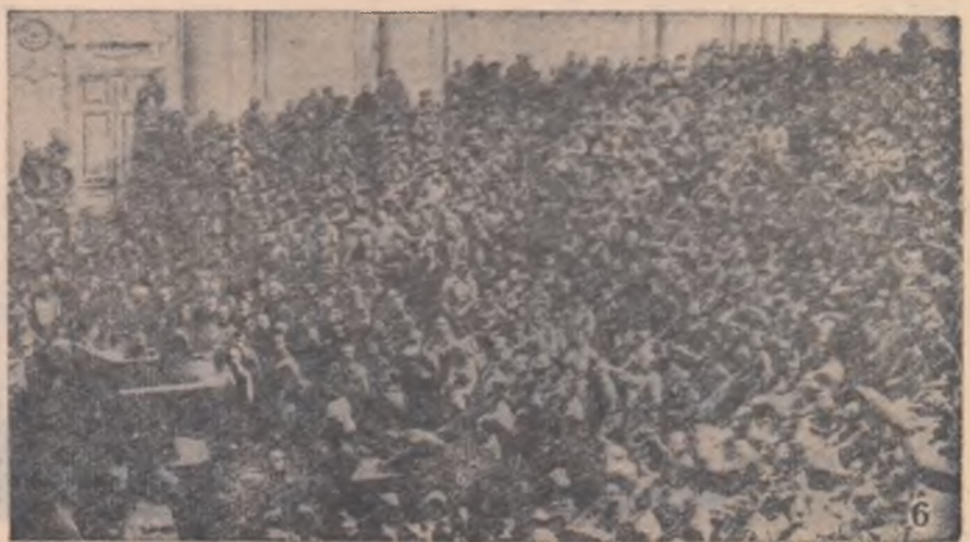
marea sală a palatului se desfășoară lucrările unelor dintre primele ședințe ale Sovietului de deputați ai