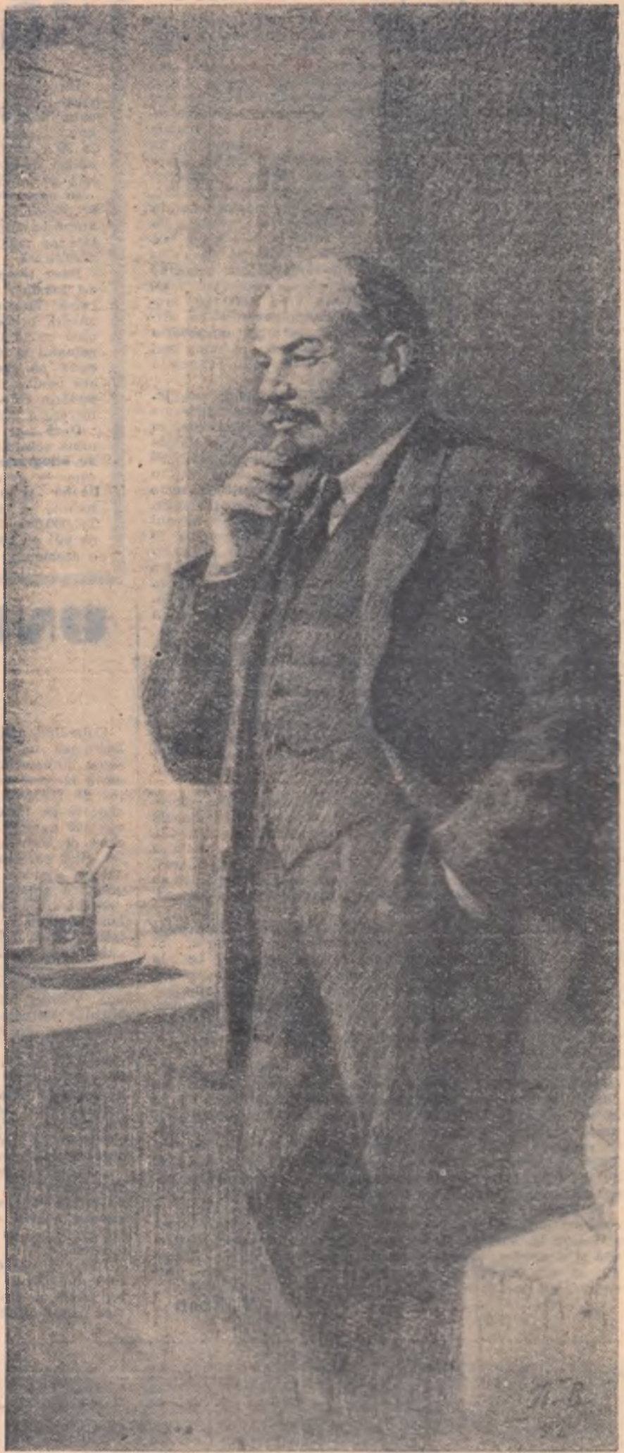
Vladimir Ilici Lenin

— Lăsați astea, tovarăși, că doar n-oți fi vrînd să spuneți că sînt specialist în materie. Ia, am venit și eu așa, din curiozitate. Și nu regret că am venit Gospodăria voastră mi-a plăcut foarte mult, vă mul- țumesc!