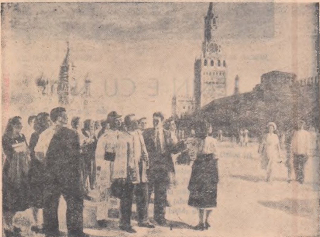
Delegație de țărani muncitori din R.P.R., vizitînd Moscova (pictură).