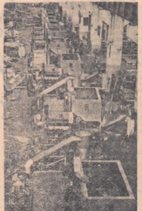
Aspect de la fabrica de combine din Weimar (R. D. Germană)

1953. Creșterea bunăstării colectivizatorilor bulgari se reflectă și prin marele număr de locuințe construite la sat: în cursul celui de al doilea plan cincinal țării bulgari au construit peste 62.000 de case noi. De asemenea, fiecare a patra familie de colectivizatori are aparat de radio.