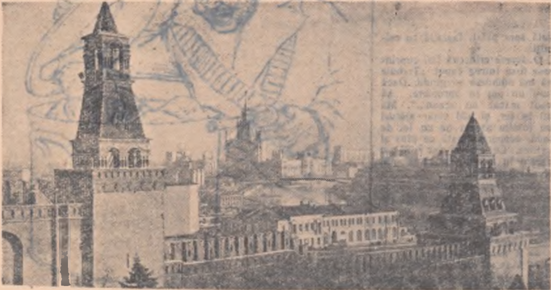
Moscova azi. Vedere dinspre Kremlin