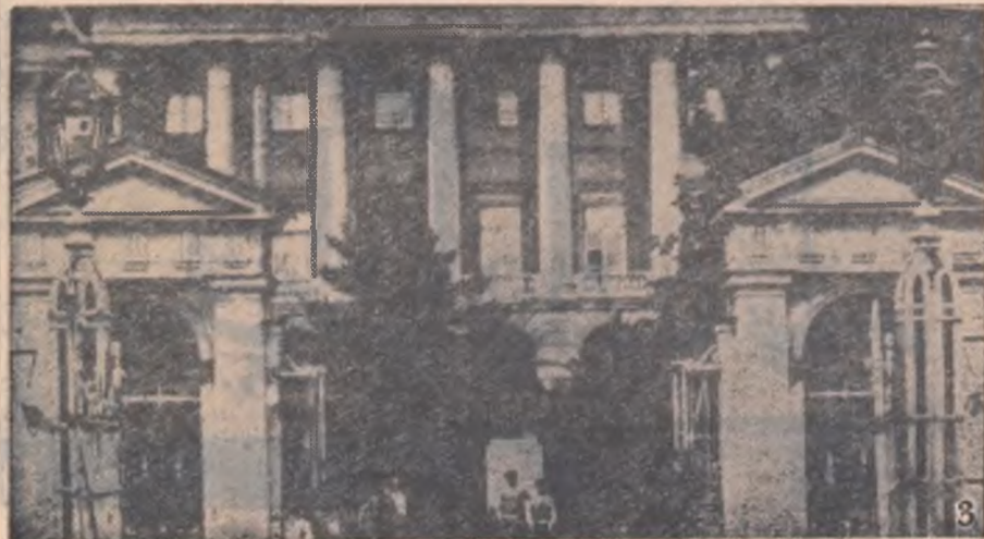
De aici, de la Institutul Smolnî, unde seoseau neîn- ceteb unități ale trupelor revoluționare și detașamente