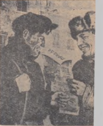
Neînfricatele detașamente revoluționare pornesc spre front, la luptă împotriva dușmanilor tinerei Puteri Sovietice (fotografia nr. 7). Luptînd pentru zdrobirea rebeliunii contrarevoluționare din fortăreața Kronstadt, ostașii roșii și-au dovedit o dată mai mult devotamentul nemărginit față de revoluție, față de partidul lui Lenin (fotografia nr. 8). Patrula de soldați roșii vegheau zi și noapte, gata să stîrpească orice uneltire a ultimelor rămășițe contrarevoluționare (fotografia nr. 9). Tînăra Țară Sovietică a pășit de îndată pe calea construcției plene a socialismului.