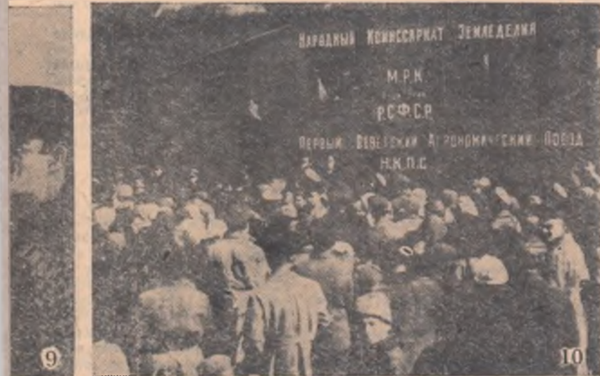
9 10 i agriculturii. Spre sate agricole, care aveau me- ndurile țăranilor munci- tori cuvântul agrotehnicii înaintate. Una dintre aceste caravane agricole este întâmpinată cu entu- ziasm de țărani (fotografia nr. 10).

Am vădit pe Ilici și pe Nadejda Konstantinovna în timpul vizitei la gospodăria agricolă.