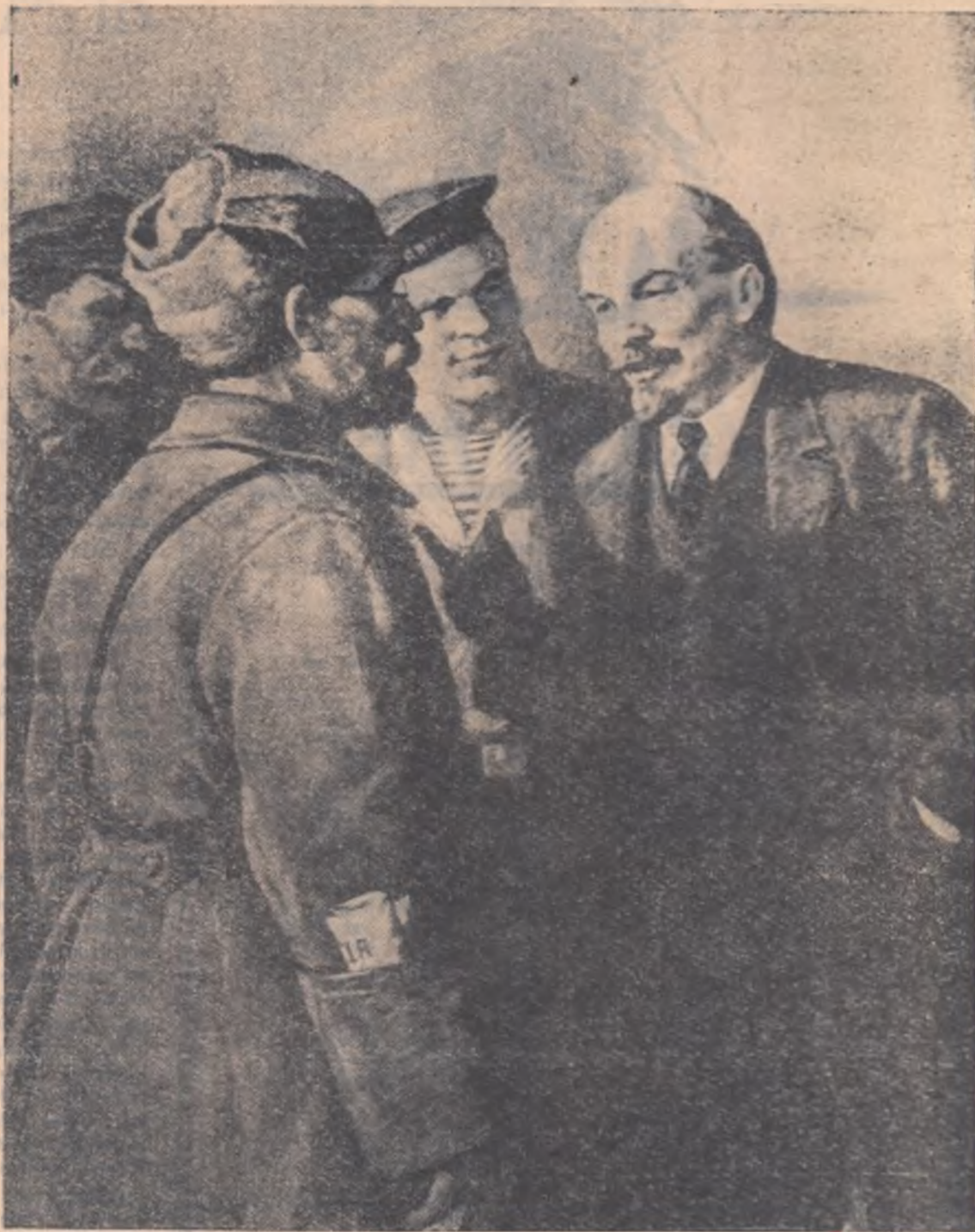
V. I. Lenin de vorbă cu ostașii gărzilor roșii, la Smolnî