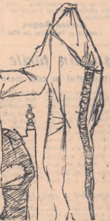
Desene de Cik Damadian

— Învește-i în jurnal o pe- reche de-a prințului! — hotărî cel care făcea împărțea.