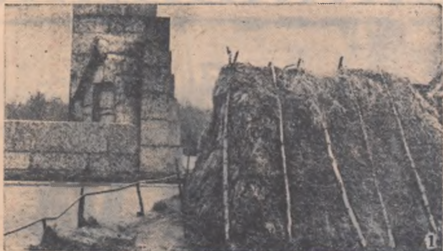
Din această colibă de la Razliv, lângă care a fost înălțat un monument de granit, Lenin a condus din ilegalitate lupta împotriva guvernului provizoriu burghez ai cărui copoi îl căutau pretutindeni. De aici,