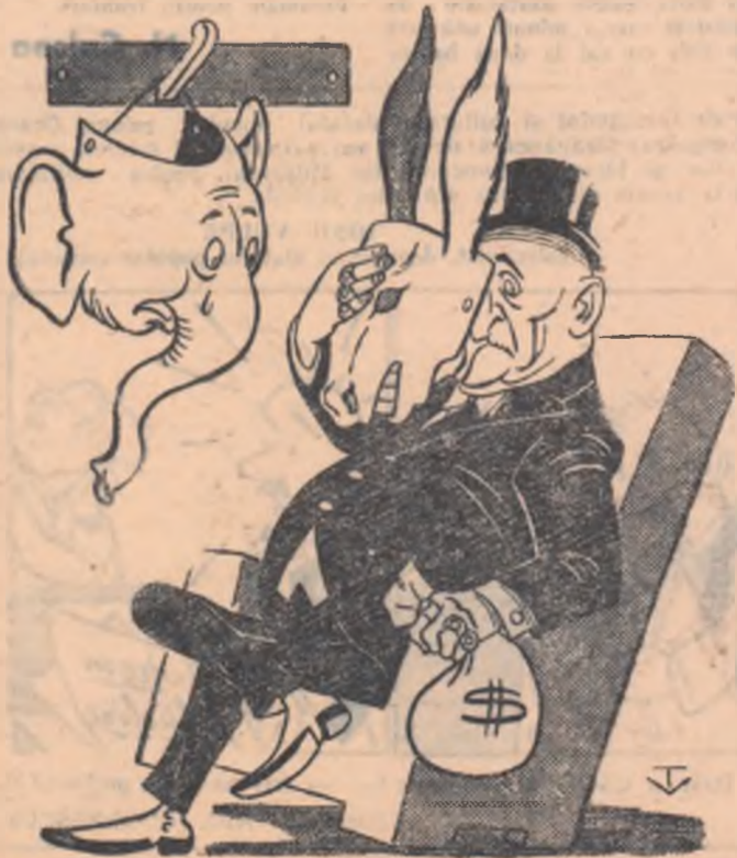
...Masca se schimbă, politica rămîne aceeași!

Dar continuarea politicii agresive, „de pe poziții de forță”, dictată de cercurile monopoliste nu poate aduce inspiratorilor ei decât noi înfrîngeri pe arena internațională.