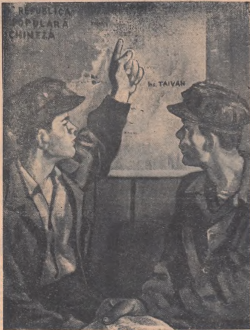
GHEORGHE JILAVEANU „Comentind ultimele stiri” (pictură). (Din Expoziția biennială de Arte plastice a artiștilor amatori din regiunea Ploiești)