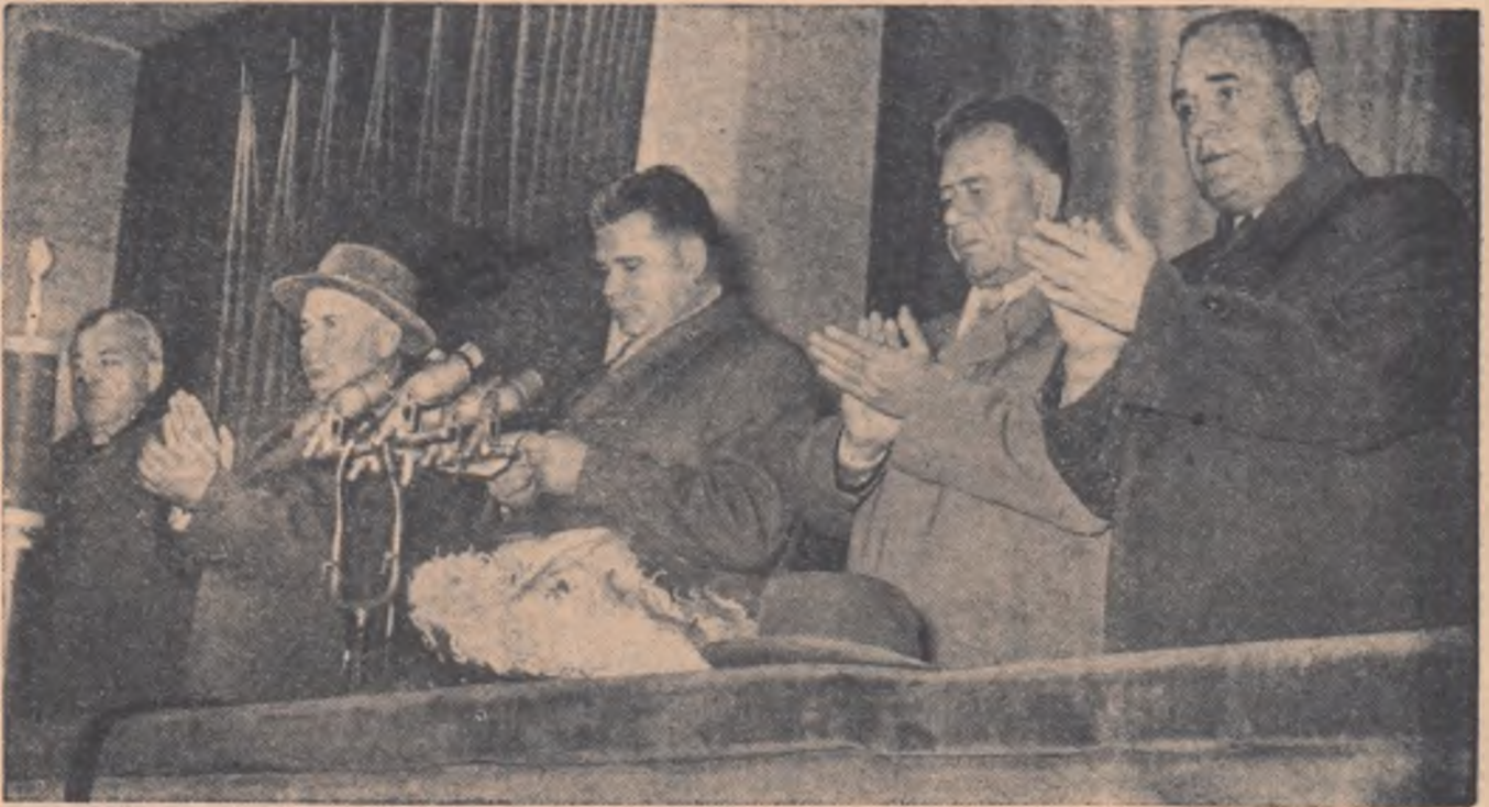
Tribuna oficială în timpul mitingului.

În cuvîntarea sa, tovarășul Vladimir Gheorghiu a arătat că Marea Revoluție Socialistă din Octombrie a exercitat o influență covârșitoare asupra destinelor întregii omeniri. Uniunea Sovietică și-a cîștigat dragostea și admirația sutelor de milioane de oameni ai muncii aflați în robia capitalismului și colonialismului. Steagul roșu sub care a biruit Revoluția din Octombrie flutură victorios pe o treime a globului pămîntesc. Peste un miliard de oameni, strîns uniți în