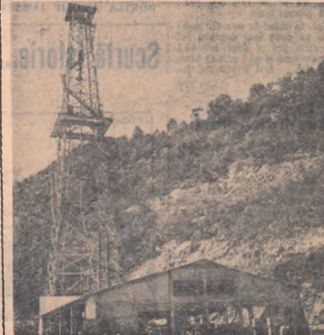
Utilajul petrolifer romînesc este mult apreciat peste hotare. Iată în fotografie o sondă construită de specialiști romîni în India.