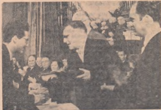
Arta muzicală romînească a obținut un mare succes cu ocazia Concursului internațional al pianistilor și violoniștilor „P. I. Ceaikovski” care a avut loc în U.R.S.S. și la care au participat cei mai buni artiști tineri din întreaga lume.