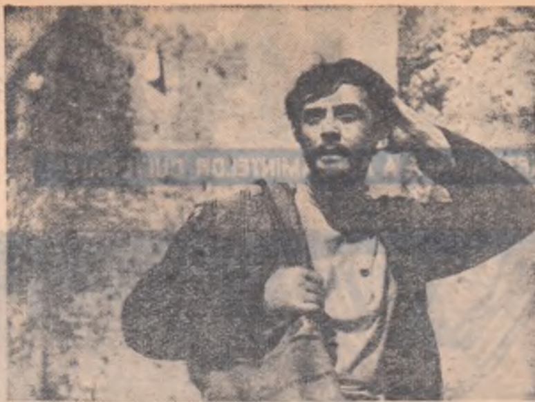
Scenă din film