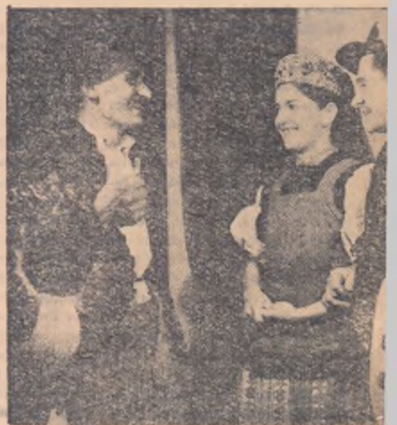
De un frumos succes s-a bucurat piesa „Valea tatii” în limba maghiară de echipa de teatru din

Mulțumim cîmirea frățească ce ni s-a făcut succes dezvoltărilor artistice din voastră”.