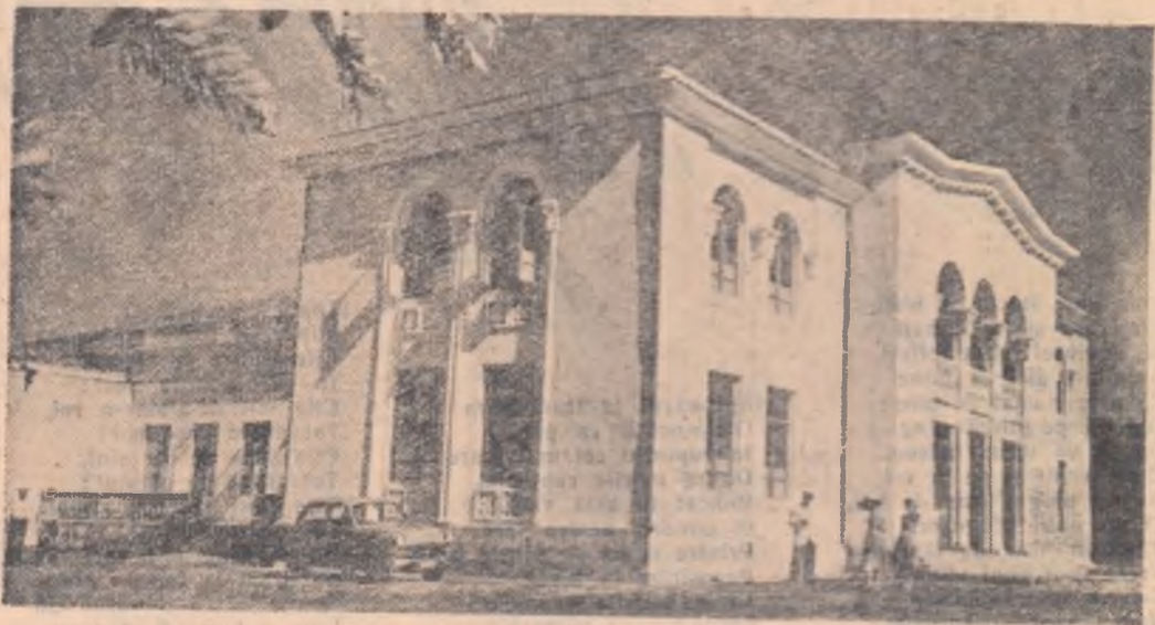
În satele din Uniunea Sovietică se construiesc sute de cluburi ale colhozurilor și sovhozurilor. În fotografie: clădirea noului club al colhozului „Kirov” din R.S.S. Autonomă Abhază. Clubul are o sală de spectacole spațioasă, o bibliotecă cu mii de volume și alte încăperi în care își desfășoară activitatea cercurile de artiști amatori.

Partidele de opoziție din Grecia critică vehementă poziția guvernului grec în blema Ciprului. Pasalidis, președintele unii democrate de stînga (E.D.A.), a at că politica nehotărîtă a guvernului ribuire la menținerea jugului colonialist Cipru. El s-a pronunțat pentru mobilizaturor forțelor care sprijină autorminarea Ciprului. Deputații liberali, zresisți și cei ai partidului social-popular erut, de asemenea, autodeterminarea Ciui.