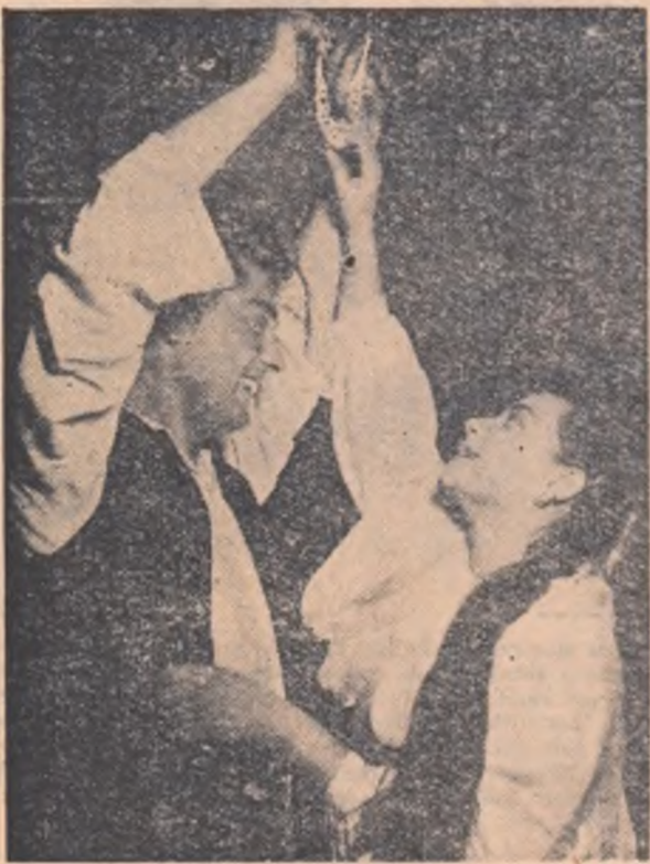
Scenă din piesa „Fata tatii cea frumoasă”.