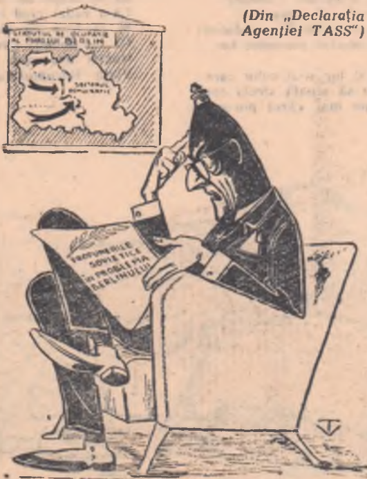
Dulles: — Asemenea propuneri nu-mj pot intra în cap..