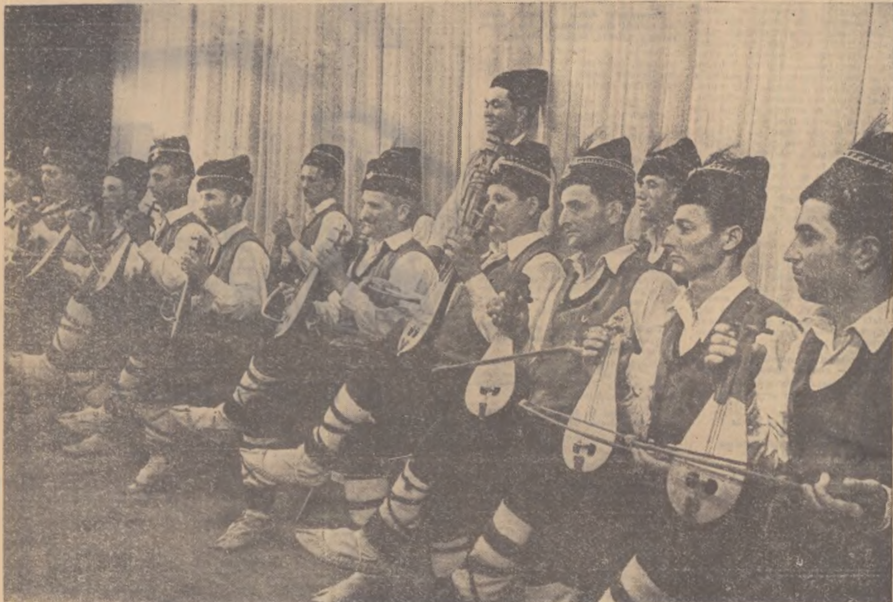
Biblioteca Centrală Regiune 3 Hunedoara-Deva

Tibalca este un instrument muzical popular cu veche tradiție în unele sate din Dobrogea. Oieri și pescari vestiți, colectivștii din comuna Ciarnurlița de Jos, satul Lunca, raionul Istria, sînt la fel de vestiți și ca țibalca. O răsplată binemeritată a acestei formații este mențiunea primită la al V-lea Concurs pe țară al artiștilor amatori.