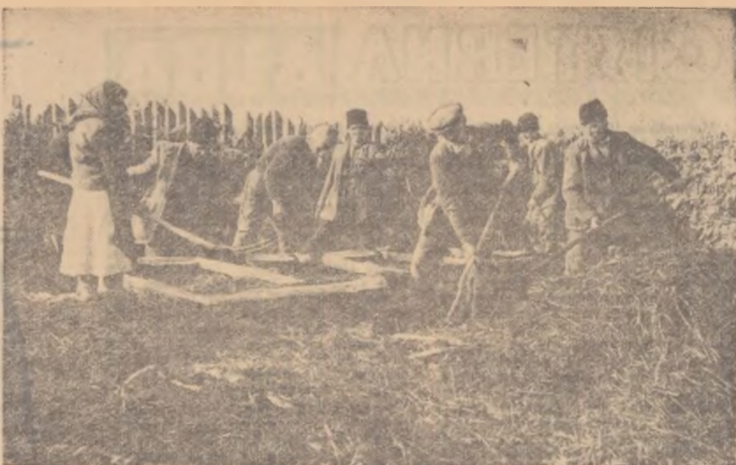
O ocupație educatoare de mari venituri — legumicultura. Iată-i pe colectiviștii din Grădinari, regiunea București, pregătind răsăturile necesare grădinii lor de legume.