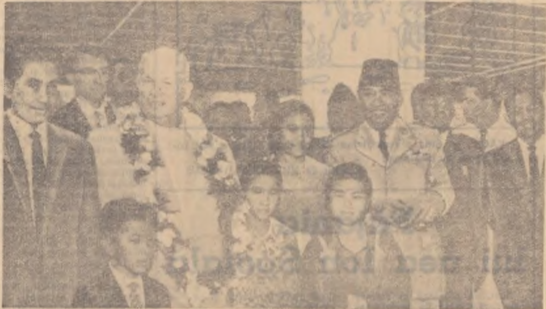
Aspect din timpul vizitei lui N. S. Hrușciiov în Indonezia.