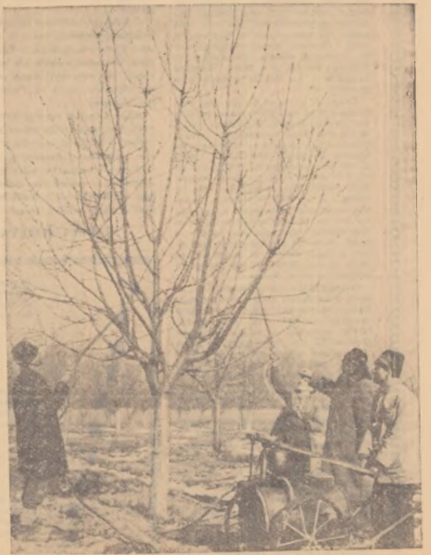
În lipsa frunzișului și florilor, lupta împotriva dăunătorilor livezii dă rezal-tatele cele mai bune. Iată-i pe colectivității din Fălcoianca, regiunea Bucu-rești, executînd stropirea pomilor.