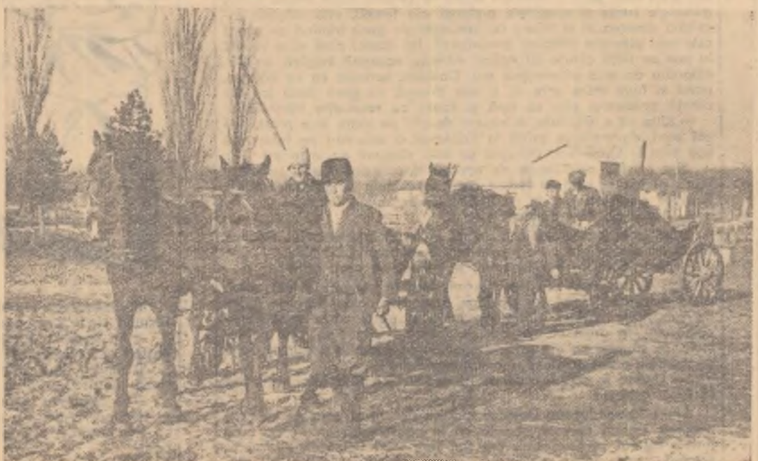
Colectiviștii din comuna Grădinari, regiunea București, pun mare preț pe îngrășarea ogoarelor cu gunoi de grajd. Ei pun astfel temelie unei recolte bogate.