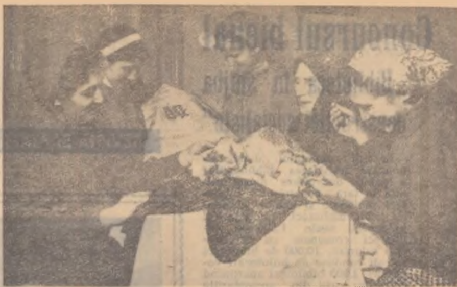
Se lucrează noi costume naționale pentru echipa artistică din comuna Domnești, regiunea București