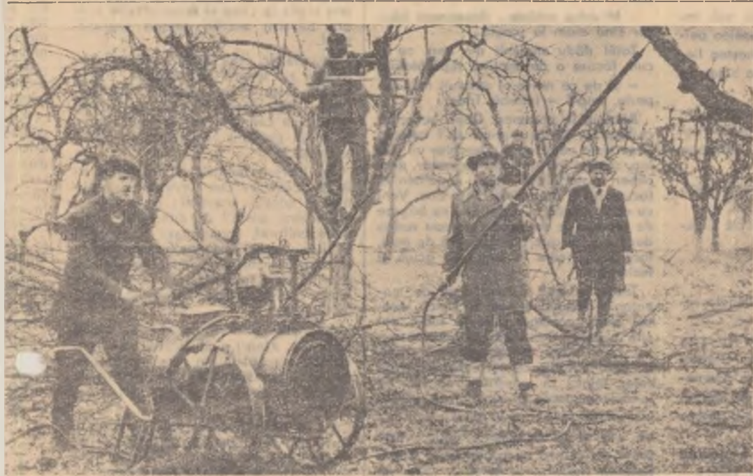
Curățitul și stropitul pomilor la G.A.C. „Ilie Pintilie” din comuna Valea Mare, raionul Pitești.

În articolul: „Intovărășiți în vizită la colectivități” apărut în nr. 638 din 16 martie 1960, alineatul 2, coloana a 3-a se va citi: Oaspeții au vizitat remizele, grajdurile, atelierelor și magazia gospodăriei în care încap 80 vagoane de cereale.