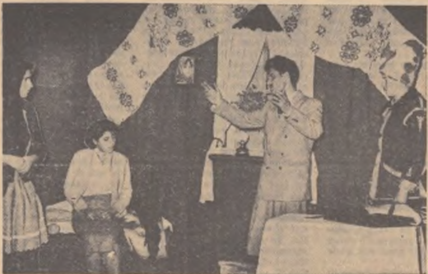
Echipa căminului cultural din comuna Tîncăbești, regiunea București, s-a prezentat la fața intercomunală a concursului „I. L. Caragiale” cu piesa „Bucuroși de oaspeți”. Iată un aspect din timpul spectacolului.