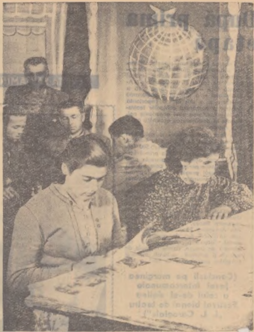
Aspect de la colțul roșu al gospodăriei agricole colective „Drapelul Roșu” din Salonta, regiunea Oradea.

Cetățenii, dornici să ci- tească, mai împrumută oțte o carte de la bibli- teca școlii. Aceasta însă nu poate face față, nu