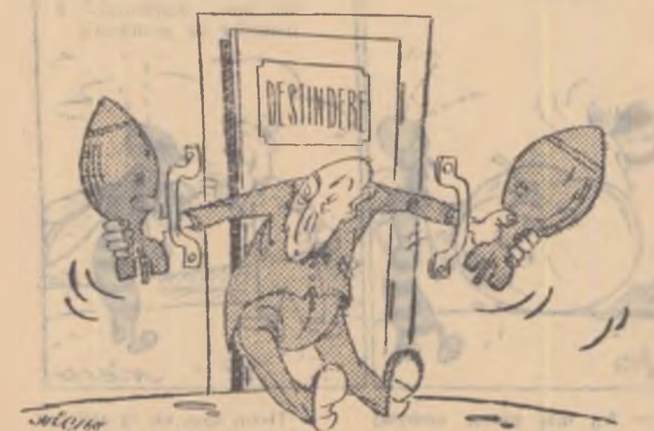
ADENAUER: — Mi-e imposibil să-mi modific poziția! Nu pot să-mi scoț mîințele!

Caracterul constructiv al noii propuneri sovietice este alfit de evident încît chiar și agenția americană U.P.I., a fost nevoită să recunoască că aceasta constituie „o acțiune surprinzătoare care ar putea avea o contribuție însemnată pentru lichidarea impasului în care se află tratativele Est-Vest în problema dezarmării...”