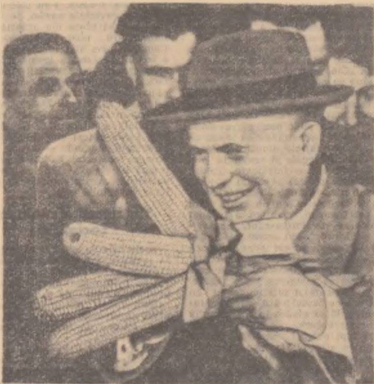
La Pau, lui N. S. Hrușciov i s-au oferit în dar, potrivit unei tradiții locale, știuleți aurii de porumb.

Ceea ce îndreptățește speranțele că martie va fi reușit...!