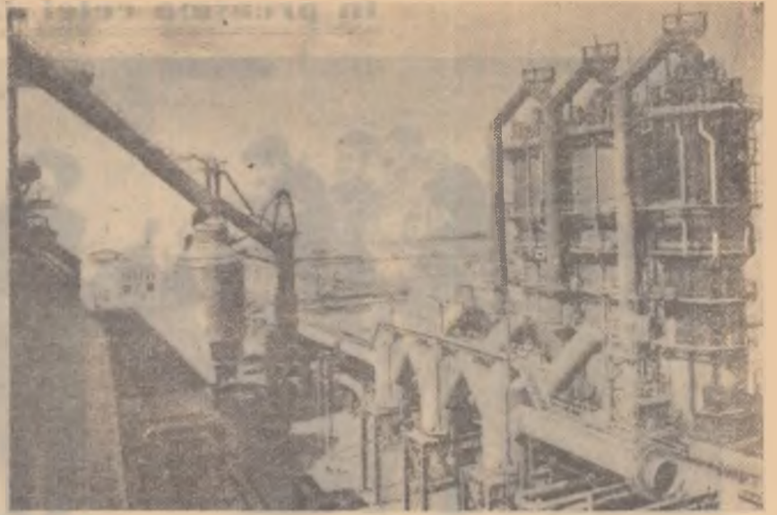
Poporul țării ungar va sărbători la 4 aprilie aniversarea a 15 ani de la eliberarea sa de sub jugul fascist.

Mulțimea — aproape 1000 de persoane, printre care indesebi gospodine care staționau de aproape o oră în ploaie — a primit-o pe d-na Hrușciova, care a vizitat liceul Claude Monet cu strigăte de „Ura” și „Trăiască Nina”. D-na Hrușciova le-a zîmbit și a schițat un salut cu mîna. Femeile din mulțime au agitat mici drapele tricolore și roșii. La ieșire, o femeie a întins copilul său către d-na Hrușciova pentru a-i înmîna flori și a declarat: „Sintem tovarășe”. D-na Hrușciova a îmbrățișat copilul.