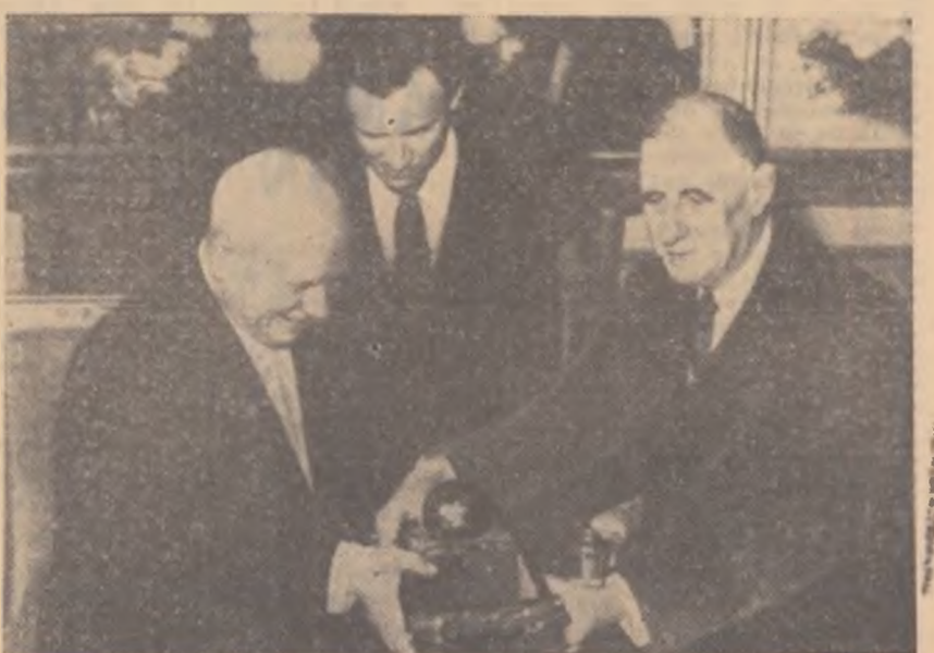
N. S. Hrușciiov oferă în dar generalului De Gaulle o copie a fanionului depus pe Lună de racheta sovietică și macheta ultimului satelit artificial al Pămîntului lansat de U.R.S.S.

„Parisul v-a și oferit inima sa, — a spus aici tovarășul Maurice Thorez — deoarece el a recunoscut în dv. pe discipolul credincios al lui Lenin, pe omul a cărei inițiativă multilaterală și curajoasă a contribuit la avîntul fără precedent al economiei sovietice, la