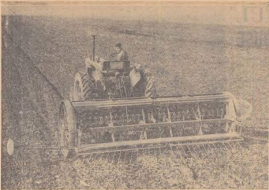
Insămînțarea sîmței de zahăr pe terenurile gospodăriei agricole colective din comuna Stoenești, regiunea Craiova.