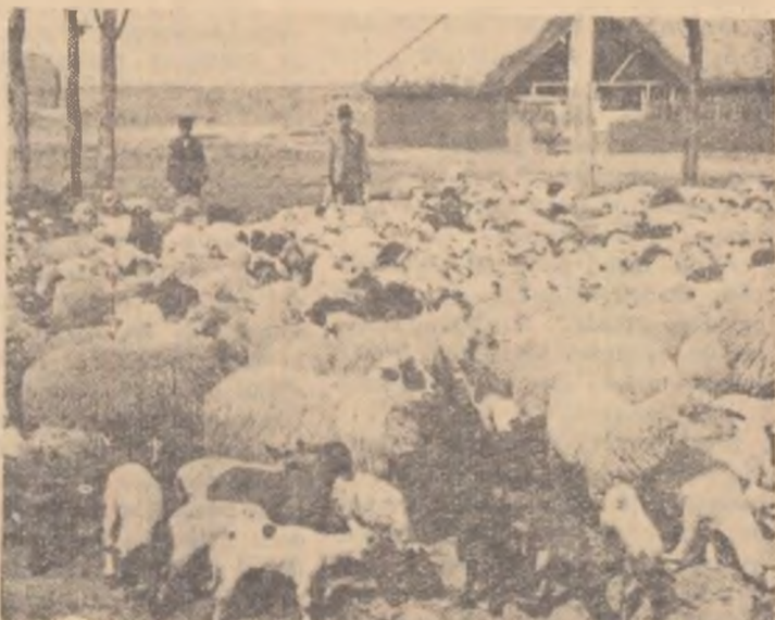
Zilele frumoase de primăvară au poposit și pe meleagurile comunei Băbiciu, regiunea Craiova. Mieii în curînd vor gusta colțul firav al ierbii.

Brigada artistică de agitație pregătește o surpriză. În programul nou pe care a început să-l redacteze, brigada a rezervat un loc pentru cei care vor face cele mai multe ore de muncă voluntară și, bineînțeles, și pentru cei ce se vor număra printre co-dași.