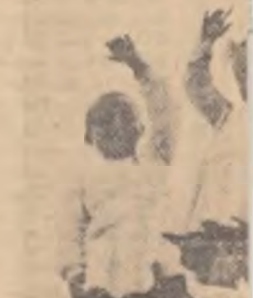
În timp ce părinții muncesc în colectivă. În fotografie