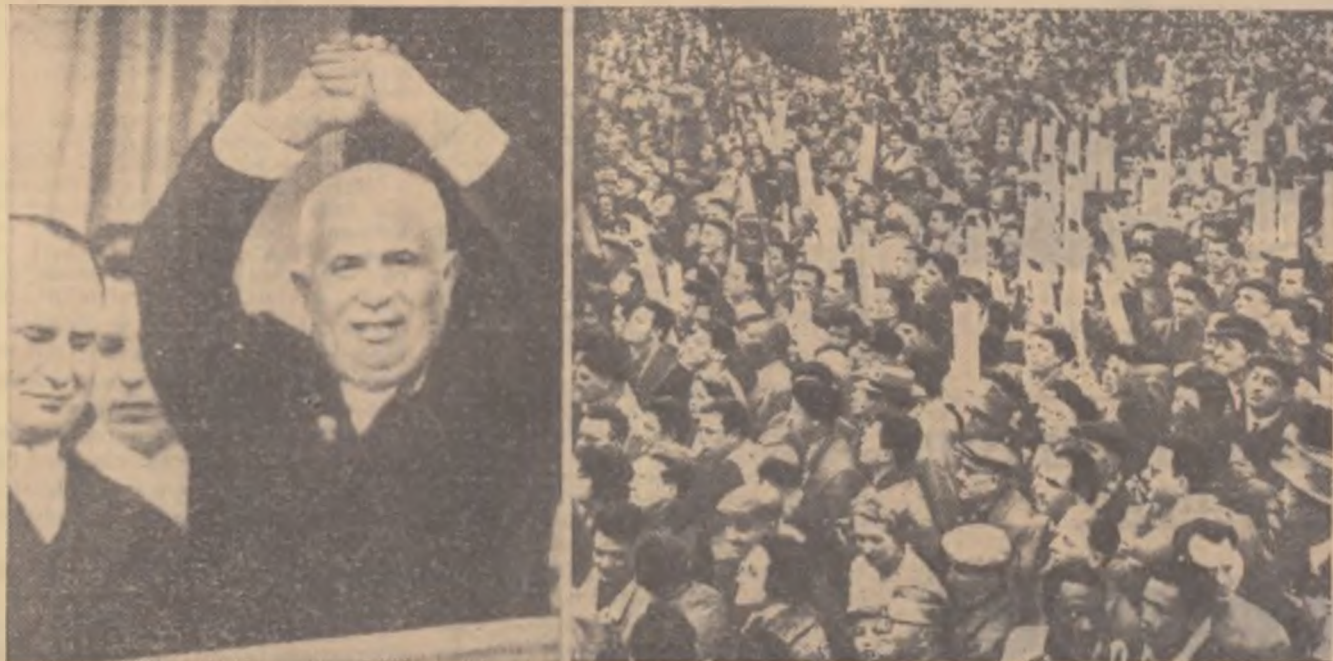
N. S. Hrușciiov, în balconul palatului Quai d'Orsay, răspunzând mulțimii care-l ovaționează, (stînga). Zeci de mii de patrioți s-au masat în fața clădirii Consiliului Municipal, pentru a-l vedea și aclama pe șeful guvernului sovietic, (dreapta). (Telefoto)

REVISTA SAPTAMINALA A ASEZAMINTELOR CULTURALE