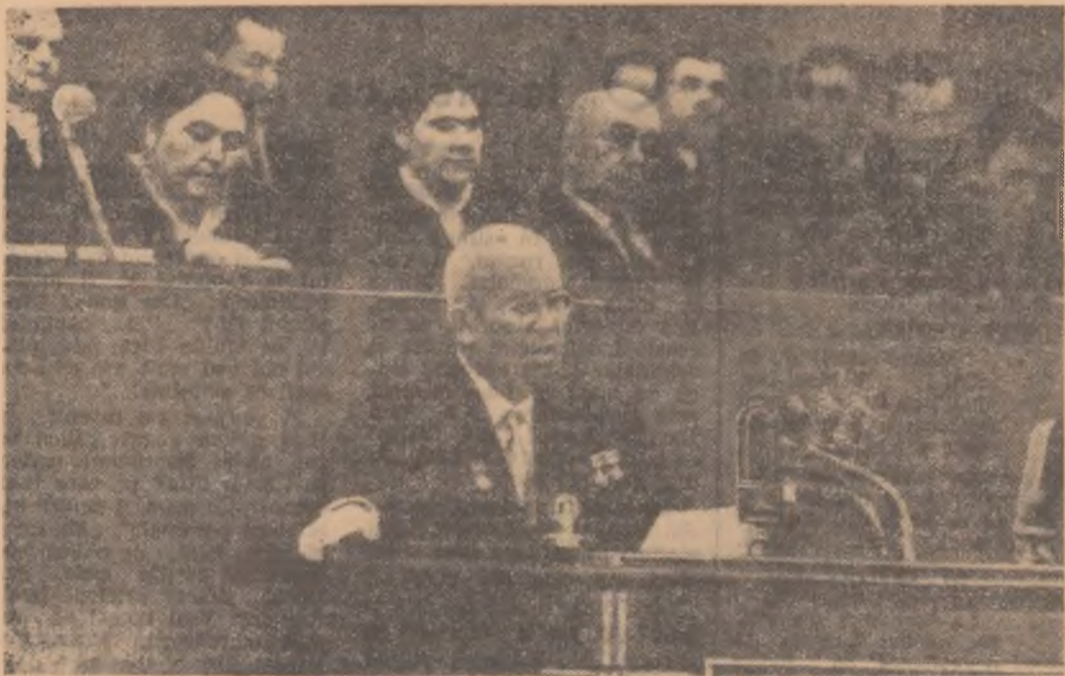
N. S. Hrușciov vorbind la Sesiunea Sovietului Suprem al U.R.S.S.

În dimineața zilei de 5 mai și-a început lucrările cea de-a V-a Sesiune a Sovietului Suprem al U.R.S.S. a celei de-a 5-a legislaturi. Pe ordinea de zi a sesiunii au figurat probleme de o covârșitoare importanță cum ar fi: desființarea impozitelor percepute de la muncitorii și funcționarii; măsurile pentru desavîrșirea trecerii în anul 1960 a tuturor muncitorilor și funcționarilor la ziua de muncă redusă; aprobarea decretelor Prezidiului Sovietului Suprem al U.R.S.S.