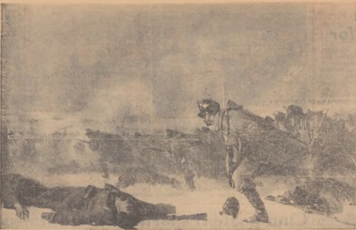
NICOLAE GRIGORESCU :