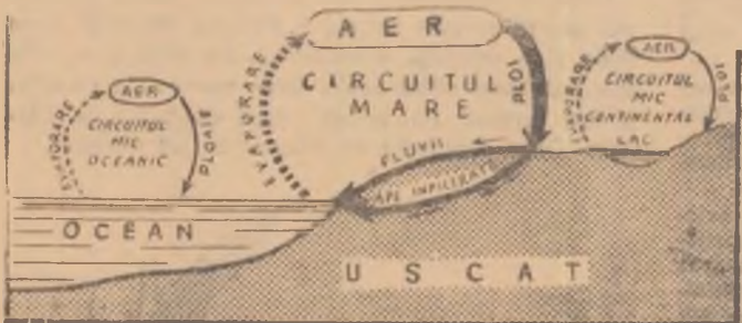
Fig. 1 - MICUL ȘI MARELE CIRCUIT AL APEI ÎN NATURĂ

formează un adevărat inveliș al pământului, care a și primit numele de hidrosferă (hidros = apă; sferă = inveliș) și care acoperă 3/4 din întinderea pământului. În adevăr, din cele 510 milioane km.p. cit este suprafața globului întreg, 361 milioane, adică 71 la sută aparține apei, iar restul uscatului.