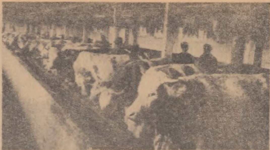
Gospodăria agricolă colectivă „23 August” din comuna Munteni-Buzău, raionul Slobozia, regiunea București, dă în folosință 2 grajduri noi pentru 100 de vite cornele. Vedere din unul din grajdurile gospodăriei colective.