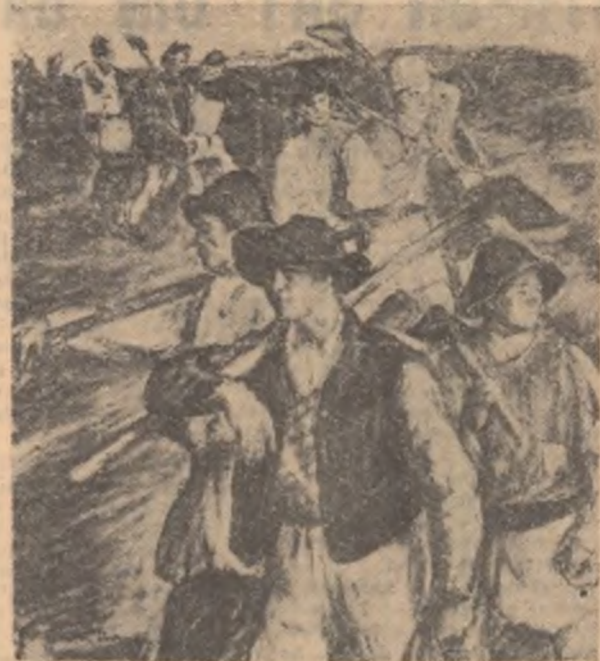
DAN HAITMAN „Colectiviști plecînd la lucru” (pictură)