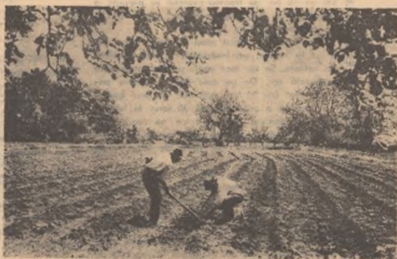
Prășitul roșiilor în grădina legumicolă a gospodăriei colective din comuna Valea Crișului, Regiunea Autonomă Maghiară.