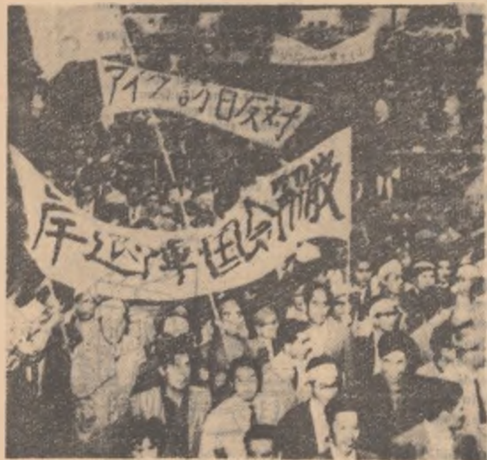
Tot mai dîrz se ridică poporul japonez împotriva tratatului militar cu S.U.A. și politicii guvernului Kiși. În fotografie: o puternică demonstrație a oamenilor muncii din Tokio.

Ratificarea frauduloasă în camera inferioară a dietei a tratatului de securitate japo-american, botezat de popor tratatul „negru” a așezut vigilența poporului japonez. Minia poporului împotriva guvernului trădător al lui Kiși se revărsă în valuri. Demonstrațiile anti americane și antiguvernamentale au ajuns la al 18-lea val, antrenînd pături din ce în ce mai largi ale populației. La demonstrațiile de sîmbătă au participat 2.000.000 de oameni.