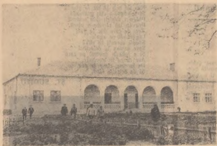
Noul cămin cultural din comuna Comana, regiunea Constanța.