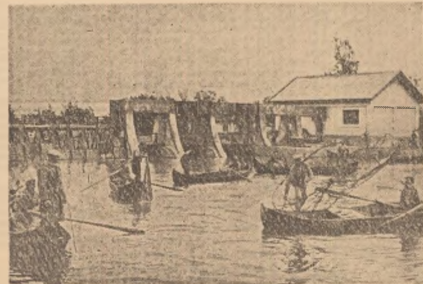
Aspect de la punctul pescăresc de pe canalul Filipoiu din bălțile Brăilei

Ion Gh oeni, se lă. Venec tîmînă. / luat cole tistic de trecînd brigada l cu urech scenă : — Hai — Nu — Hai — Dați — Aha, Va să ză Nu-i nim am să v- Coșereni. Și a ai glonț la așteptat de prinț. ra, o do plivit. Fri un lup ș zi, o dat cîmp. A l mini în r oat camp scenete lectivistul Acesta cazuri în s-a dove de briga șereni se turală. Ir