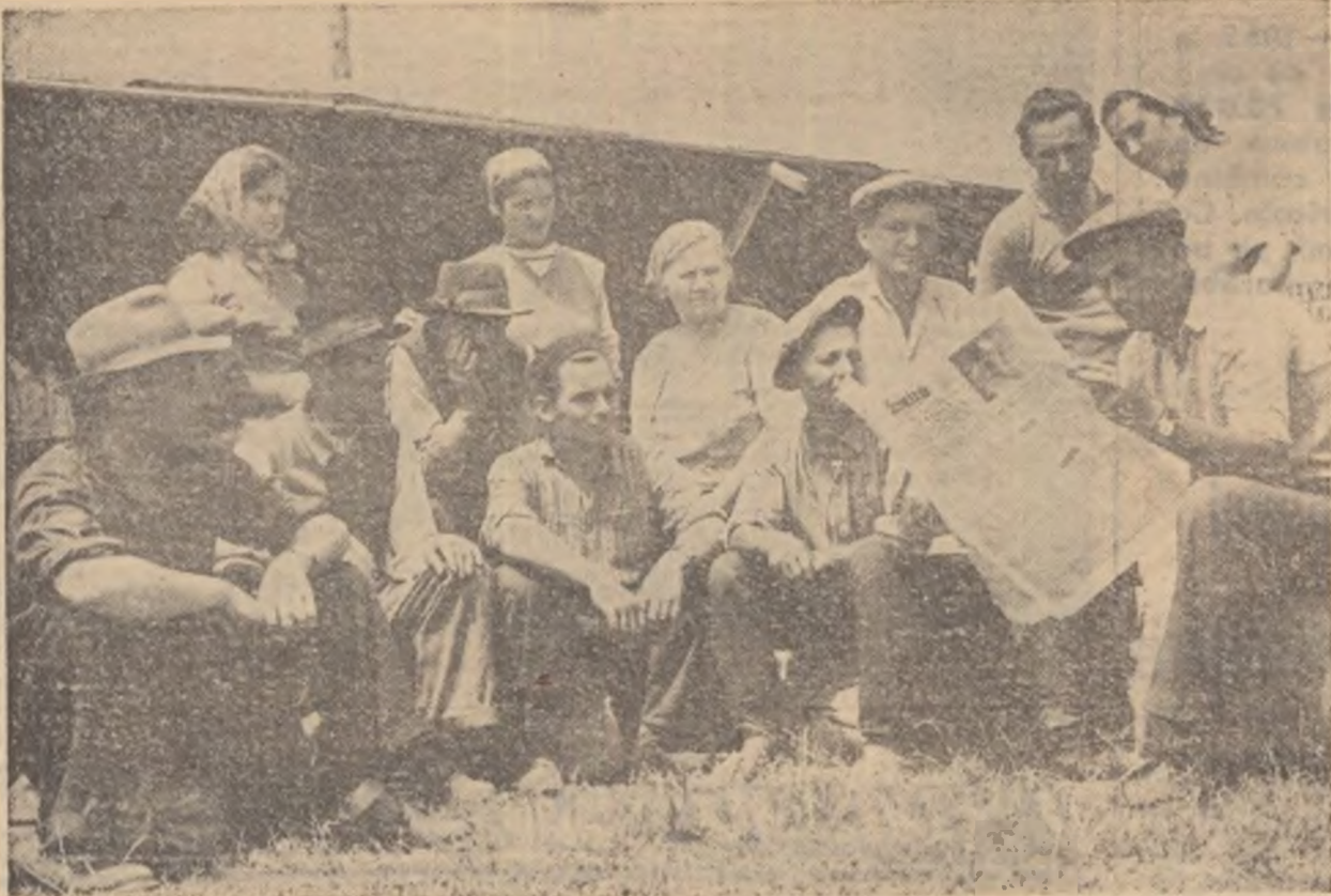
Intovărășiiți din Ciulnița, raionul Topoloveni, ascultă cu viu interes conținutul Hotărârii C.C. al P.M.R. și a Consiliului de Miniștri al R.P.R. cu privire la pregătirea și promovarea cadrelor tehnice, economice și de cercetare științifică, precum și la îmbunătățirea salarizării lor.