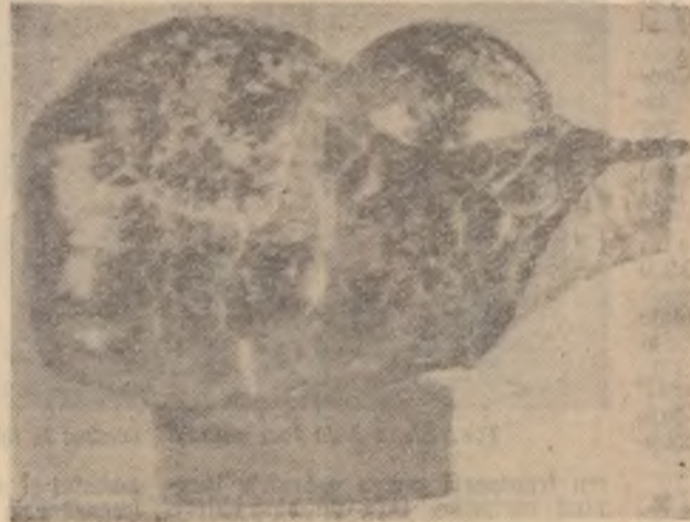
Aproape trei sferturi din greutatea acestui minereu este fier curat.

Directivele celui de al III-lea Congres al P.M.R. arată că: „În cadrul planului de 6 ani, partidul nostru va acorda în continuare o atenție deosebită INDUSTRIEI SIDERURGICE, condiție esențială pentru dezvoltarea tuturor ramurilor economiei. Producția