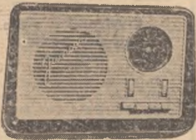
Aparatul „Junior”. Se produce, de asemenea, în serie.

...Să ne oprim puțin în fața a două panouri. Primul ne înfățișează o serie de cifre, printre care găsim fafete demne de laudă ale colectivului. Planul producției globale pe primul semestru s-a îndeplinit cu 6 zile mai devreme. Urmează economiile peste plan. Angajament pe întreg anul 7.500.000 lei. Îndeplinit pînă în prezenta începerii lucrărilor Congresului partidului, 2.548.000 lei. Aceasta însă nu este totul. Colectivul uzinei a mai economisit 18.000 kilograme metal ferros, apoi vopsele și lacuri, material de