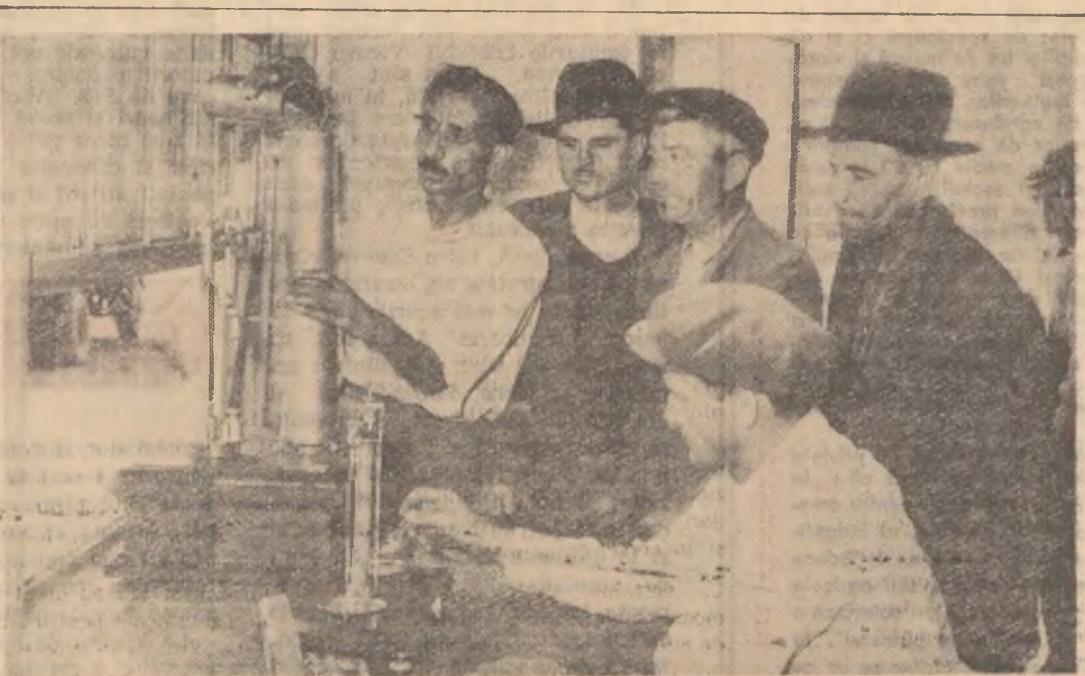
La baza de recepție din Slobozia se face analiza grîului adus de colectiviștii din comunele Iazu și Traianu.