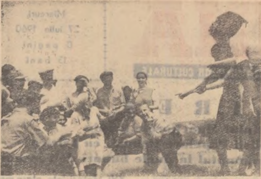
„Te văd, te văd”! Cu aceste cuvinte brigada artistică din Leordeni, regiunea Pitești, sosită pe arie, critică pe unii codăși în campanie.