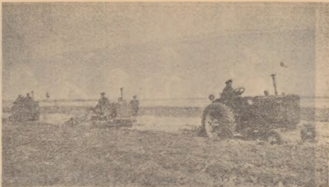
Îndată după recoltare, mecanizatorii au pornit la efectuarea arăturilor de vară.