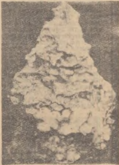
Meteorit căzut lângă Moci, regiunea Cluj, la 3 februarie 1882.

Încă de la începutul existenței sale omul a avut nevoie de unelte pentru a vîna, pentru a se apăra de dușmani, mai târziu pentru a munci pămîntul. Piatra o avea la îndemînă, dar era greu de prelucrat, iar bronzul, pe care l-a descoperit încă de la începutul civilizației, nu era suficient de rezistent. Străbunul nostru era de aceea pe bună dreptate fericit cînd găsea cîte o piatră „căzută din cer”... (meteorit), construită aproape în întregime numai din fier. Proprietățile minunate ale obiectelor confecționate din metalul meteoritic, au întărit convingerea omului neștiutor că pietrele acestea îi sînt trimise de „zeii” care locuiesc cerul. Pînă și astăzi, deși oamenii de știință au dovedit de mult că meteorii sînt