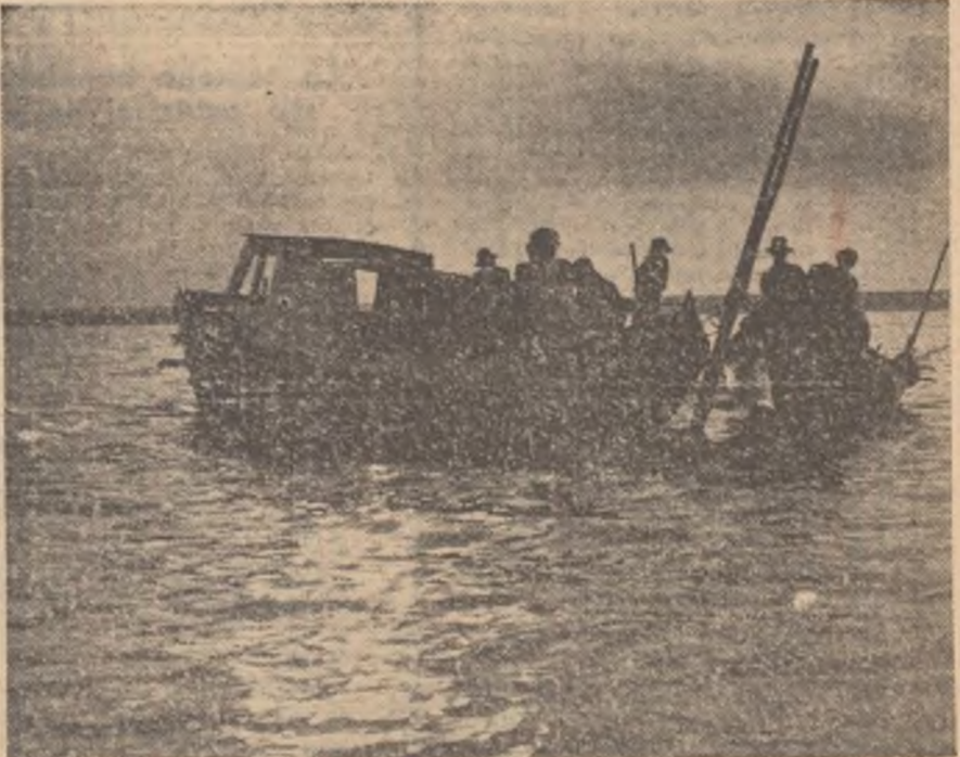
În amurg, la pescuit pe lacul Strachina, raionul Fetești.

...raja echipa îndrăgită, amintea de marile evenimente sportive bucureștene... Au mai fost întreceri la atletism, tenis de masă, șah... Au fost și curse de motorete: concurenții — țărani muncitori de pe valea Sucevei. A fost o duminică a cîntecului și jocului, pe plajuri înfrumusețate de munca omului liber, de minunata