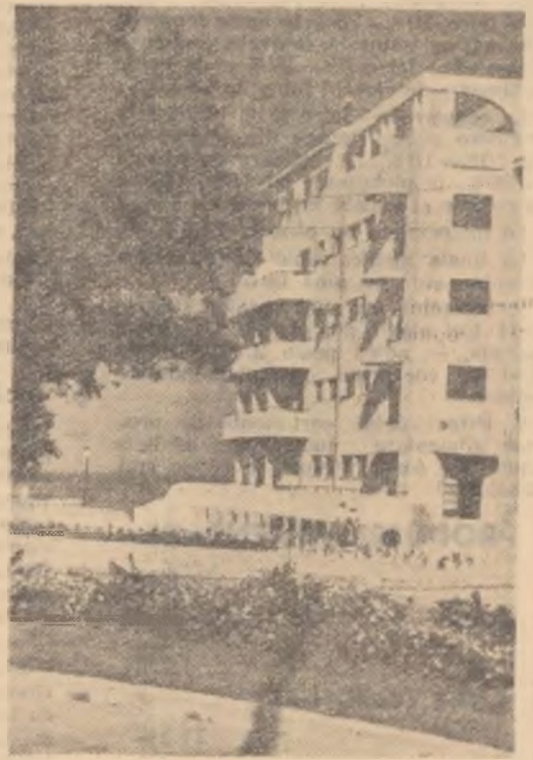
Unu din noile construcții de la Eforie.

A doua zi am poposit în stațiunea Vasile Roaia. Și aici, clubul și punctele culturale desfășoară o variată și atrăgătoare activitate. Seară de seară, sute și sute de oameni ai muncii veniți la odihnă sau tratament urmăresc cu un viu interes manifestările organizate la club și la cele 7 puncte culturale. Forma interesantă inițiată de club „Despre uzina unde lucrez și orașul în care locuiesc” a atras un mare număr de participanți. Muncitori de la Combinatul Siderurgic Reșița, sau de la Uzinele „Progresul” Brăila, au povestit tovarășilor lor lucruri deosebit de interesante despre uzinele și orașele lor.