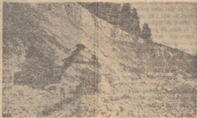
Încărcarea minereului de fier în vagonete (mina Teliuc).