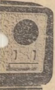
...trat în producție ...e 1960.

...deosebire de ce- ...stea funcționează ...nziștii în ocu- ...cu toate nevoie