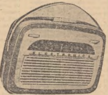
Aparatul „Litoral” cu tranzistori. Cîntărește 2 kg.

V-ați întrebat vreodată cîte tipuri de aparate au creat harnicii tehnicieni și muncitorii de la „Electronica” în cei 11 ani de muncă? Ei bine, pînă în prezent s-au creat și dat în folosință 45 de tipuri de aparate românești. Dreptul de părinte al tuturor îi revine aparatului „Record”. E cel mai în vîrstă, deși împlineste abia 11 ani. Urmează apoi o serie de aparate bine cunoscute de publicul nostru, printre care se numără „Pionier”, „Partizan”, „Olt”, „Doina”