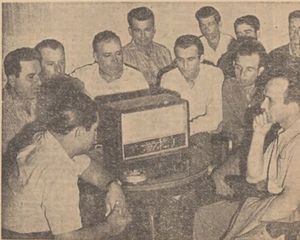
La clubul Grivița Roșie — în jurul aparatului de radio.