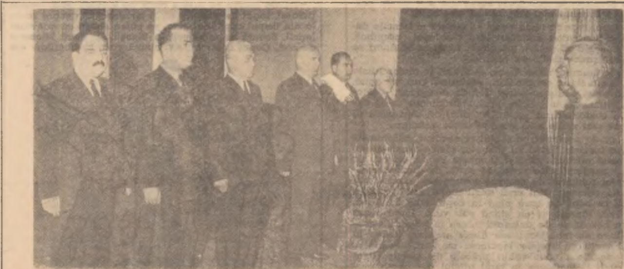
La ambasada R. D. Germane: Conducători ai partidului și statului în fața bustului tovarășului Wilhelm Pieck.